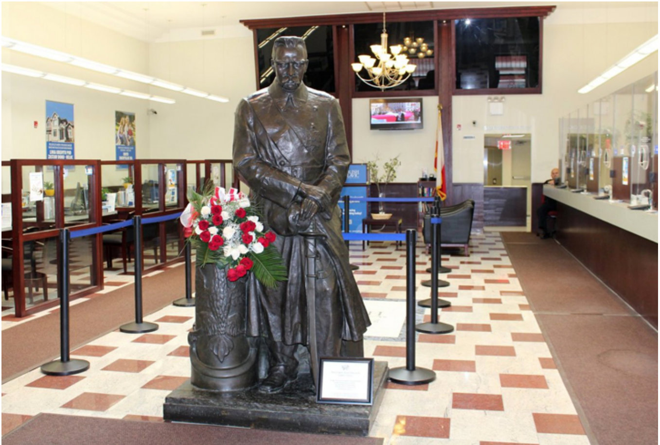
Pomnik Marszałka Piłsudskiego w oddziale PSFUK (Polish and Slavic Federal Credit Union) na 140 Greenpoint Ave. w Nowym Jorku.