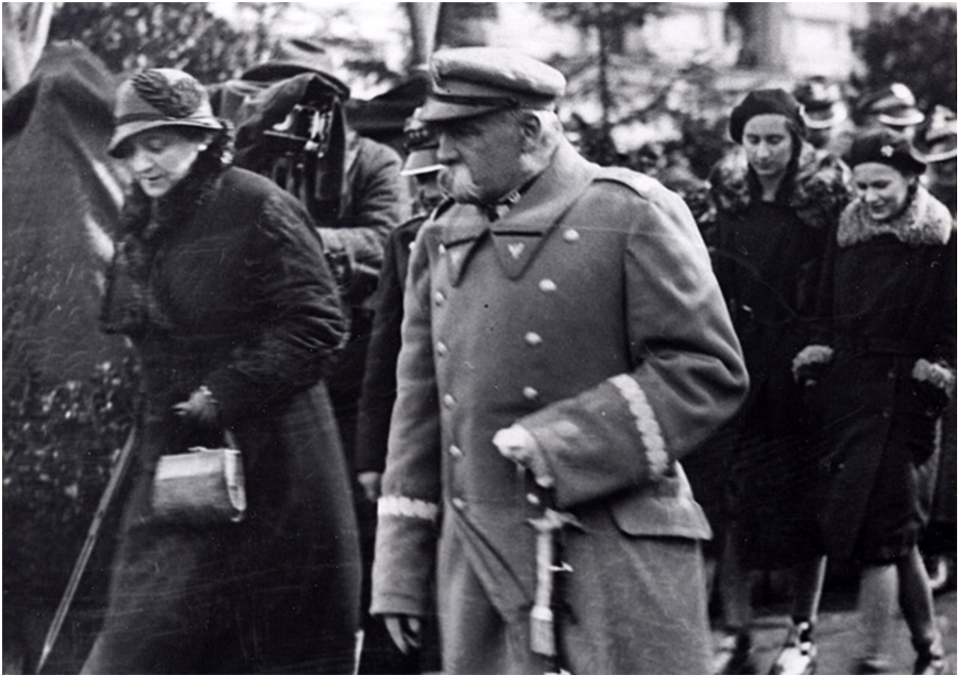
Józef Piłsudski w otoczeniu najbliższej rodziny.