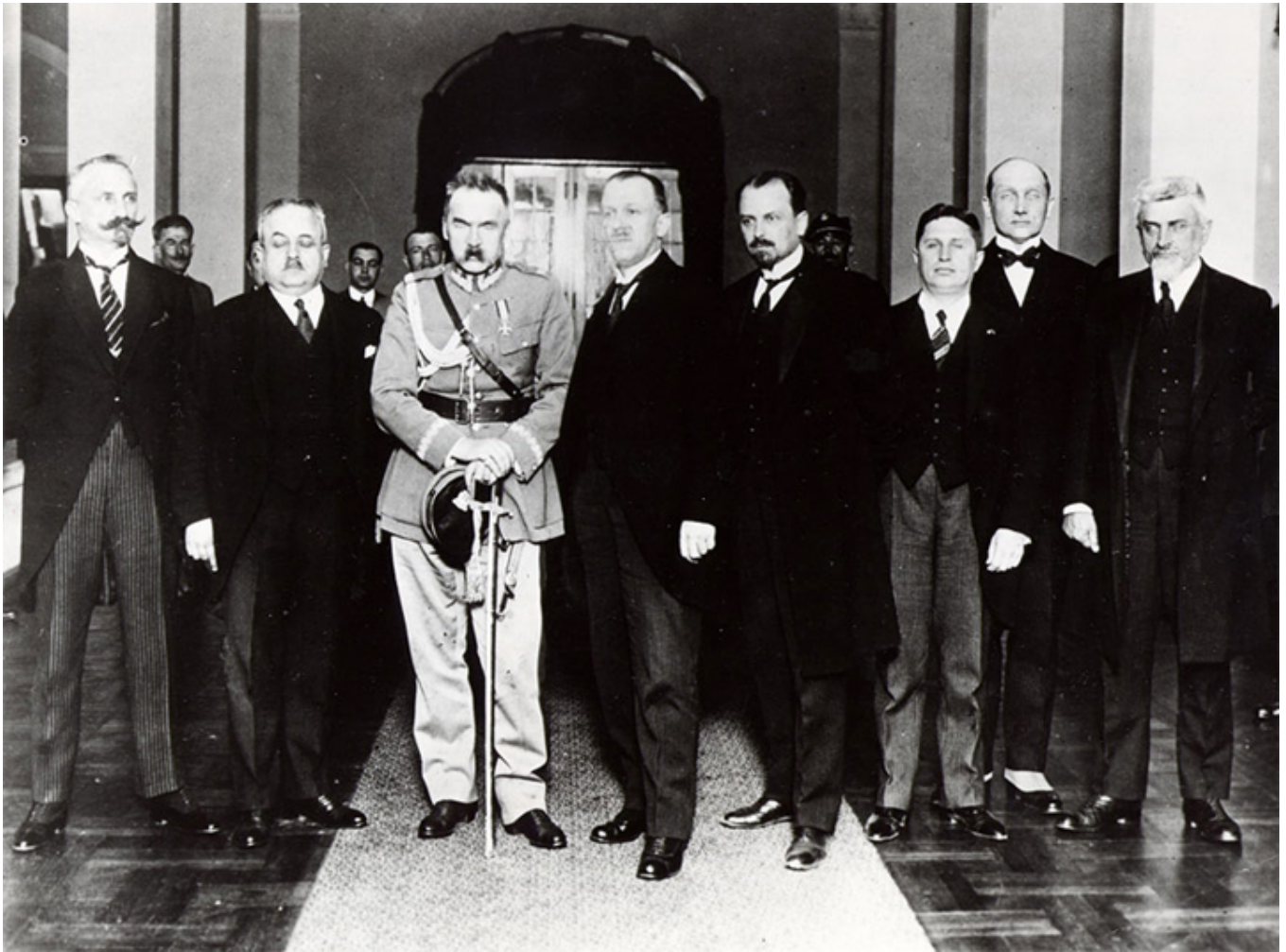
Józef Piłsudski z gabinetem Kazimierza Bartla 1926 r.