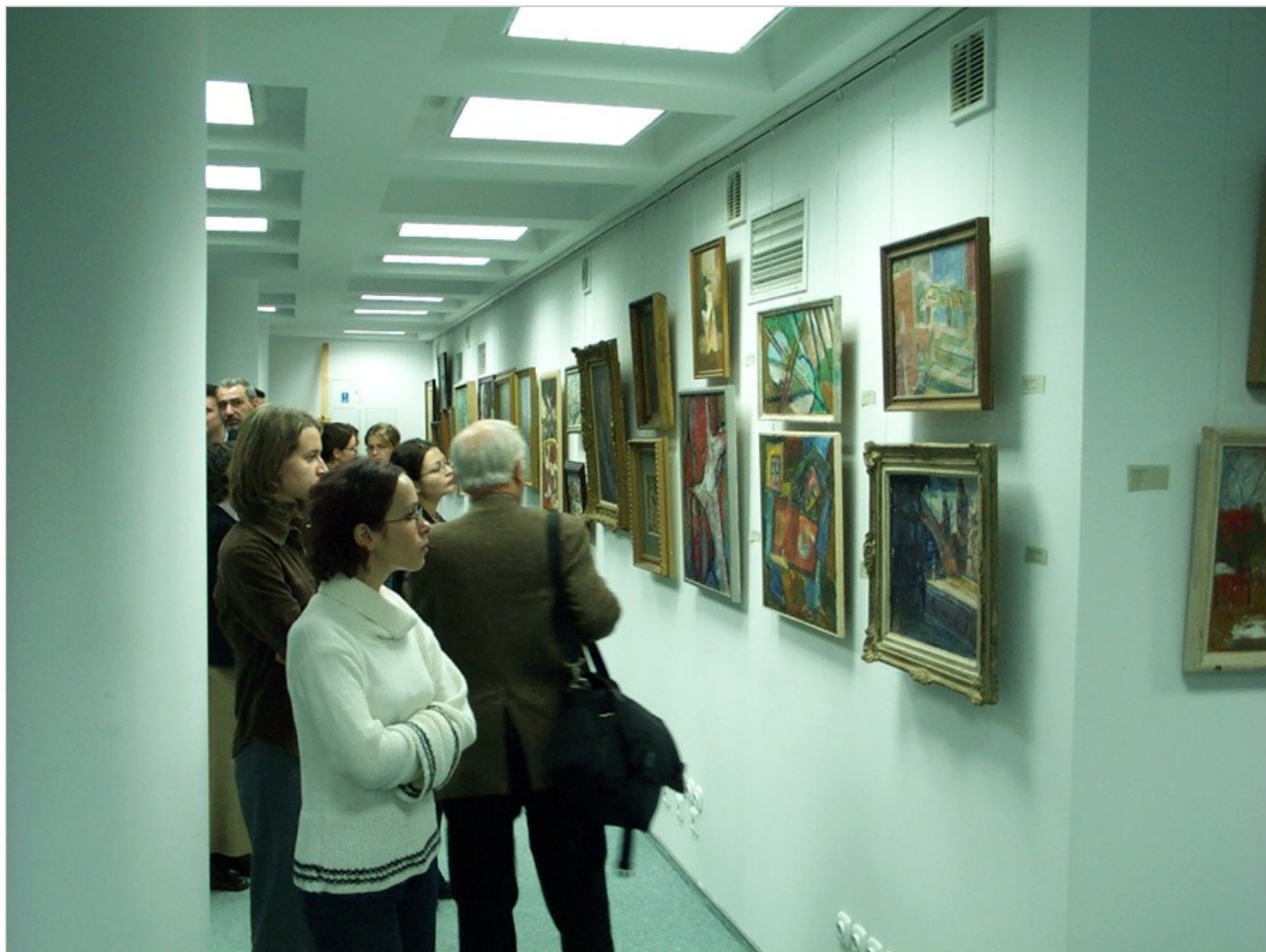
Archiwum Emigracji, Galeria, Toruń