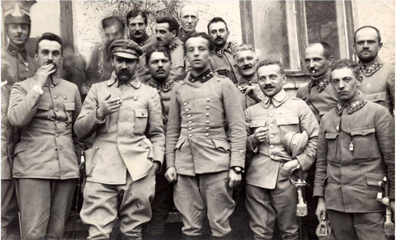
Imieniny Marszałka 19 marca 1915 roku. Józef Piłsudski otoczony jest żołnierzami z Legionu.