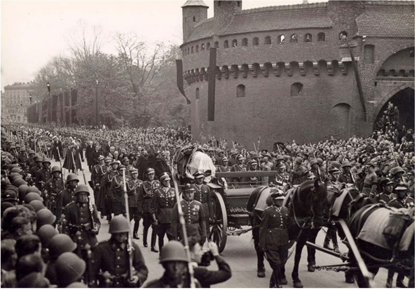
Pogrzeb Józefa Piłsudskiego, kondukt żałobny w Krakowie w okolicy Barbakanu, 18 maja 1935 r.