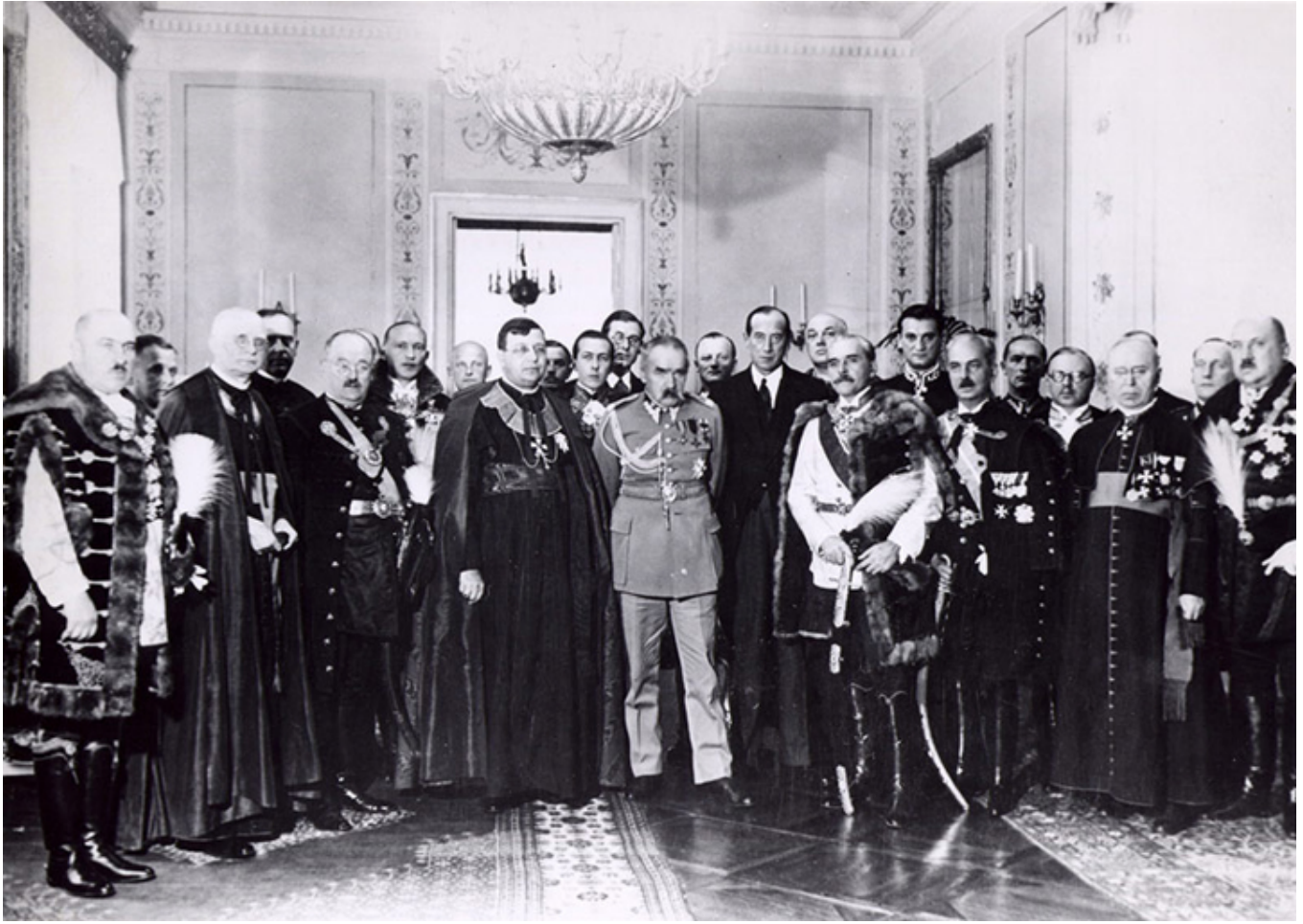
Józef Piłsudski z delegacją węgierską w Belwederze, 1933 r.