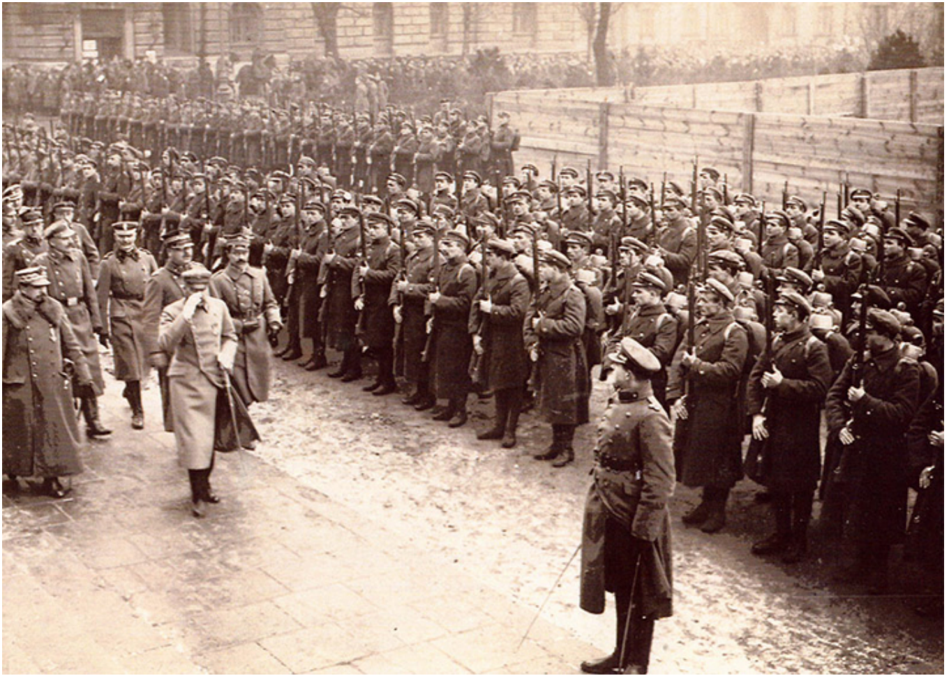
Józef Piłsudski wizytuje wojsko polskie przed wymarszem na front wschodni, 1920 r.