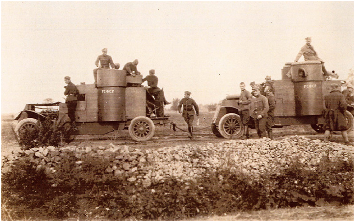
Sowieckie wozy pancerne zdobyte przez wojsko polskie w wojnie polsko-bolszewickiej 1920 r.