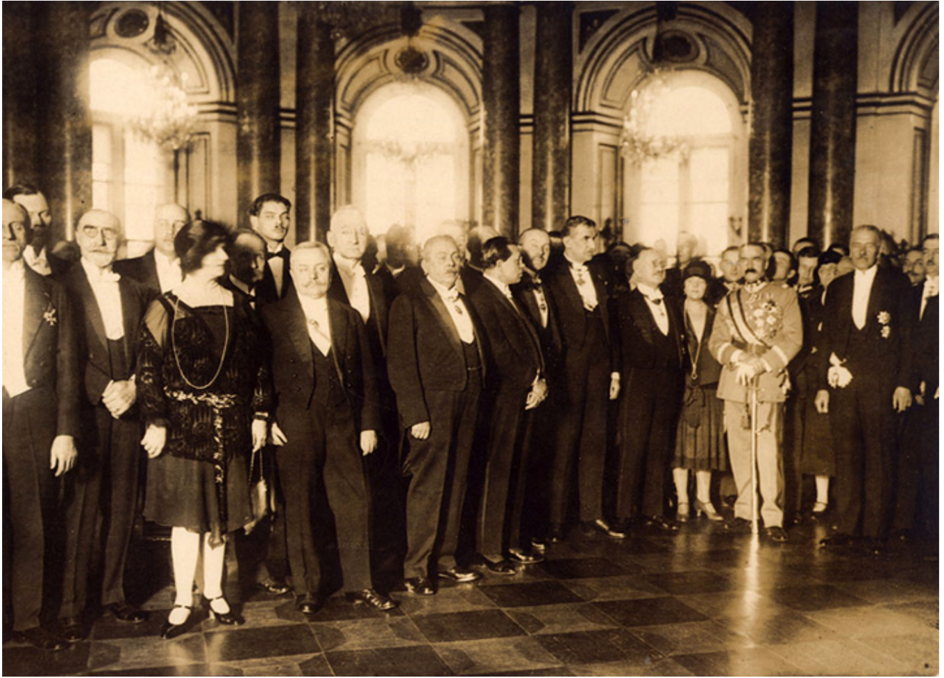
Józef Piłsudski z prezydentem Mościckim i korpusem dyplomatycznym.