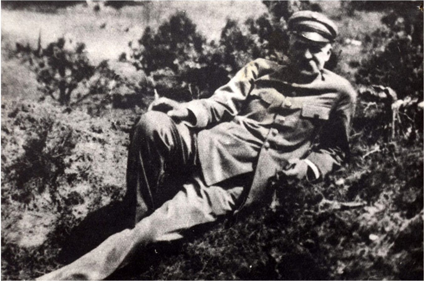
Józef Piłsudski na wypoczynku w Druskiennikach.