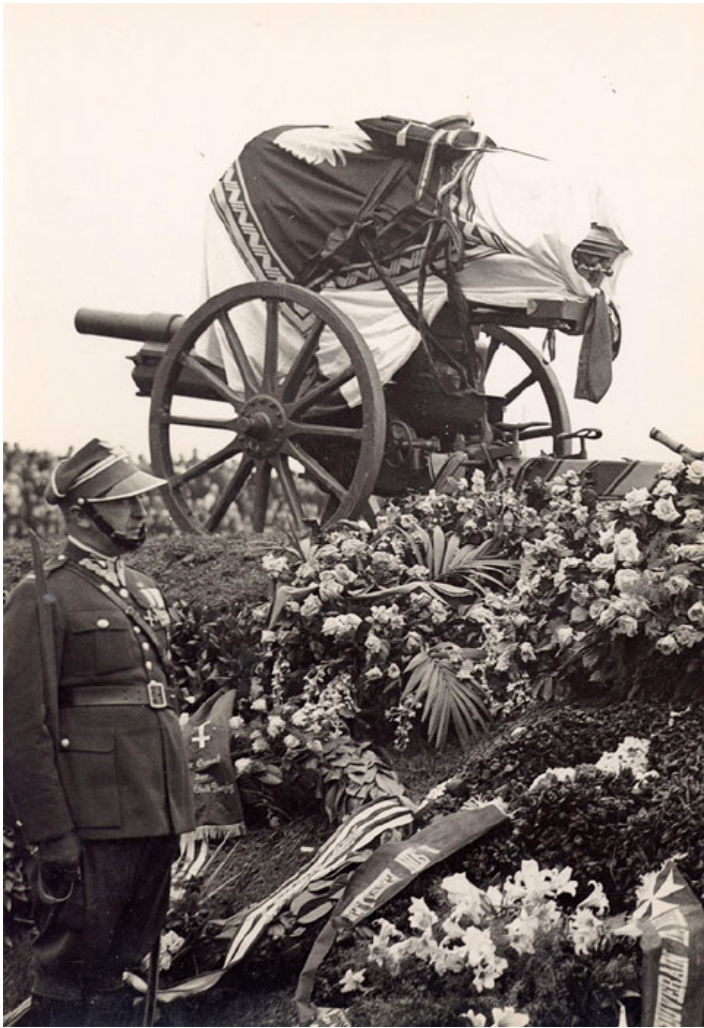
Pogrzeb Józefa Piłsudskiego, Warszawa Pole Mokotowskie, 17 maja 1935 r.