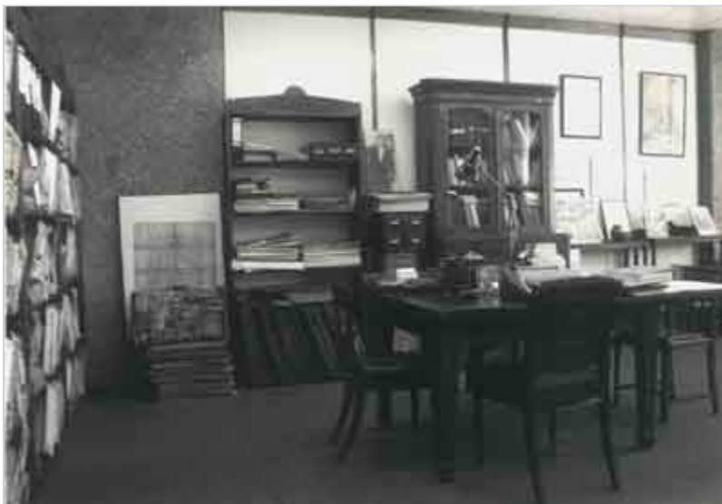
Archiwum Emigracji, Toruń