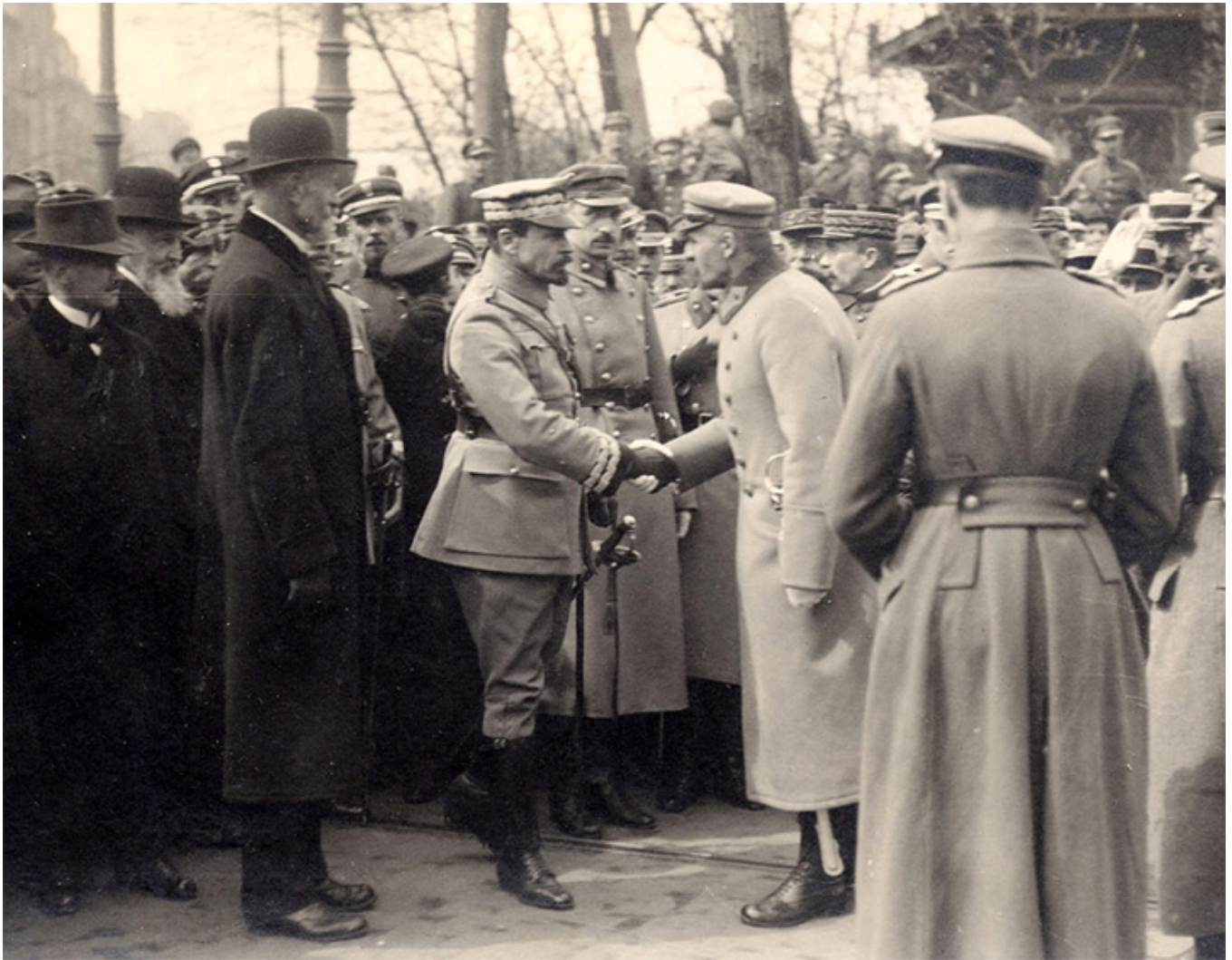
Józef Piłsudski i gen. Józef Haller, kwiecień 1919 roku. Gen. Józef Haller był dowódcą Armii Błękitnej złożonej z polskich ochotników w Ameryce Północnej.