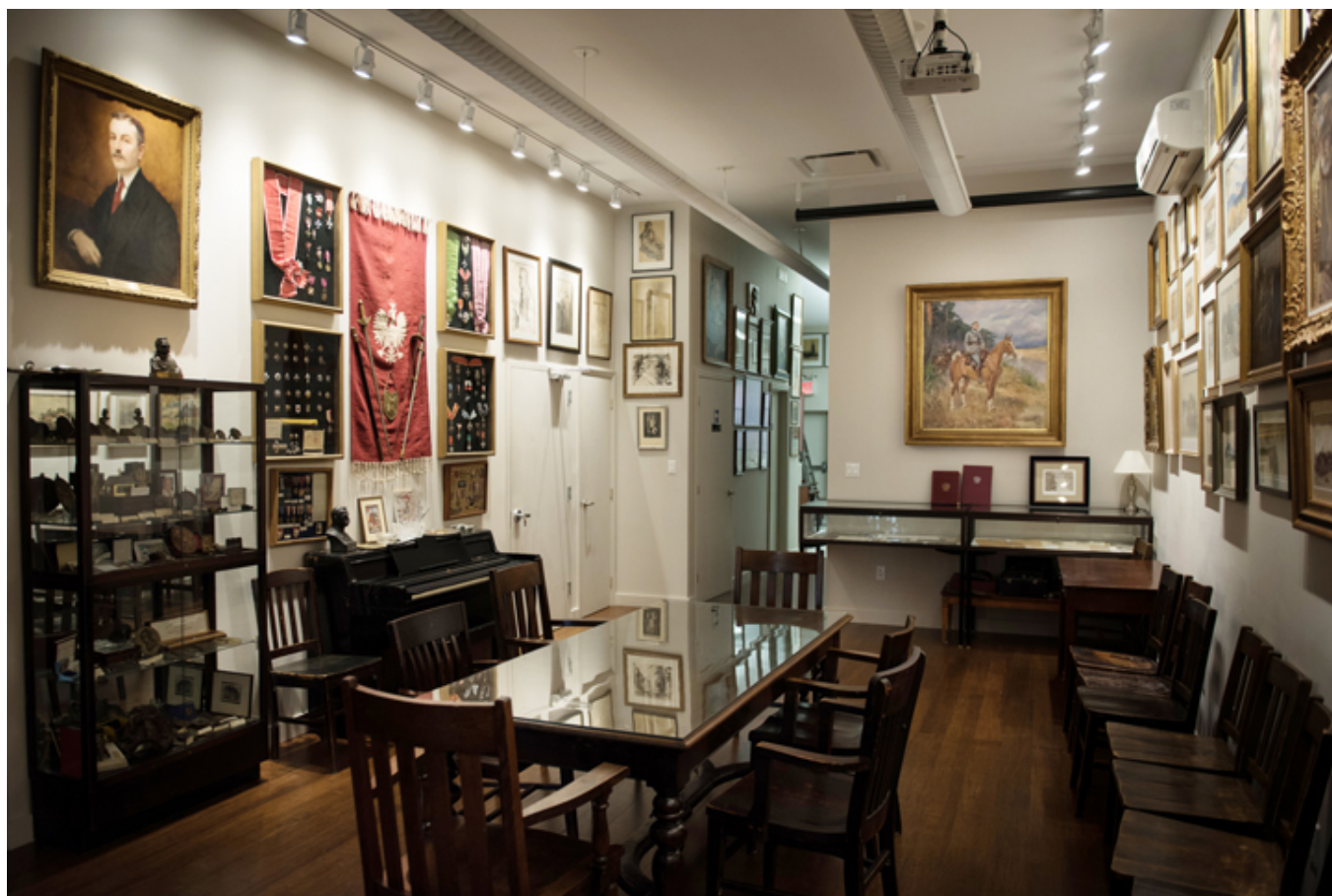
Instytut Piłsudskiego w Nowym Jorku