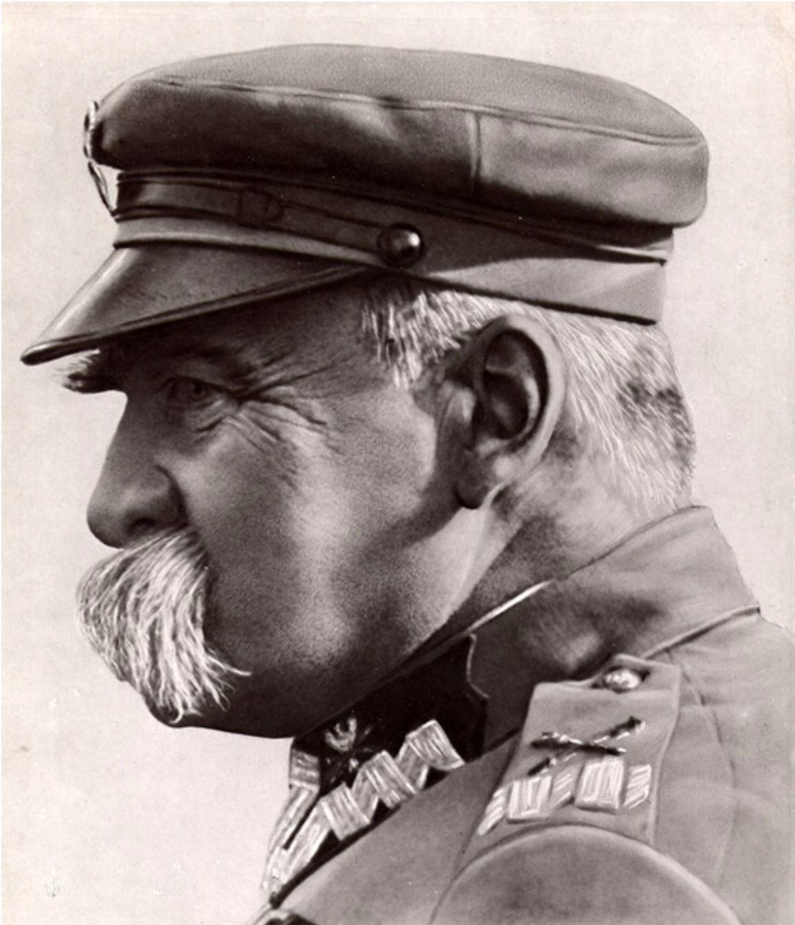
Portret Marszałka Józefa Piłsudskiego