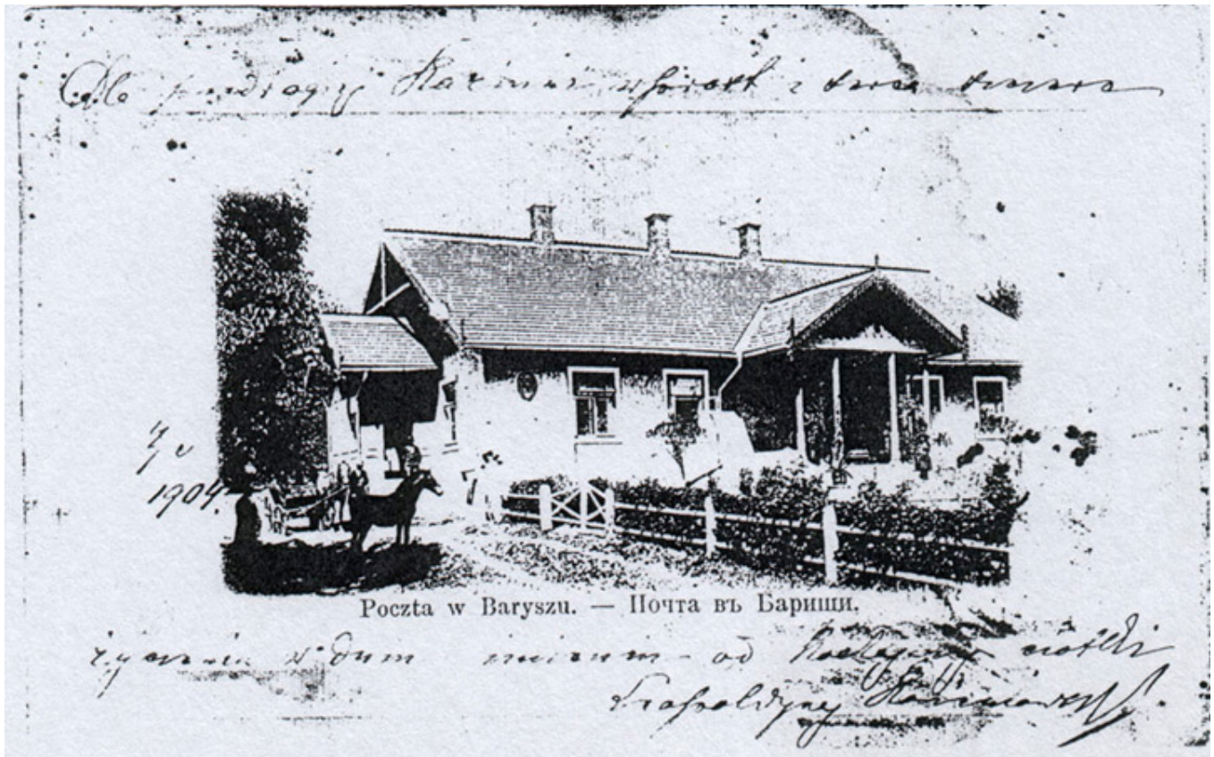
Barysz, dom Aliny i Leopoldyny Korzeniowskich, fot. arch. R. Sawickiego.