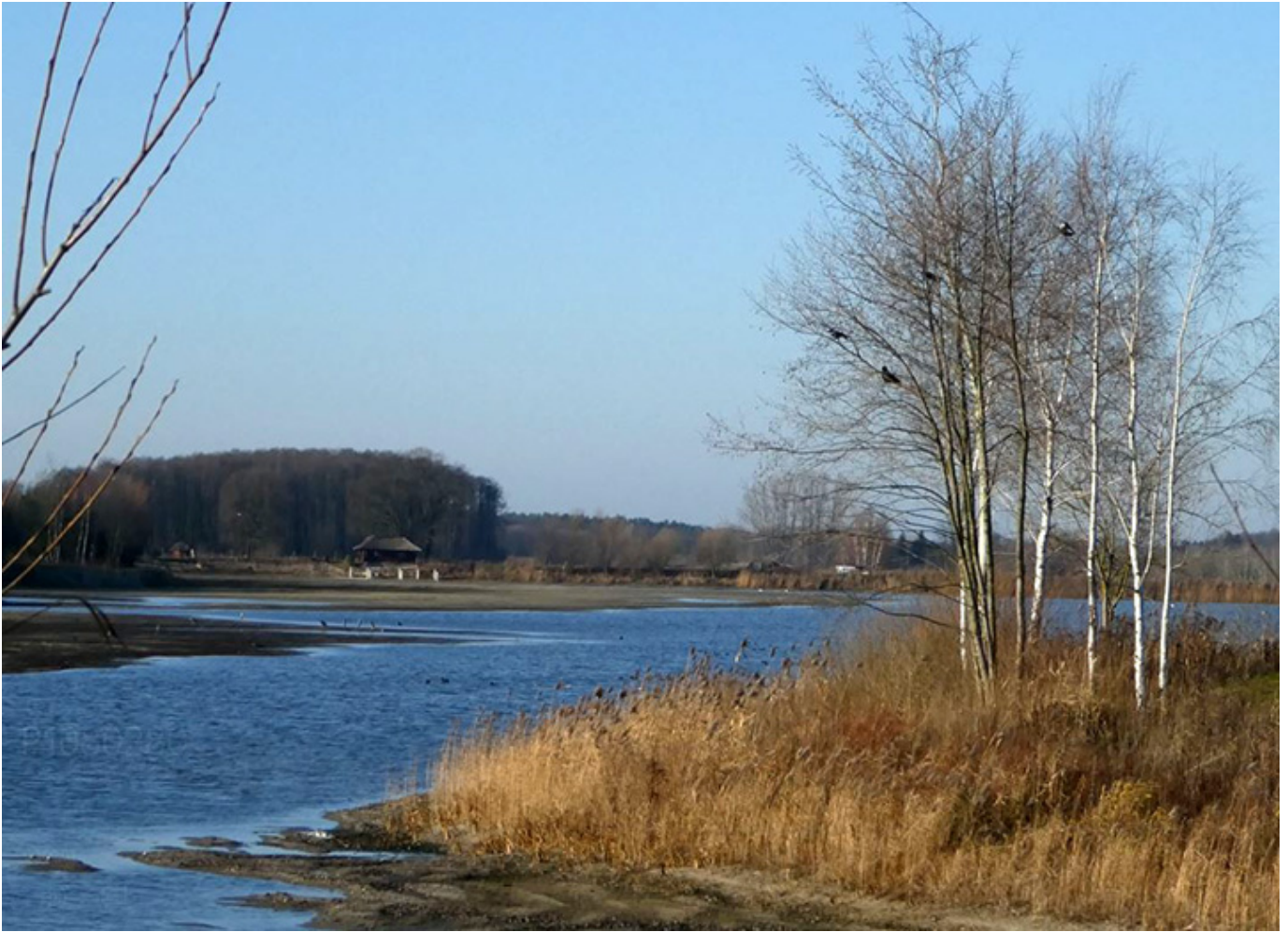
Malownicze stawy rybne w Bełdowie/Zgniłych Błotach, fot. Andrzej Sokołowski