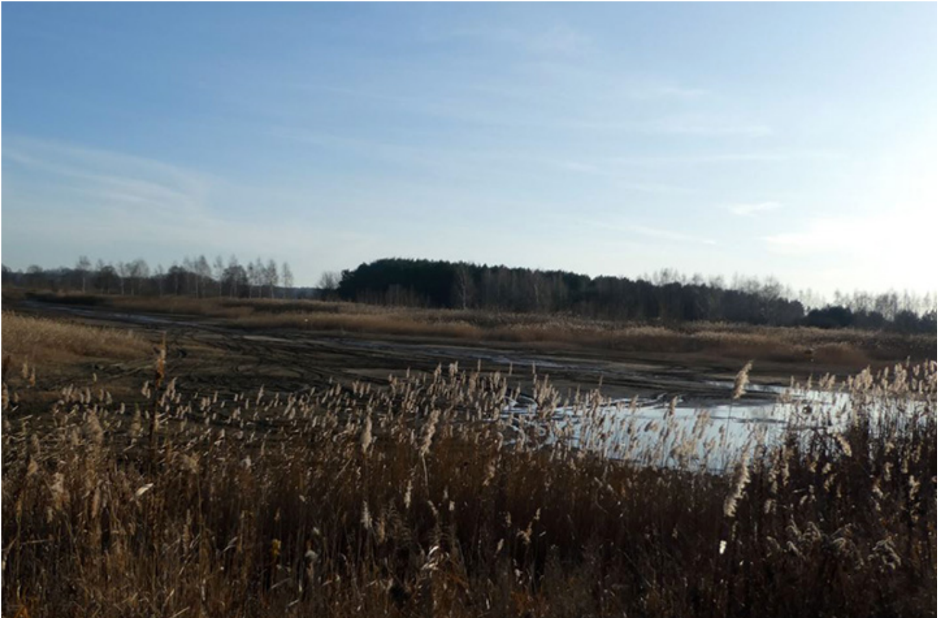
Malownicze stawy rybne w Bełdowie/Zgniłych Błotach