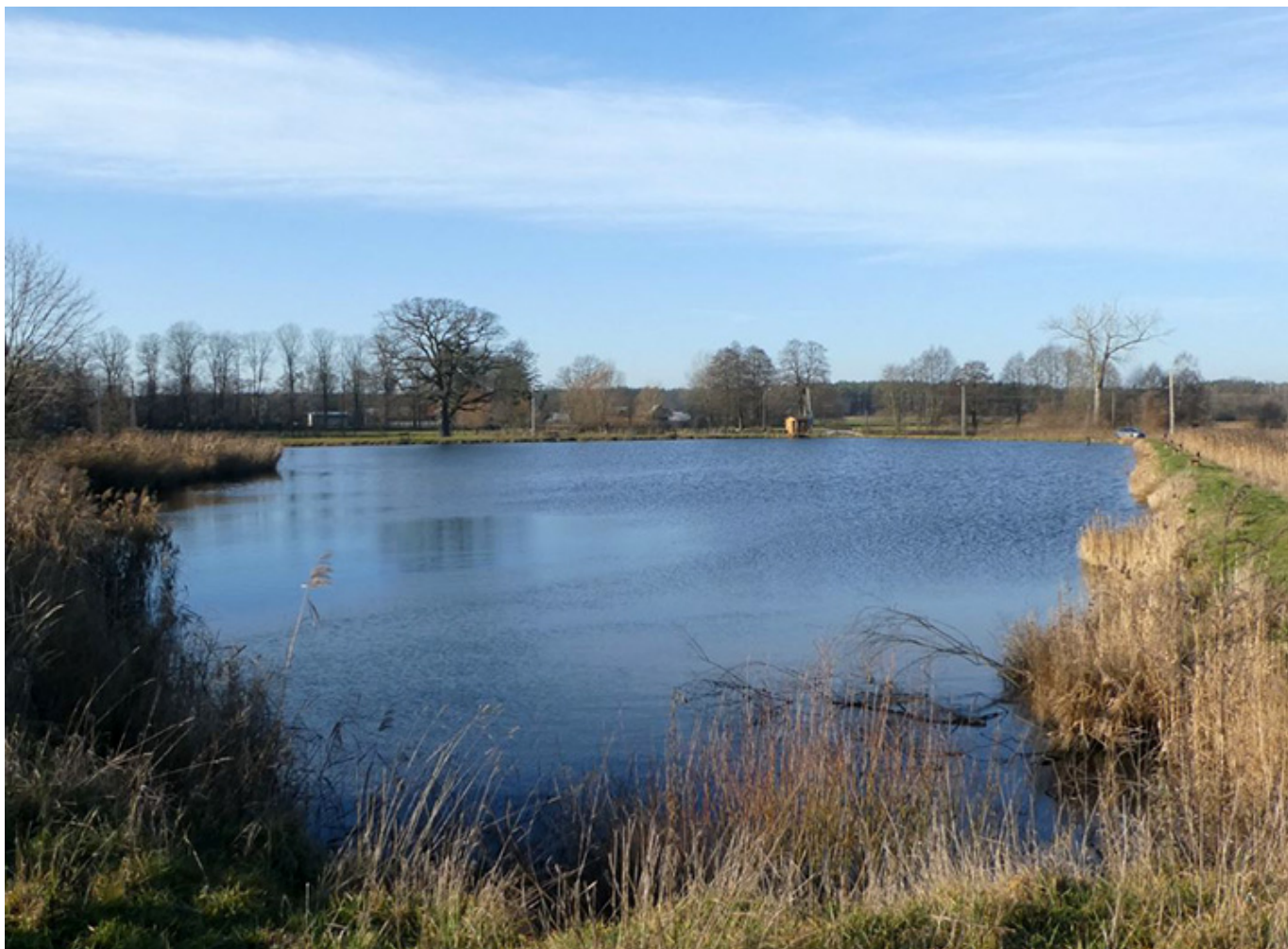
Malownicze stawy rybne w Bełdowie/Zgniłych Błotach