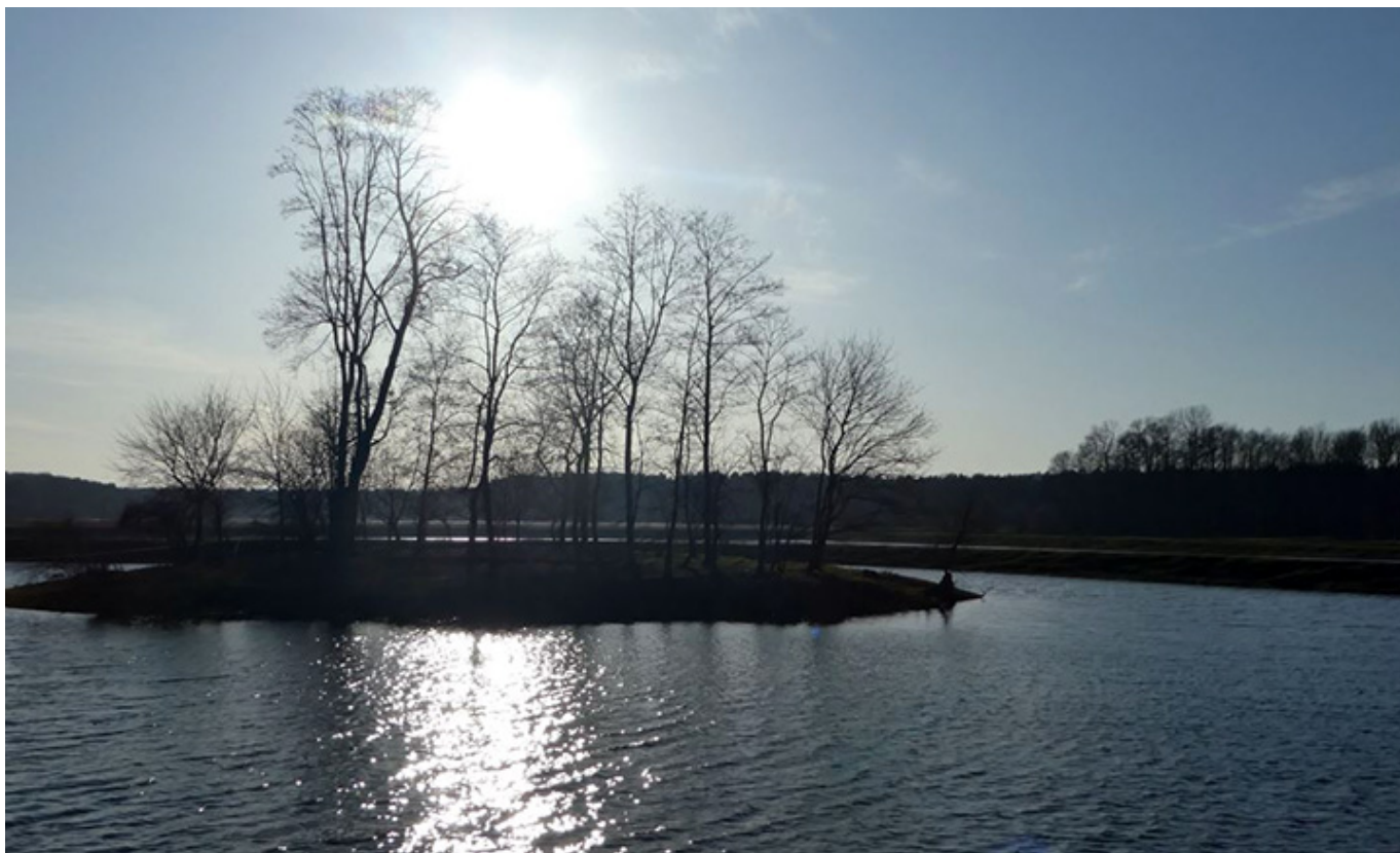
Malownicze stawy w Bełdowie