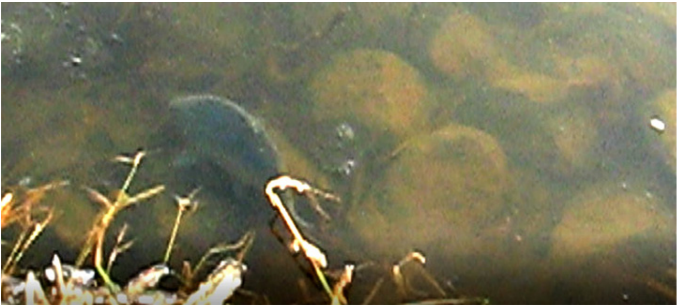
Karp wypuszczony na wolność

Kiedy tata zachorował, prawie rok opiekowałam się nim w Polsce. Wtedy byłam też na ostatniej wspólnej Wigilii w 2013 r. Czuliśmy, że może przyjść najgorsze, ale nikt z nas nie chciał się do tego przyznać. Szykowaliśmy z tatą Świąta, jakby nic się nie miało zdarzyć. Kupiliśmy najpiękniejszą choinkę, jaka kiedykolwiek była w domu.