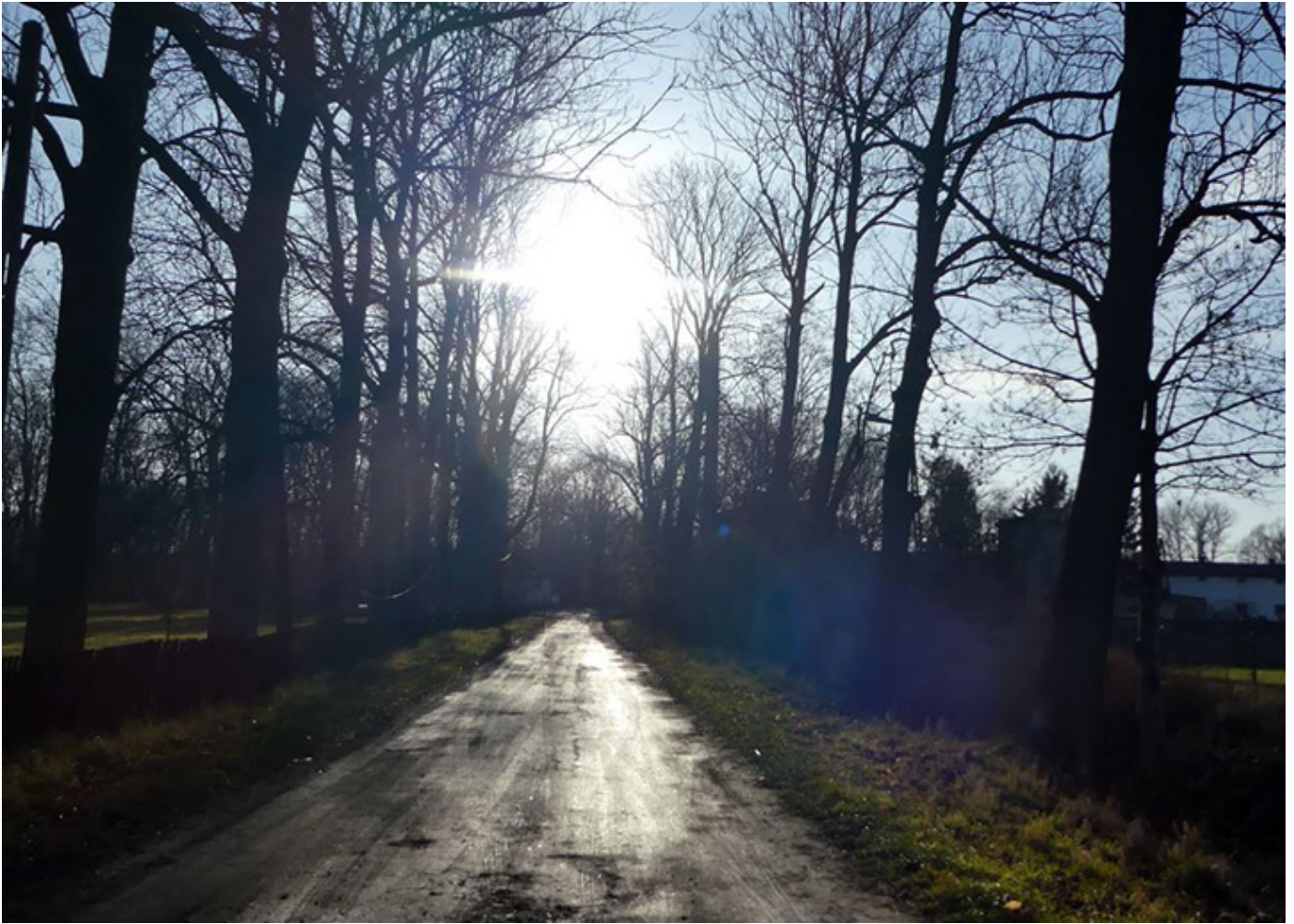
Aleja lipowa prowadząca do dworu w Beldowie