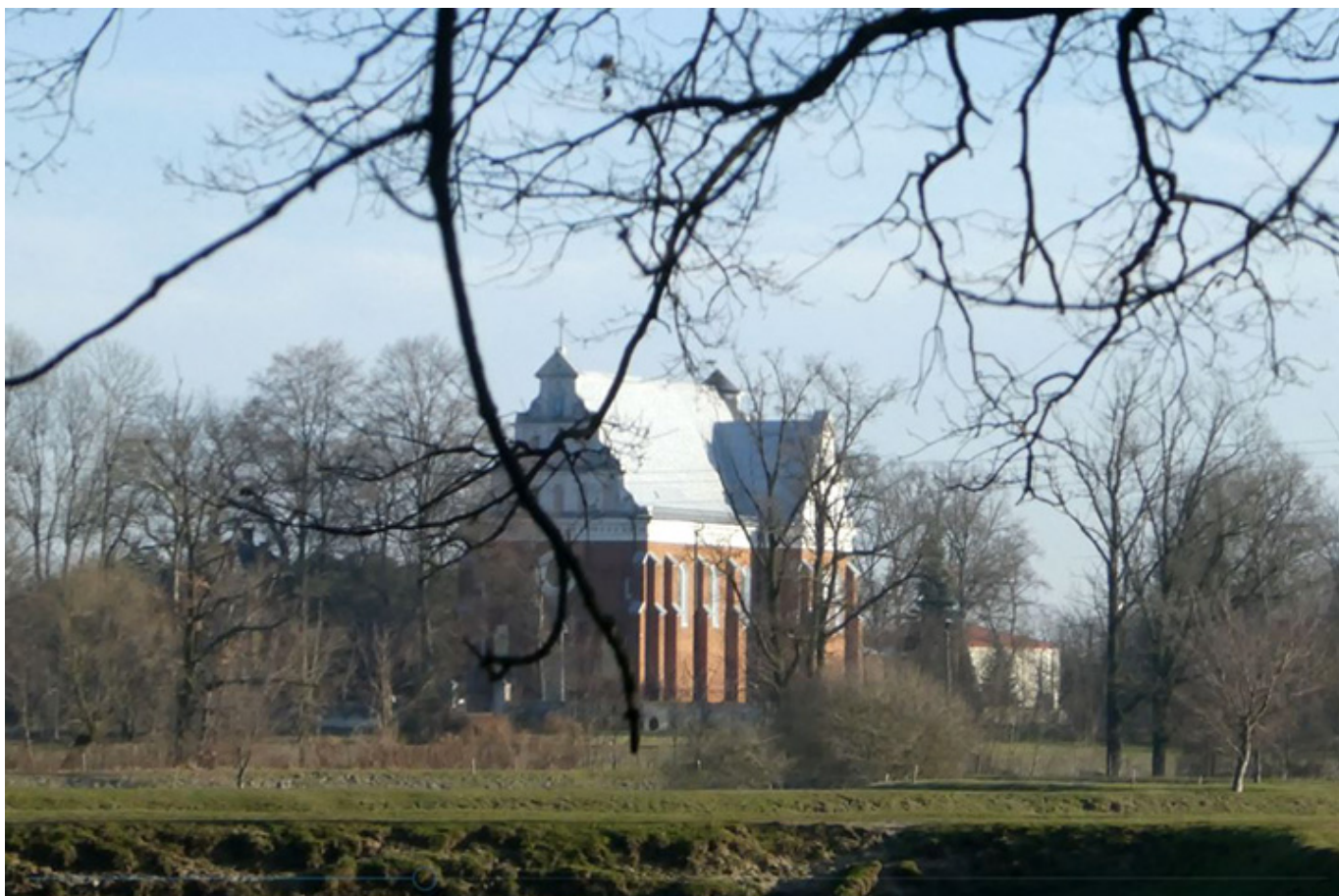
Kościół Wszystkich Świętych w Bełdowie

Prowadzi do niego aleja wysadzana lipami. W pobliżu znajduje się park o charakterze krajobrazowym, w którym można odnaleźć okazy drzew liczących po 250 lat, przeważają dęby, lipy i topole białe, a także wiązy, klony, świerki i modrzewie. Na skraju parku mieści się kopiec stanowiący pozostałość po starszym dworze.