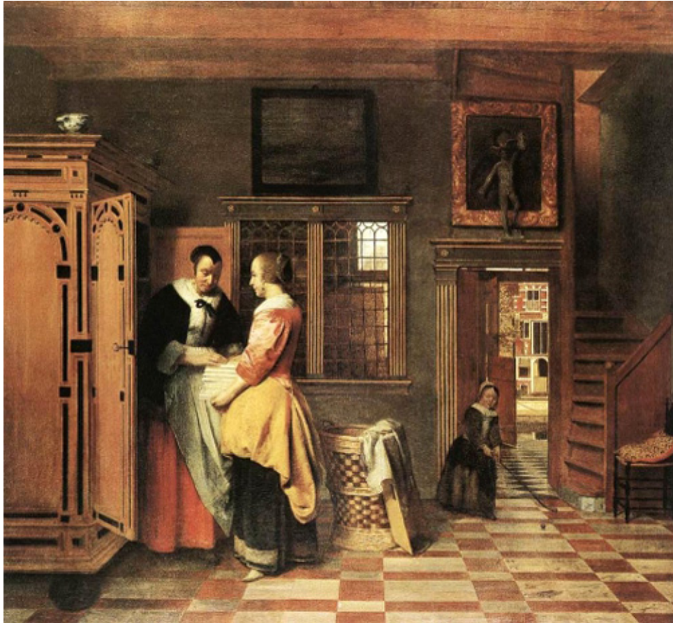
Pieter de Hooch, wnętrze z kobietami przy bielizniarce, 1663 r.

schludny, uporządkowany świat holenderskiego mieszczaństwa, w którym intarsjowana bielizniarka zajmuje centralne miejsce, zaś stojący przy drzwiach kosz z brudną bielizną symbolizuje brud i nieporządek, którego należy się wystrzegać.