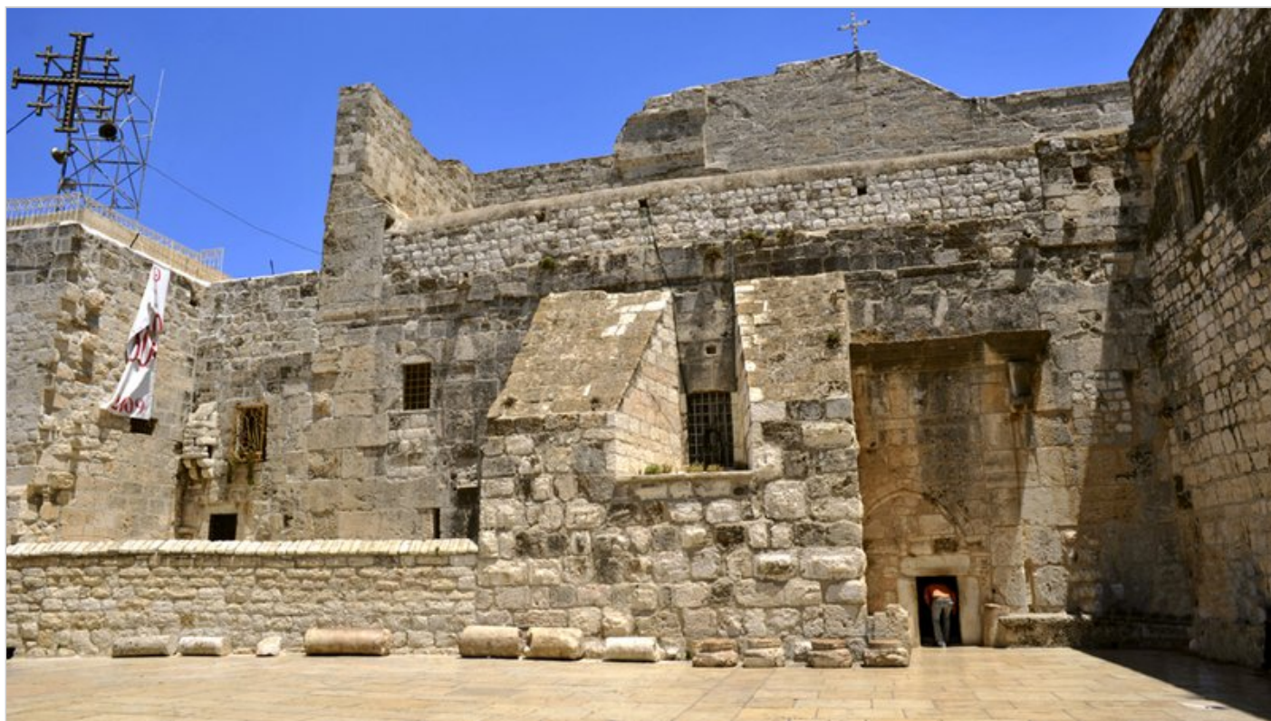
Bazylika Narodzenia Pańskiego.

zostało nienaruszone, od początku zaznaczane na różne sposoby. Ostatni taki znak, to wielka czternastoramienna srebrna gwiazda z napisem po łacinie, w tłumaczeniu na język polski brzmiącym: „Tu z Maryi Dziewicy Jezus Chrystus się narodził 1717.” Grabienie relikwii skończyło się kiedy powiększona przez łowców relikwii grotę została obmurowana, a sufit otrzymał sklepienie. Dziś to małe sanktuarium o rozmiarach: dwanaście metrów długie, trzy metry szerokie i wysokie, z ołtarzem i kapliczką żłóbka, położone pod wielkim ołtarzem bazyliki.