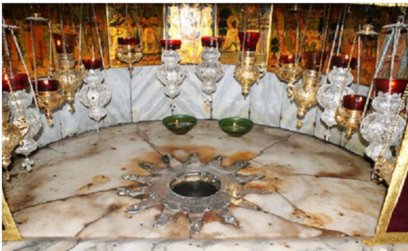
Grota Narodzenia obecnie.

wymordowali się nawzajem. Część ludności ukrzyżowano, a gdy już krzyży zabrakło, dużą ich liczbę wysiedlono poza granice państwa. Dość dużo Żydów pozostała w kraju. Dali się jeszcze raz porwać do walki w roku 130 n.e. przez Bar Kochbę. Teraz potęga rzymska natychmiast zapanowała nad sytuacją, przeszła przez Palestynę, nastąpiło kompletne zniszczenie kraju, mordy, lub wywiezienie resztek ludności daleko od Palestyny.