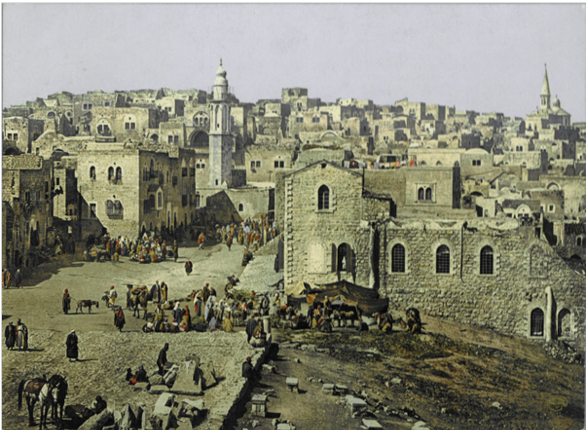
Betlejem ok. 1880 r.

religijnych, funkcjonowanie Świątyni, synagog, i choć z uporem, uznali status quo . Trzecia warstwa, esseńczycy, uznali jakikolwiek opór za bezsensowny, umartwiali się, pościli, wyrzekali małżeństw, przenosili się do jaskiń na pustyni, by tam jak najlepiej przygotować się na koniec świata, który miał lada chwila nastąpić. To między innymi mieszkańcy wspomnianego Qumran. Jest rzeczą bardzo prawdopodobną, że Chrystus zatrzymywał się u nich po drodze od rzeki Jordanu do Jerozolimy. Czwarta warstwa, zeloci, to zaprzysięgli bojownicy o wolność.