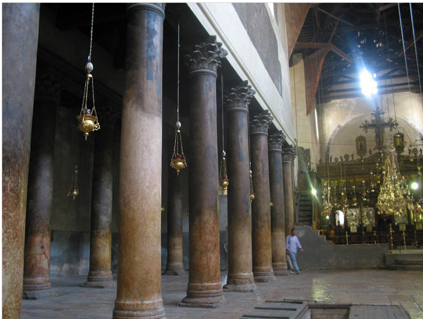
Wnętrze Bazyliki Narodzenia Pańskiego.

wjeżdżali do niej na koniach, by chronić świątynię przed beczeszczaniem zamurowano portale - w jednym z nich zostawiono niskie wejście około metra szerokości. W czasach wypraw krzyżowych i później zmieniano posadzki, jeden z królów angielskich posłał drewno na nowy sufit, ksiązę Burgundii ołów na dach, który później przez "niewiernych" przetopiono na kule, tak że chrześcijańscy bojownicy umierali pięknie, honorowo, zabijani kulami ze świętego miejsca.