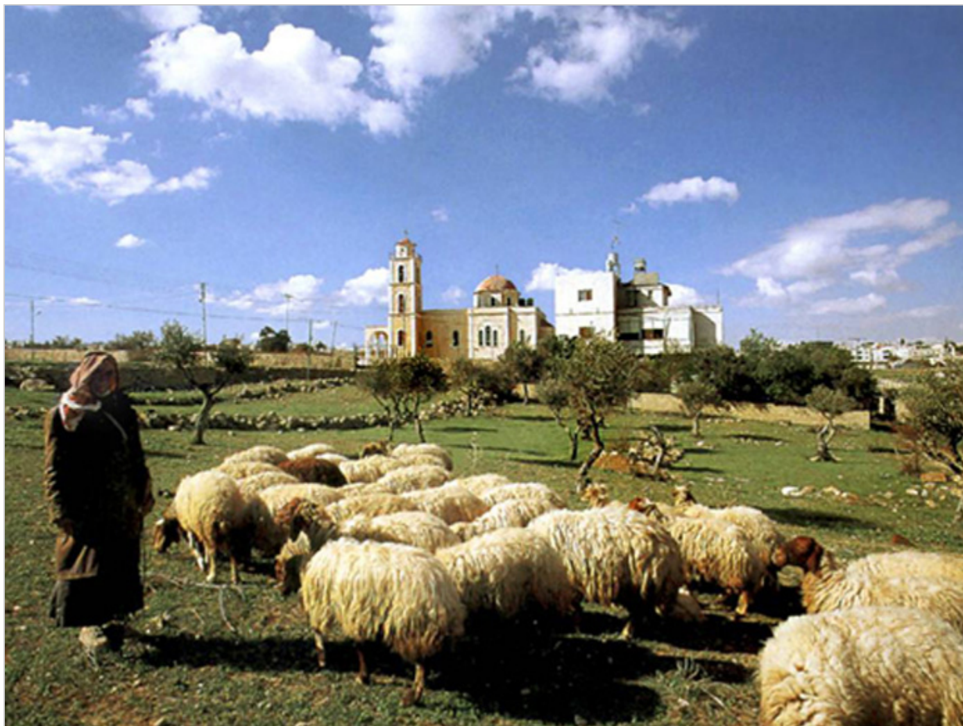
Pastwisko oddalone o ok. 1 km od Betlejem.