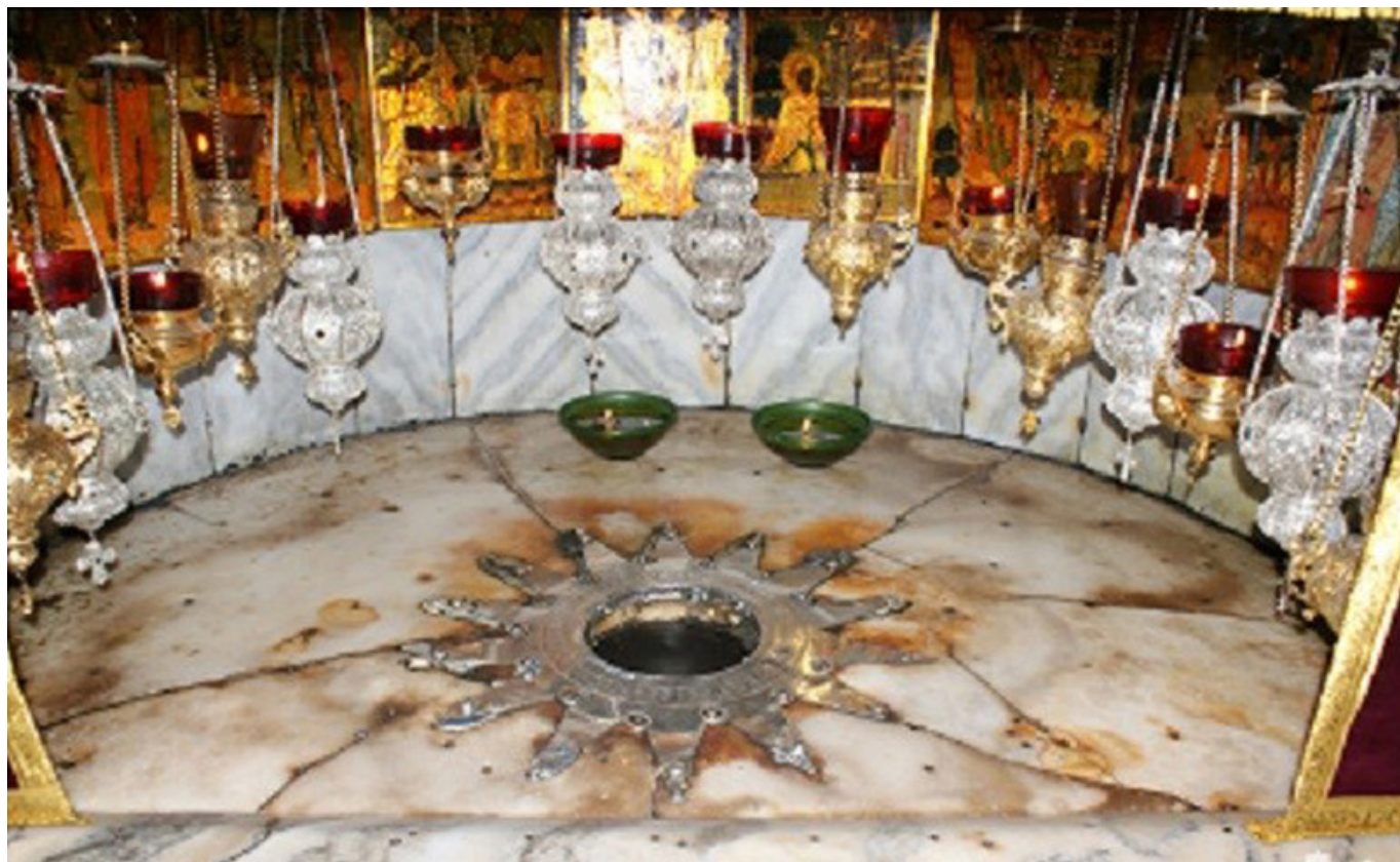
Grota Narodzenia obecnie.