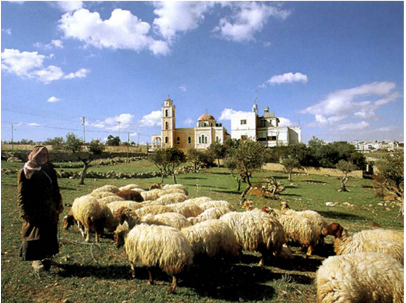
Pastwisko oddalone o ok. 1 km od Betlejem.