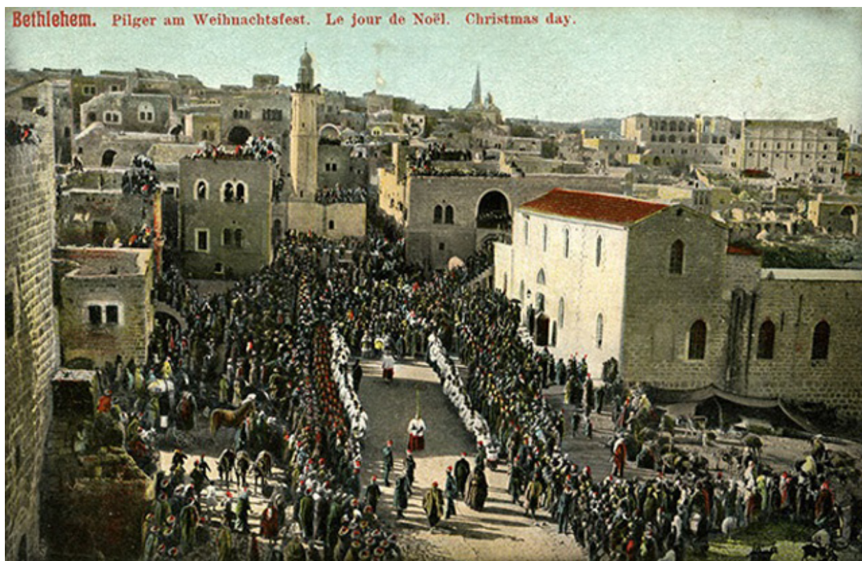
Uroczystość religijna na głównym placu Betlejem.

wieków dokonywali najczęściej, jak wspominałem, rezydenci różnych zgromadzeń w Betlejem i okolicy. Nawet obecnie w tym tak niestabilnym i niebezpiecznym kraju, podczas mego pobytu w Ziemi Świętej w samym Betlejem były cztery zakony męskie, jednaście żeńskich, nie licząc zakonów niekatolickich wyznań chrześcijańskich. Od grudnia przez styczeń, w czasach pokoju setki tysięcy, w okresach wojen i ataków terrorystycznych tysiące chrześcijan gromadzi się tu, by oddać hołd, właśnie tu “w Betlejem, nie bardzo podłym mieście” temu co “narodził się w ubóstwie, Pan wszego stworzenia”, twórcy największej religii świata i, pośrednio, naszej zachodniej cywilizacji.