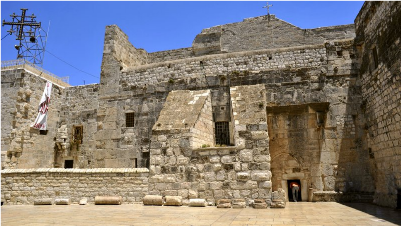
Bazylika Narodzenia Pańskiego.