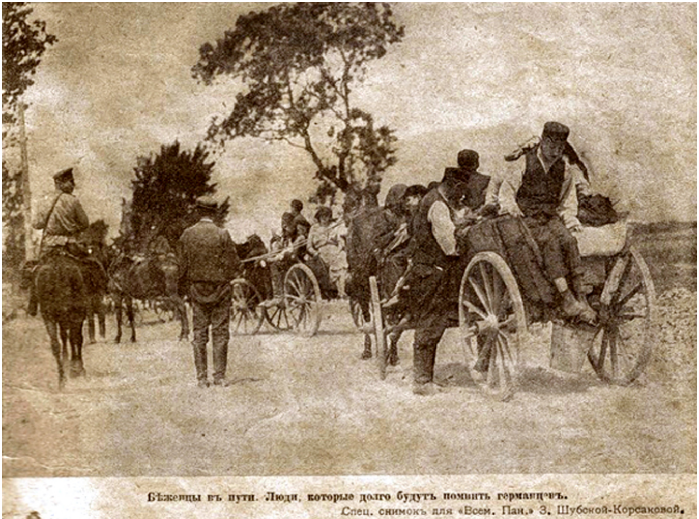
Bieżeńcy, 1915 r, fot z książki „Bieżeństwo 1915”.

ukazując, jakie straty ponieśli ludzie w sferze duchowej i psychicznej. Czytając ten fascynujący reportaż, stajemy się świadkami i niejako „uczestnikami” jej dramatycznej opowieści, budzącej zarazem refleksję nad meandrami historii. Książka otrzymała już szereg znaczących nagród, m.in. nominację do Nagrody im. Ryszarda Kapuścińskiego 2017, Nagrodę Literacką im. Wiesława Kazaneckiego oraz Nagrodę Literacką Miasta St. Warszawy.