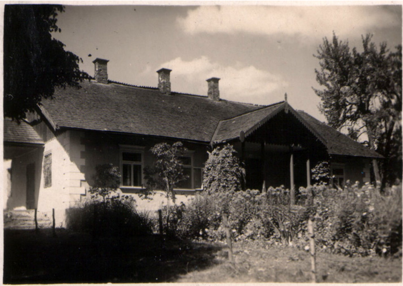
Barysz, dom Aliny i Leopoldyny Korzeniowskich, fot. arch. R. Sawickiego.