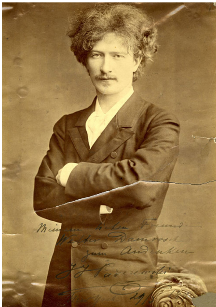
Portret Ignacego Jana Paderewskiego z dedykacją dla Waltera Damroscha