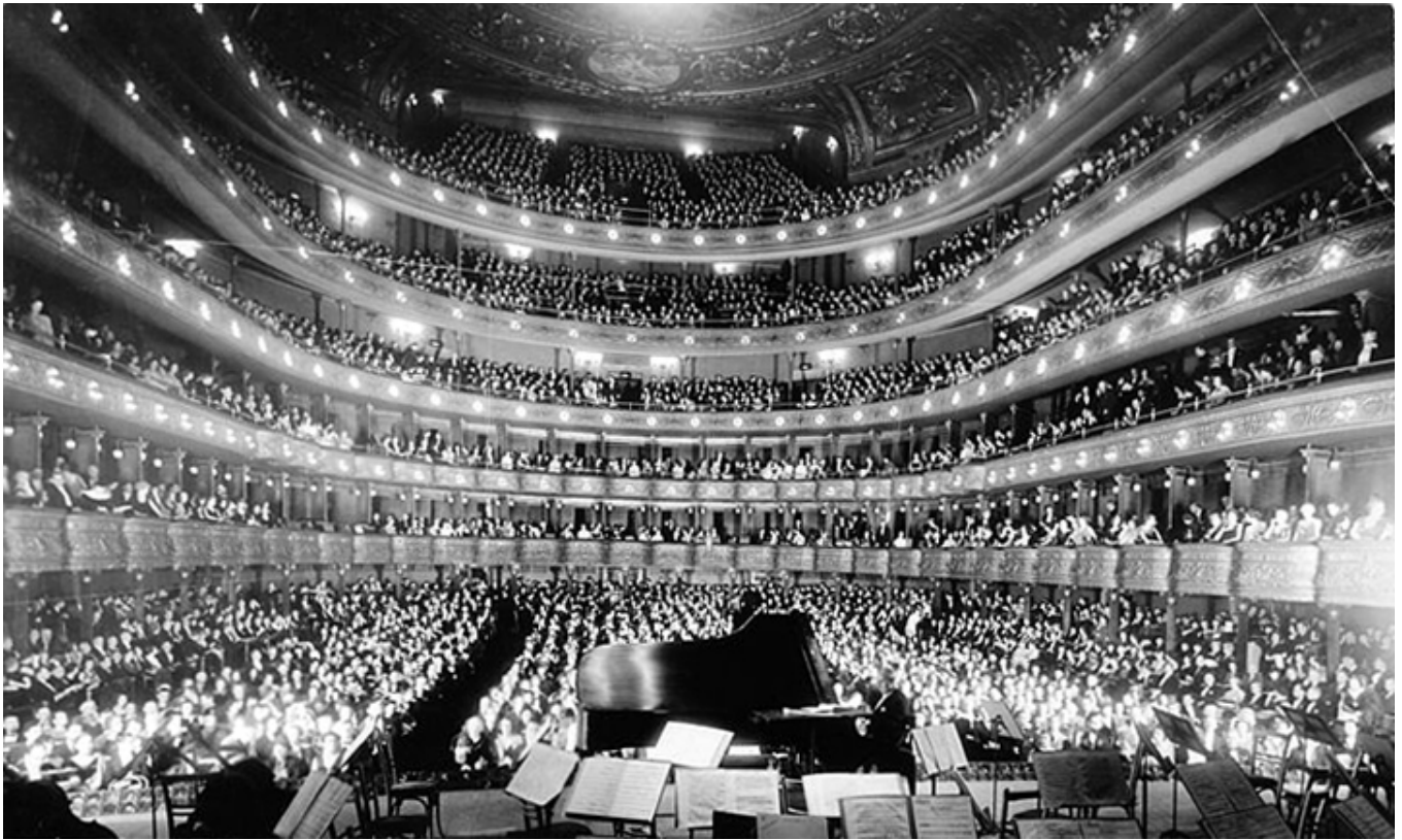
Sala w Carnegie Hall na 2800 miejsc w 1891 r.