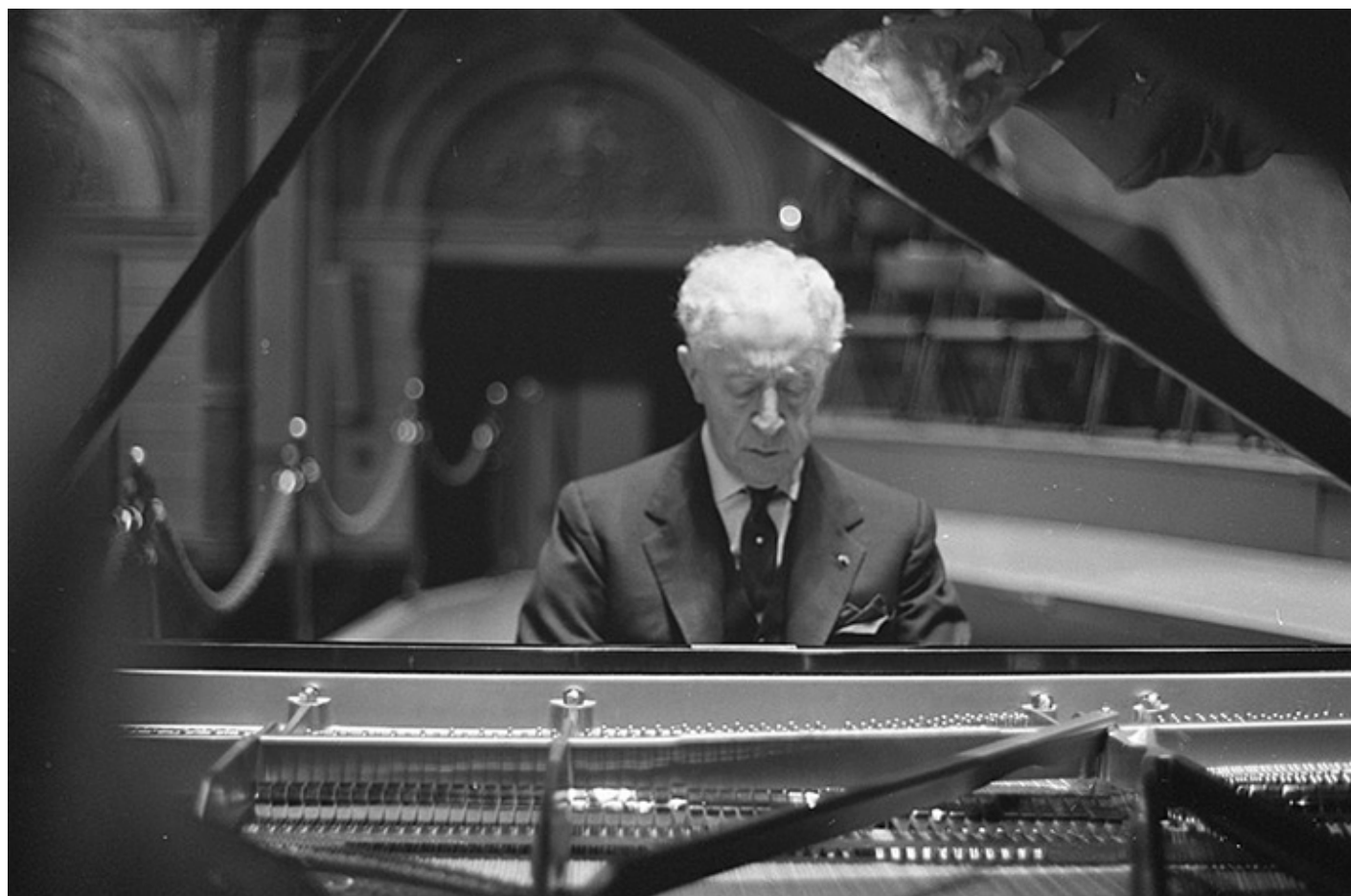
Artur Rubinstein, koncert w Amsterdamie, 13 lutego 1962 r., fot. Rossem, Wim van / Anefo, źródło: Wikimedia Commons