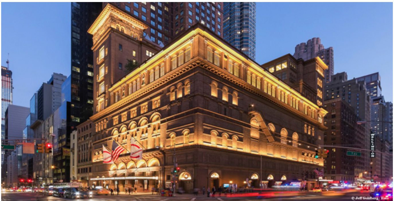
Carnegie Hall w Nowym Jorku.