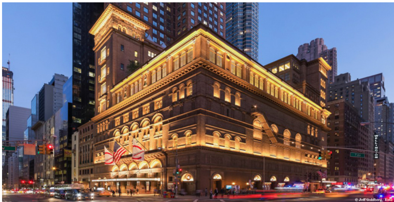
Carnegie Hall w Nowym Jorku.

Konsulowie Generalni w NY wielu krajów Europy i inni.