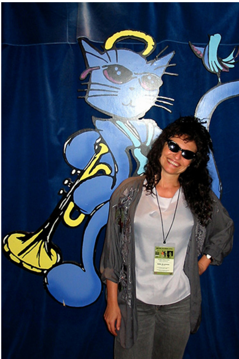
Montreal, konferencja prasowa

Mieszkaliśmy na campingu za Montrealem, na przyjęcia i bankiety przebieraliśmy się w hotelu, w którym było biuro festiwalowe. Wszędzie muzyka i wielkie gwiazdy jazzu. Np. z Wyntonem Marsalisem i jego żoną jechaliśmy windą. Cudownie było zajrzeć na jam session w nocy i posłuchać, jak grają wielcy muzycy poza salą koncerotwą. Wspaniałe wspomnienia.