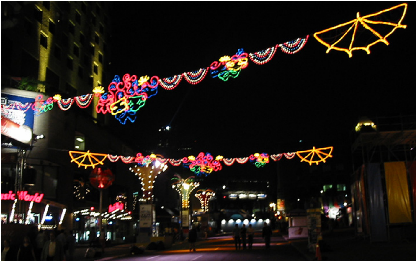
Montreal nocą, fot. Jacek Gwizdka