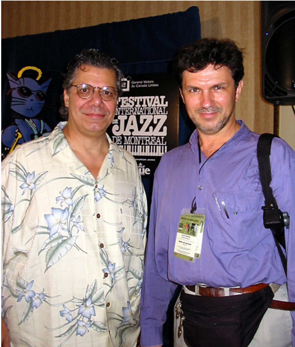
Chick Corea i Jacek Gwizdka, konferencja prasowa, Montreal, 2002 r., fot. J. Sokołowska-Gwizdka