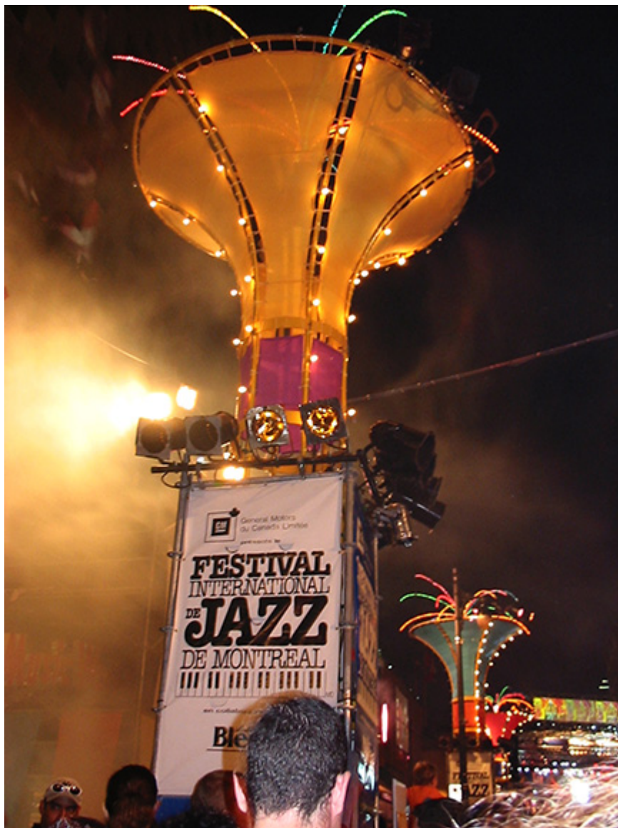
Montreal, fot. Jacek Gwizdka