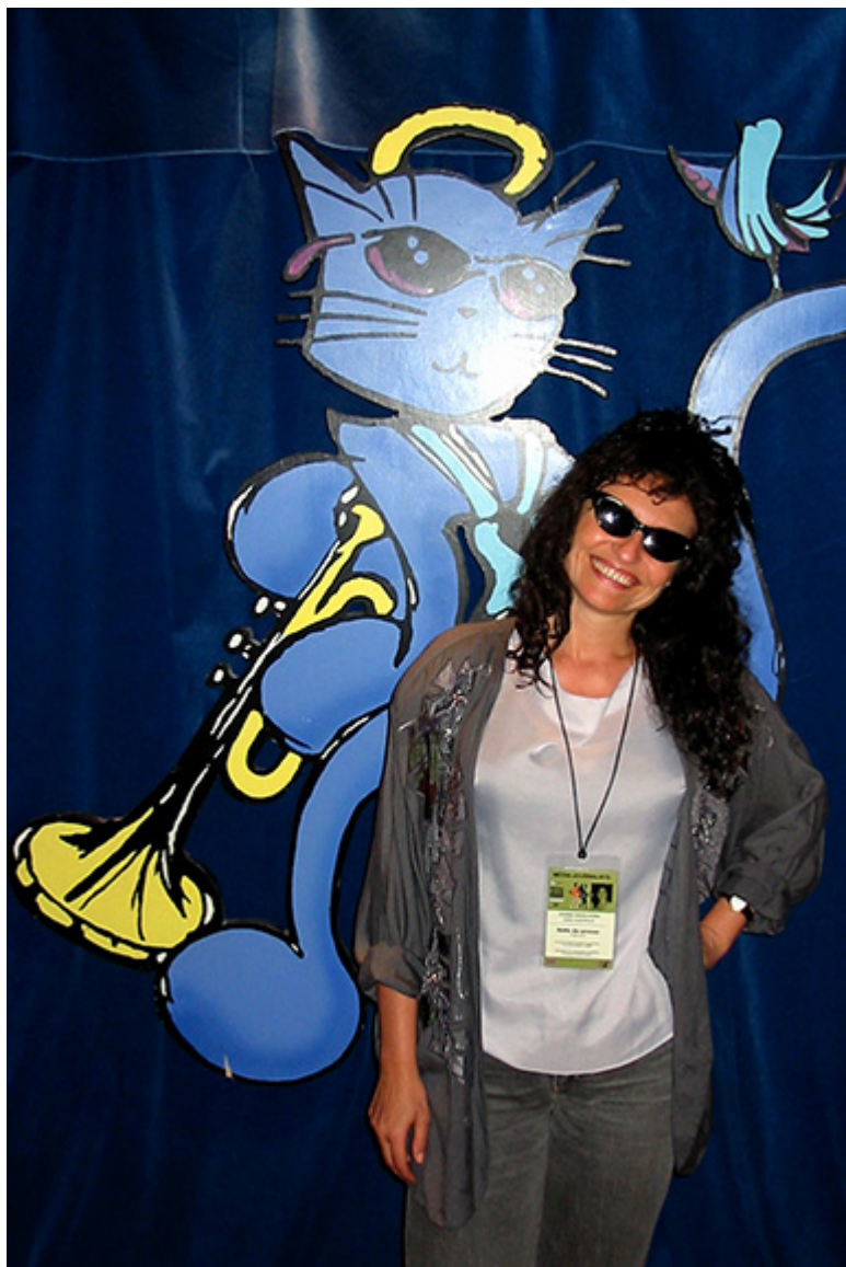
Montreal, konferencja prasowa

Mieszkaliśmy na campingu za Montrealem, na przyjęcia i bankiety przebieraliśmy się w hotelu, w którym było biuro festiwalowe. Wszędzie muzyka i wielkie gwiazdy jazzu. Np. z Wyntonem Marsalisem i jego żoną jechaliśmy windą. Cudownie było zajrzeć na jam session w nocy i posłuchać, jak grają wielcy muzycy poza salą koncertową. Wspaniałe wspomnienia.