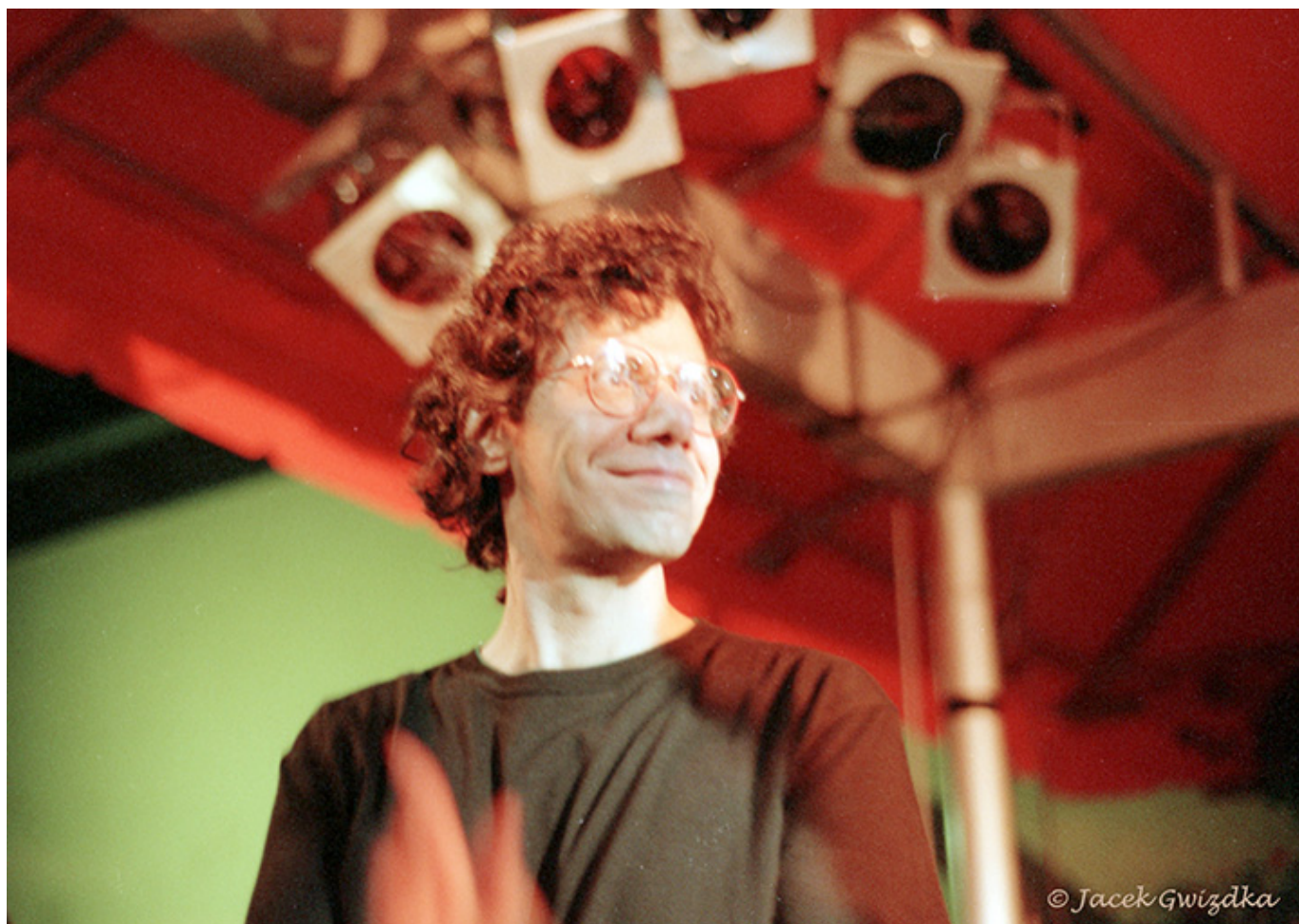
Montreal w rytmie jazzu, 2002 i 2004 r.