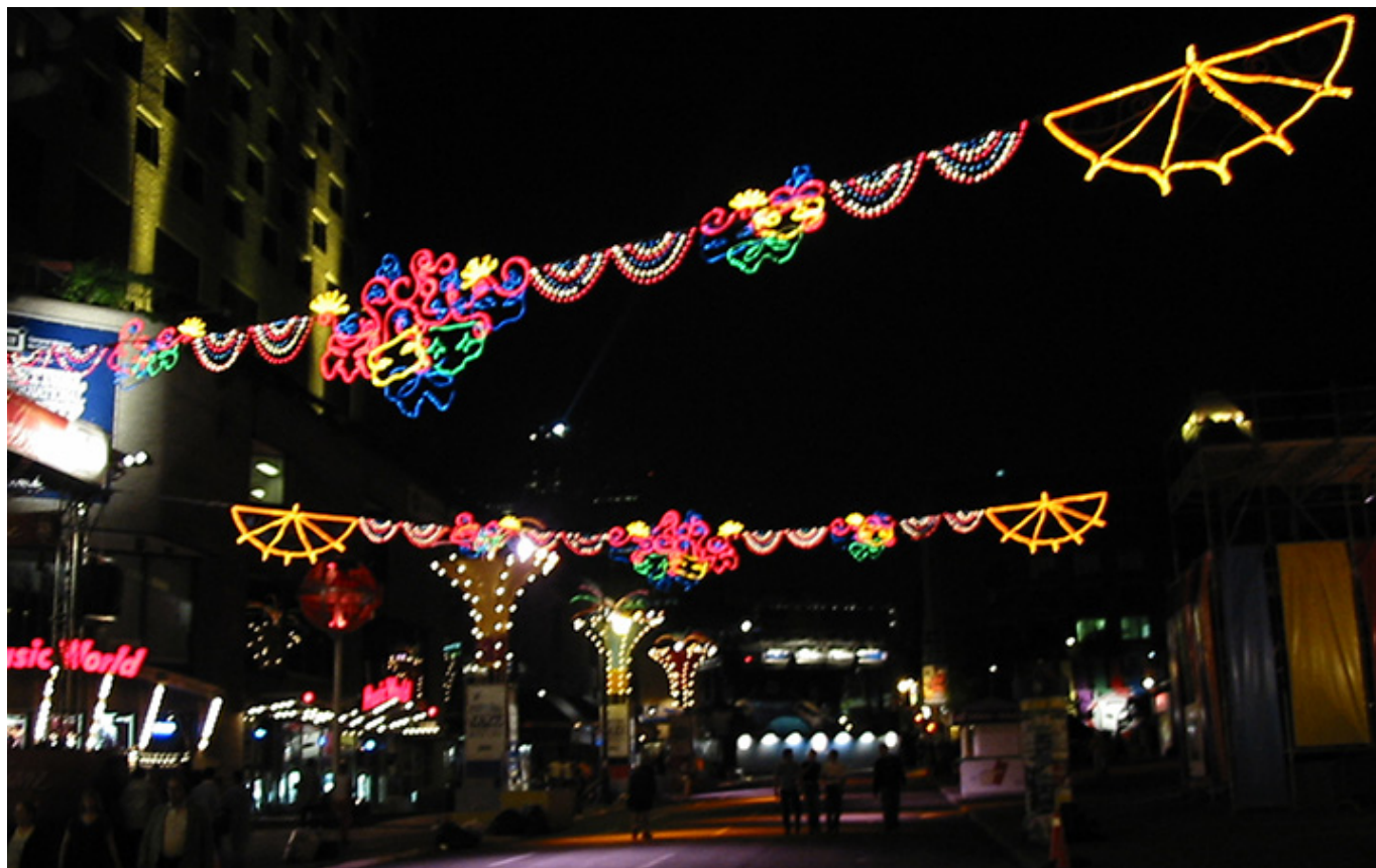
Montreal nocą