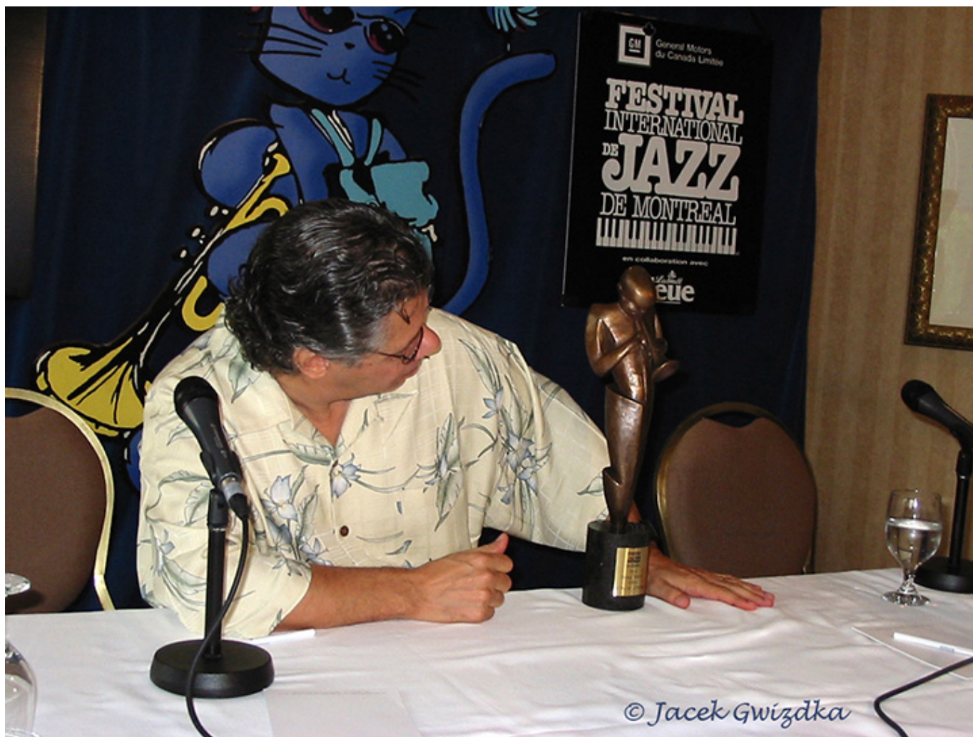
Chick Corea przygląda się statuetce Milesa Davisa