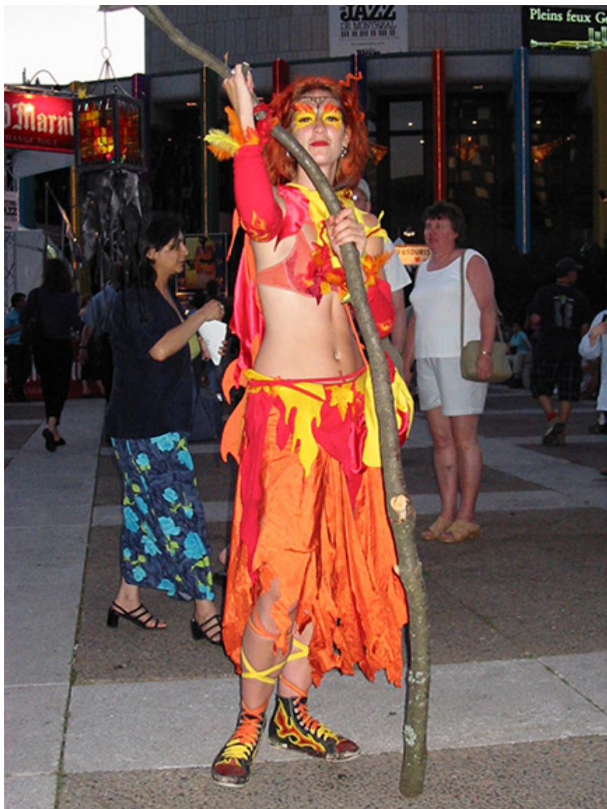
Montreal, fot. Jacek Gwizdka