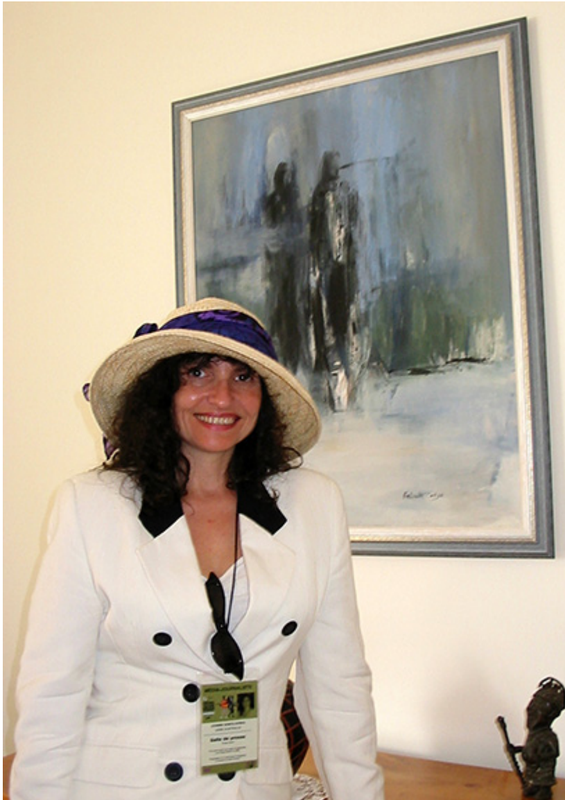
Montreal, na przyjęciu w ambasadzie Szwajcarii