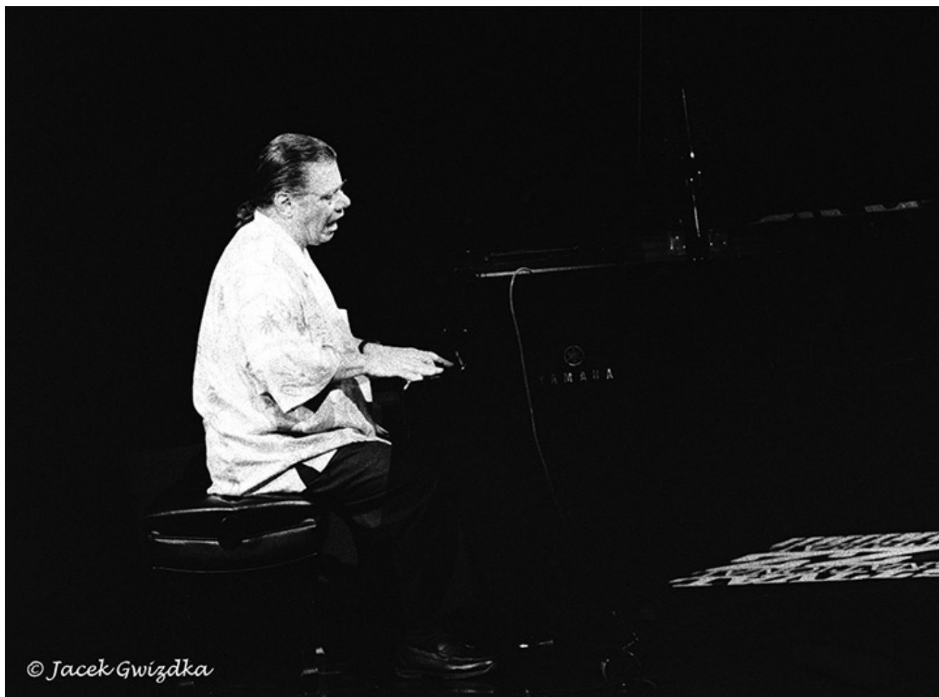
Frankfurt nad Menem 1989 r.