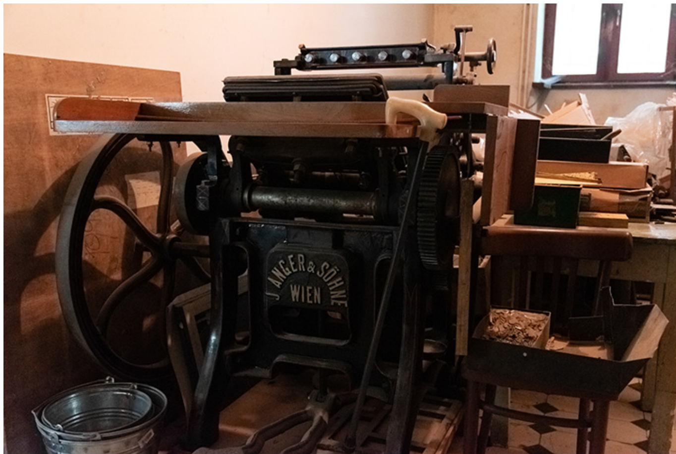
Muzeum Książki Artystycznej w Łodzi

komunistycznego reżimu. Muzeum nosi się z zamiarem zbierania z tego okresu jak najwięcej przykładów polskiej sztuki książki, która istniała wbrew wszystkim warunkom potrzebnym jej do życia i rozwoju (cenzura, odcięcie od historii, brak zasobów przedwojennych, zakazy posiadania sprzętu, socrealistyczna polityka kulturalna, bieda społeczeństwa itd.).