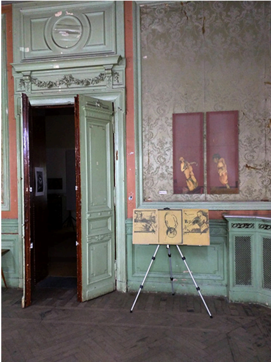
Fot. Jacek Gwizdka, 2017 r.