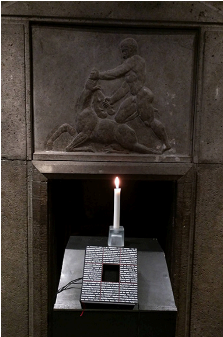
Książka z rysunkami Zbigniewa Brzezińskiego, fot. Jacek Gwizdka, 2017 r.