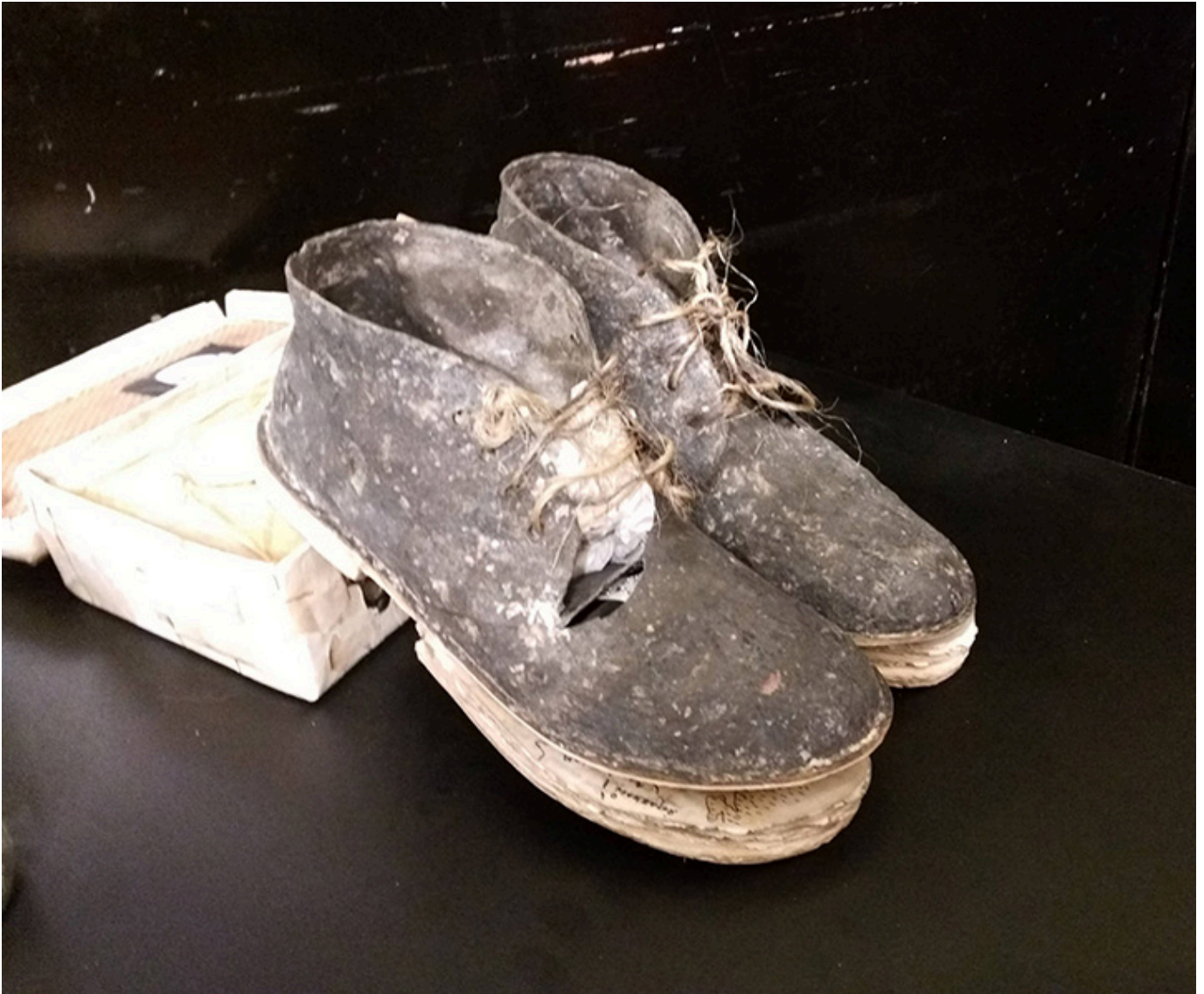
Fot. Jacek Gwizdka, 2017 r.