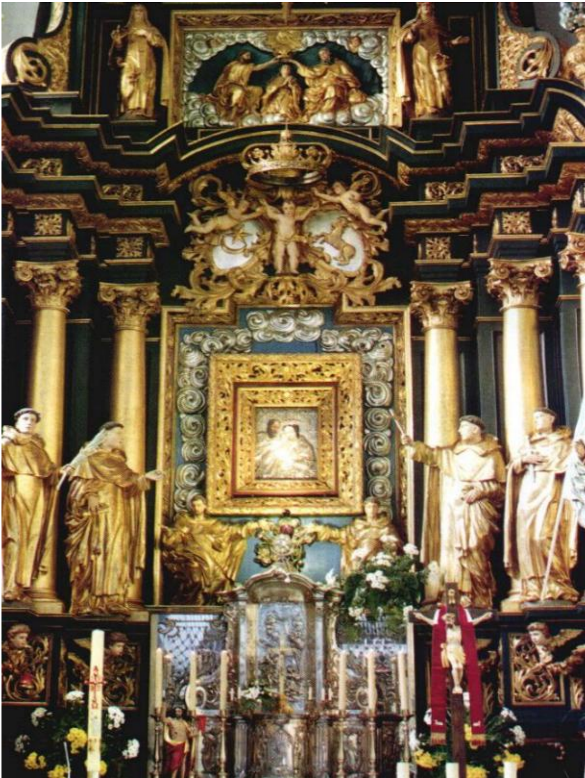
Obraz Matki Boskiej Dzikowskiej w kościele oo Dominikanów ufundowanym w XVII w.przez Tarnowskich w Tarnobrzegu.