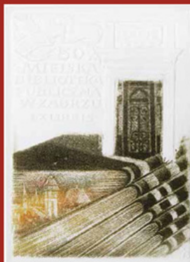
Miejska Biblioteka Publiczna w Zabrzu Öffentliche städtische Bibliothek in Zabrze 1995 | intaglio

Album Kazimierza Szotyśka z okazji 40-lecia pracy artystycznej