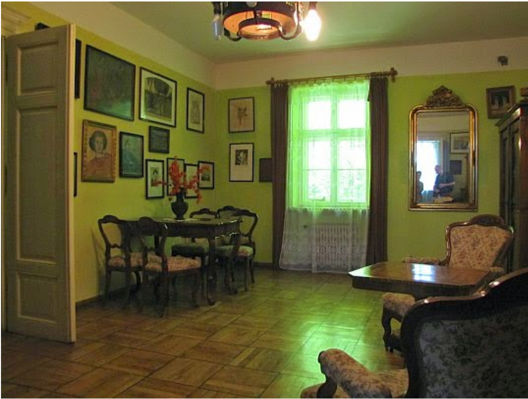
Muzeum Emila Zegadłowicza. Herbaciarnia.

kustoszu opiekującym się szczególnie pieczołowicie cenną spuścizną po wielkim dziadku, twórcy i kolekcjonerze.