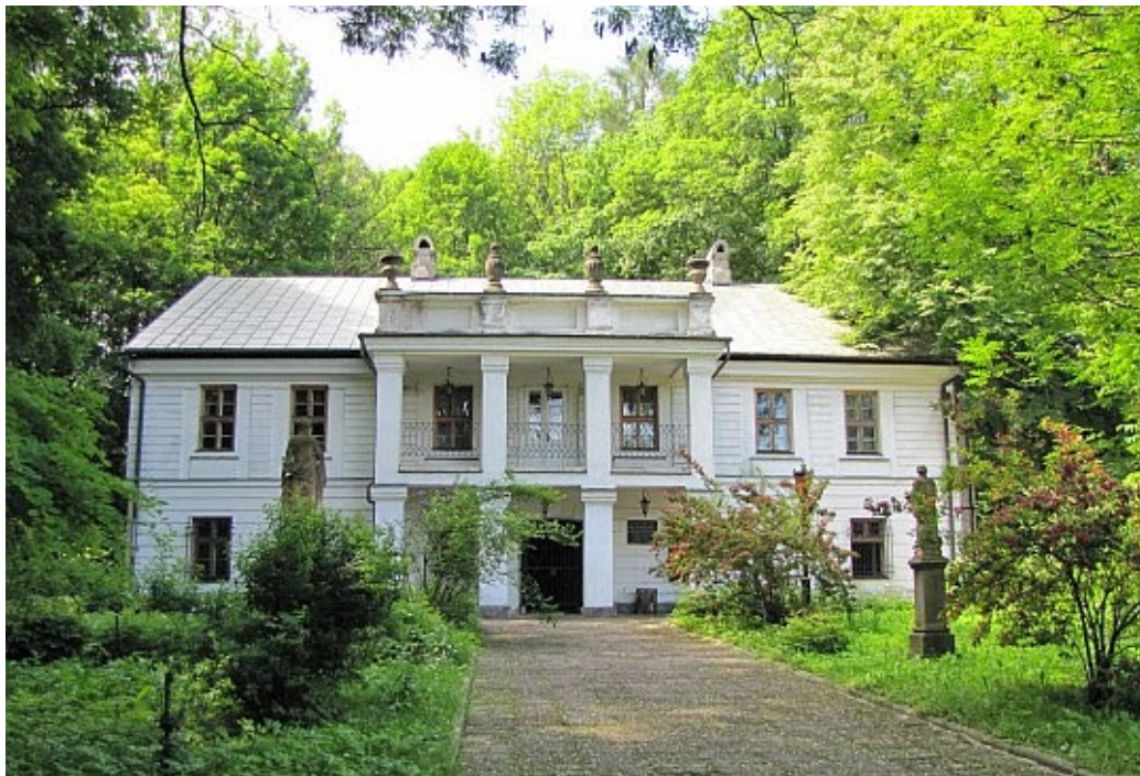
Dworek - Muzeum Emila Zegadłowicza w Gorzeniu Górnym.