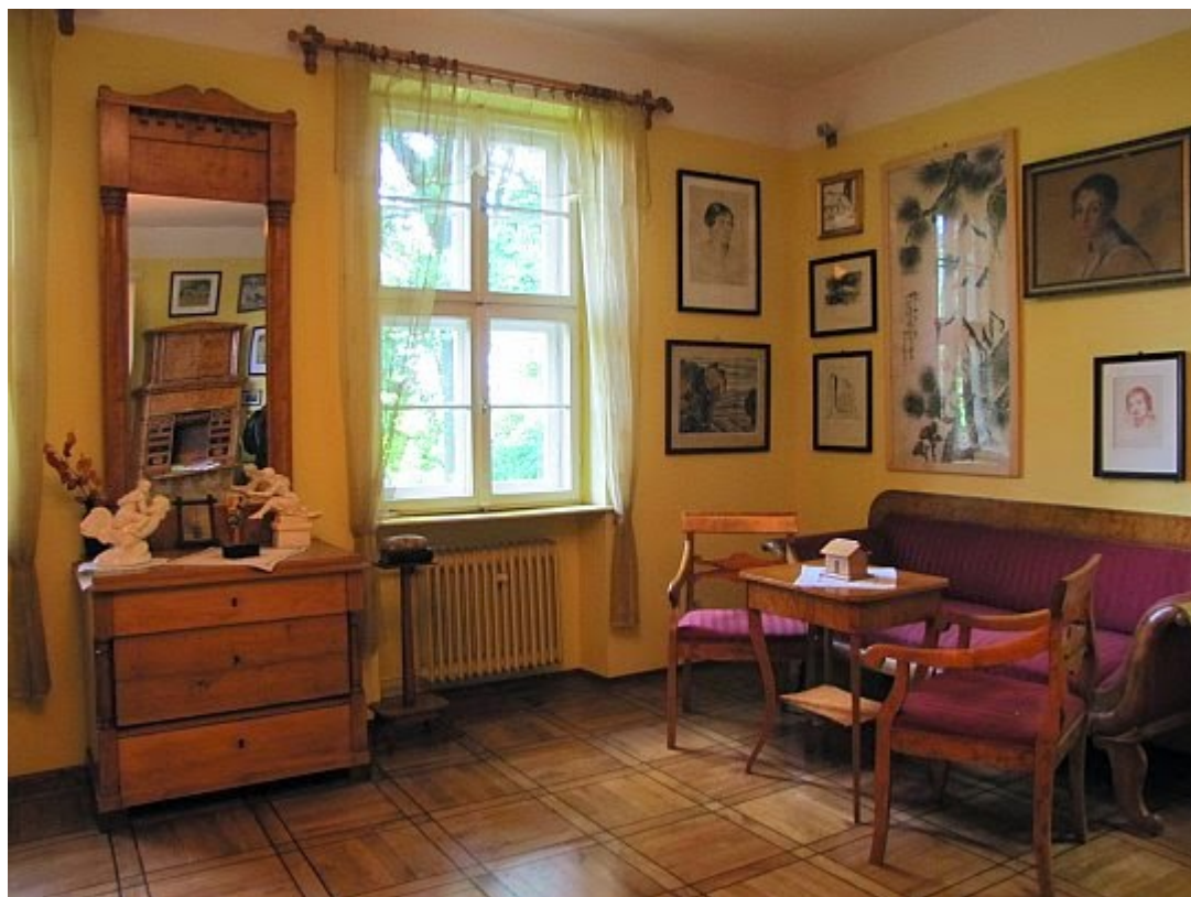
Muzeum Emila Zegadłowicza. Gabinet,