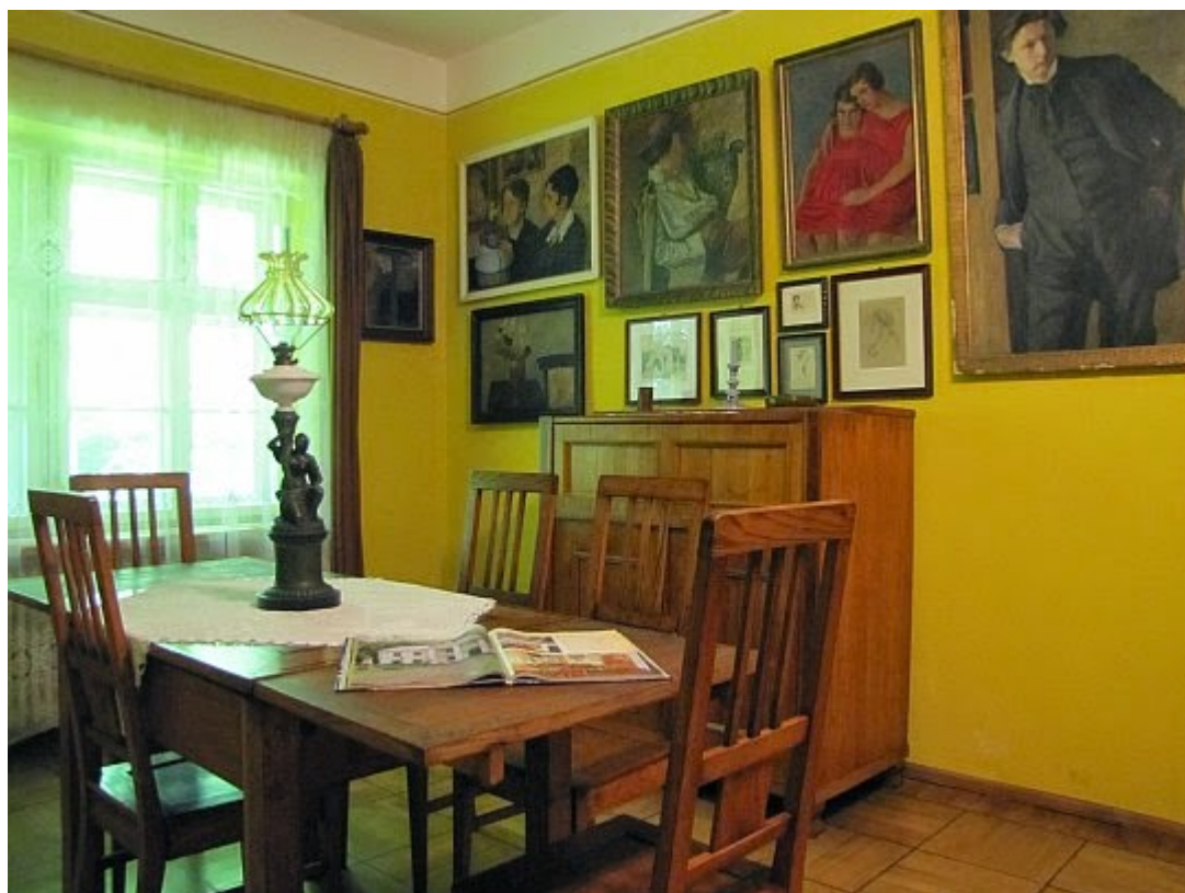
Muzeum Emila Zegadłowicza. Jadalnia.