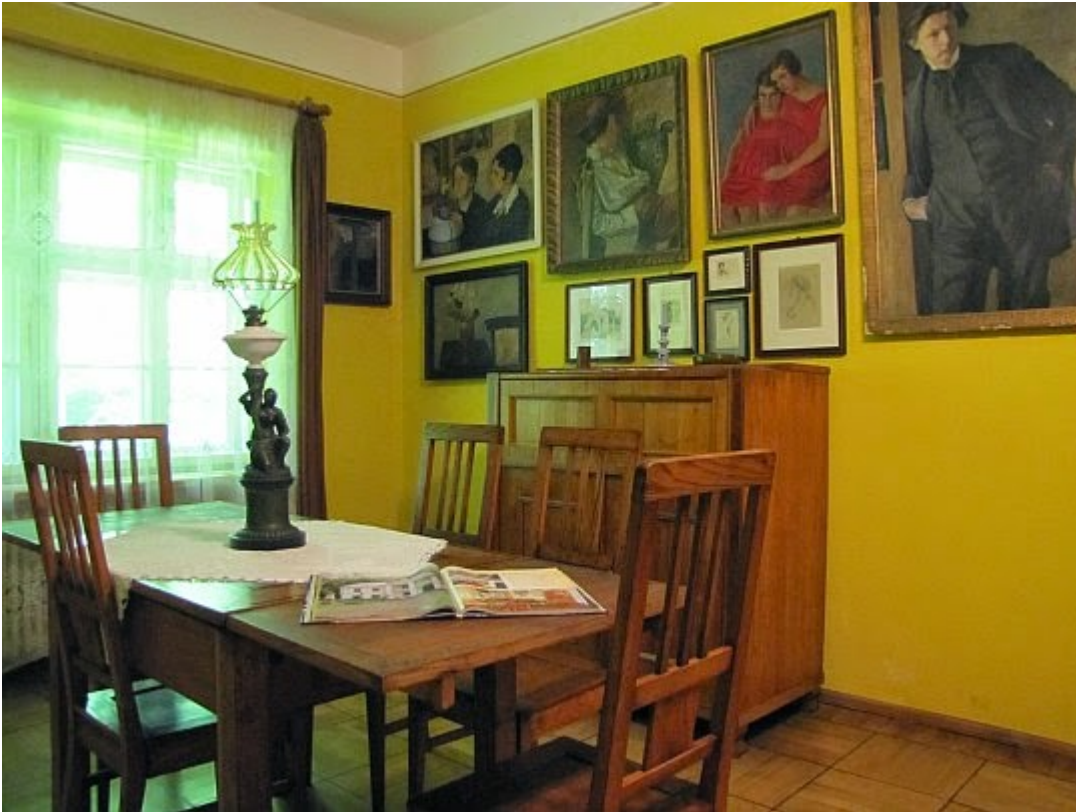
Muzeum Emila Zegadłowicza. Jadalnia.