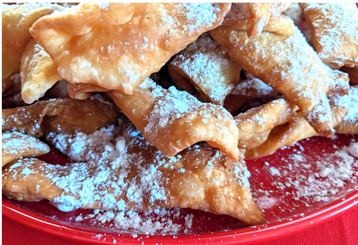
Faworki według przepisu Neli Rubinstein, wykonanie Joanna Sokołowska-Gwizdka