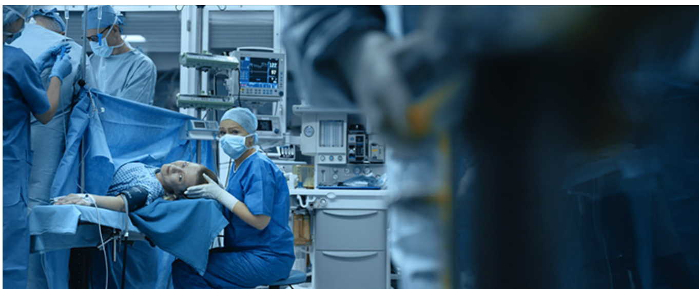
Kadr z filmu „Po pierwsze... nie szkodzić”

Film dostępny na platformie festiwalowej: 21-31 listopada.