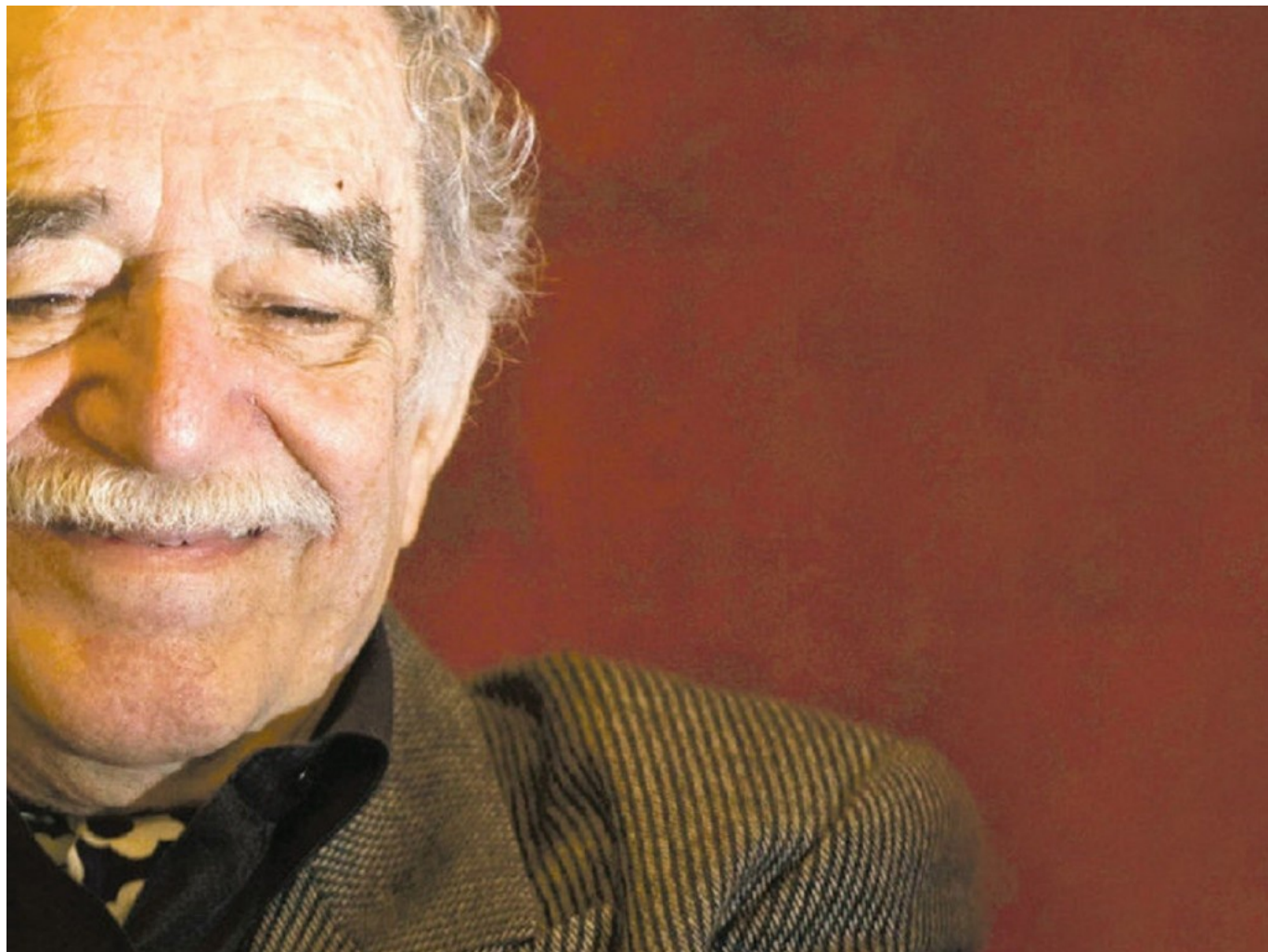
Gabriel García Márquez.