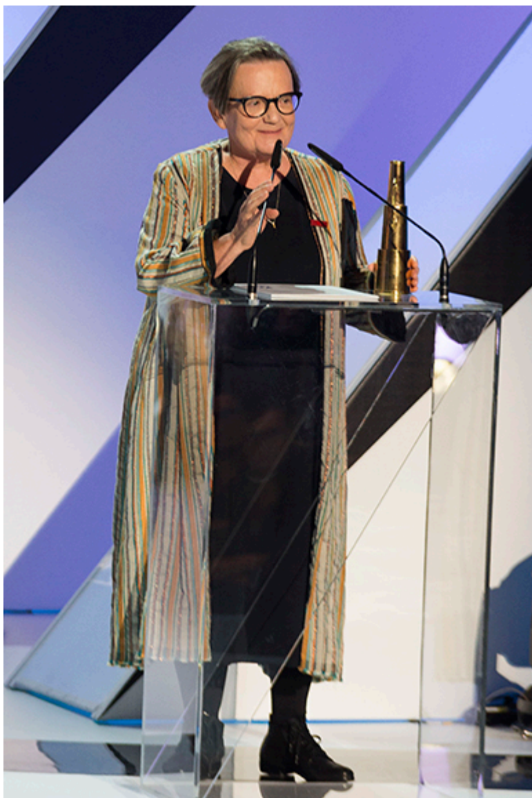
44. Festiwal Polskich Filmów Fabularnych w Gdyni. Gala finałowa w Teatrze Muzycznym. Nz. Laureatka kategorii Złote Lwy - Agnieszka Holland, reż. filmu pt. „Obywatel Jones”. 21.09.2019