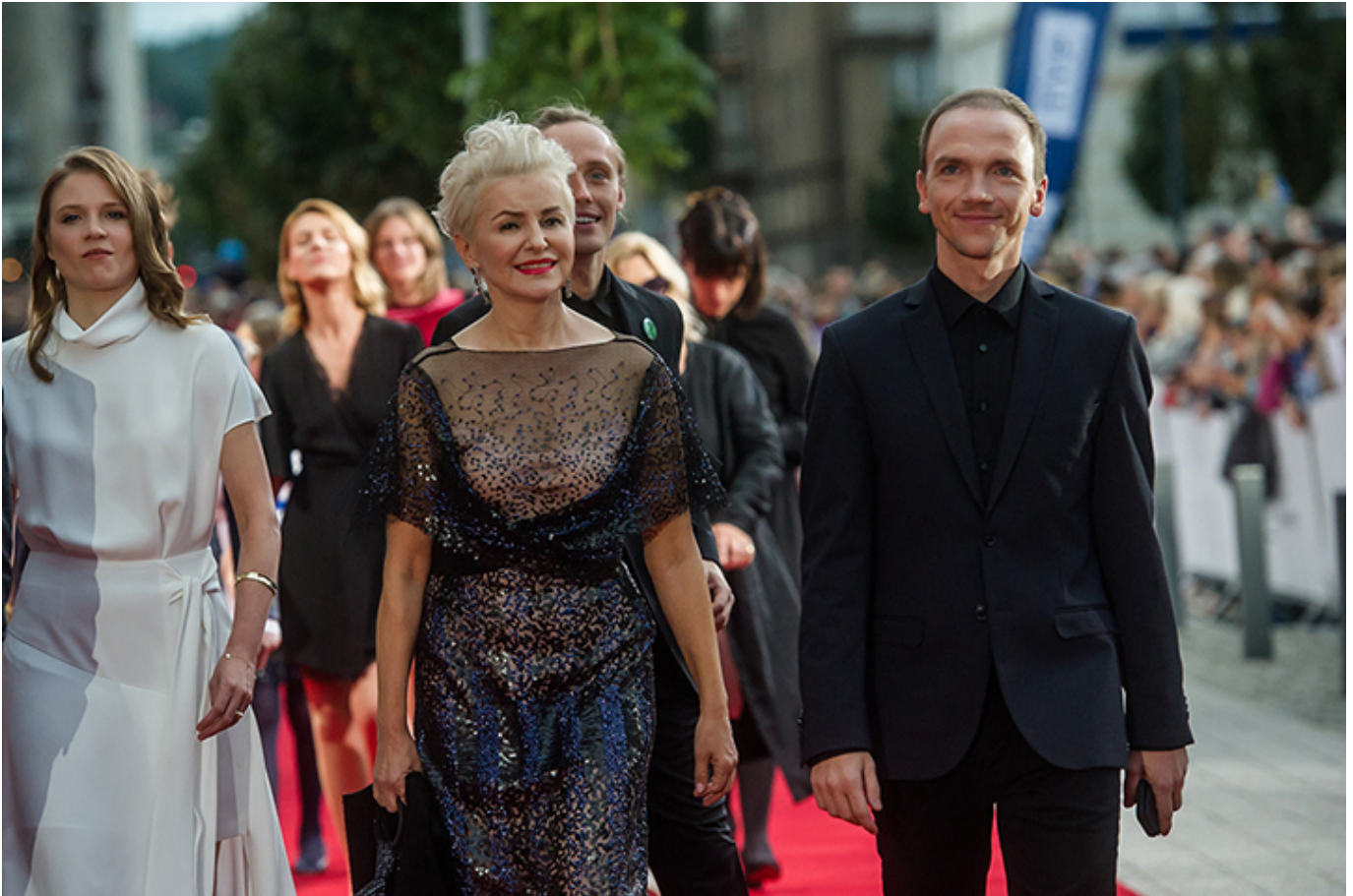
Gdynia. Teatr Muzyczny. 44. Festiwal Polskich Filmów Fabularnych w Gdyni. Gala zamknięcia. Nz twórcy filmu pt. „Boże ciało”. Aktorka Aleksandra Konieczna oraz Jan Komasa. 20.09.2019