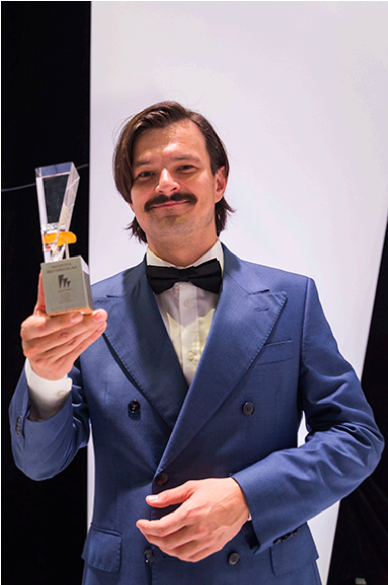
44. Festiwal Polskich Filmów Fabularnych w Gdyni. Gala finałowa w Teatrze Muzycznym. Nz. Dawid Ogrodnik ze statuetką za główną rolę męską w filmie „Ikar. Legenda Mietka Kosza” 21.09.2019