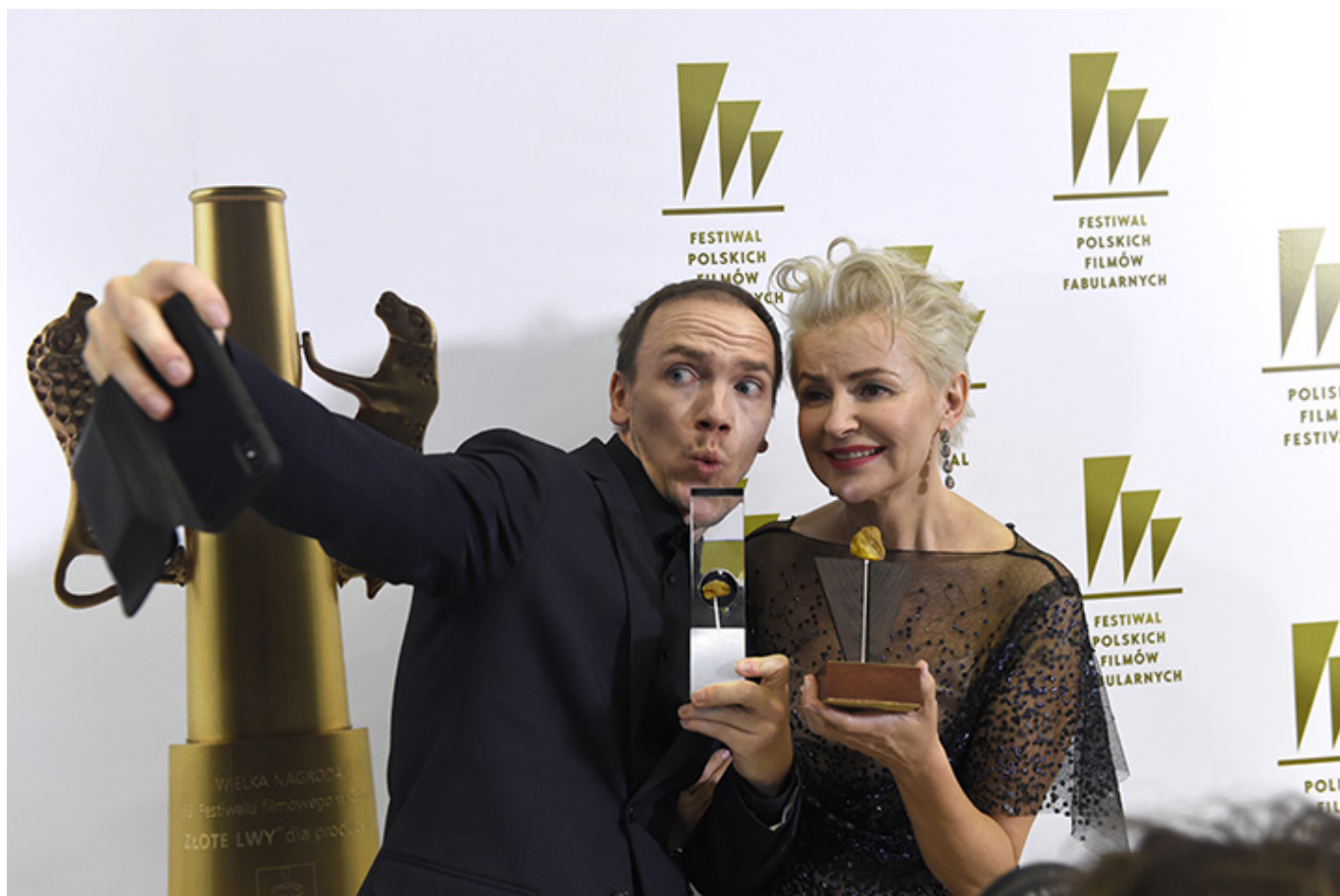
44. Festiwal Polskich Filmów Fabularnych w Gdyni. Gala zamknięcia. Jan Komasa z nagrodą za reżyserię za film „Boże Ciało” oraz Aleksandra Konieczna. 20.09.2019