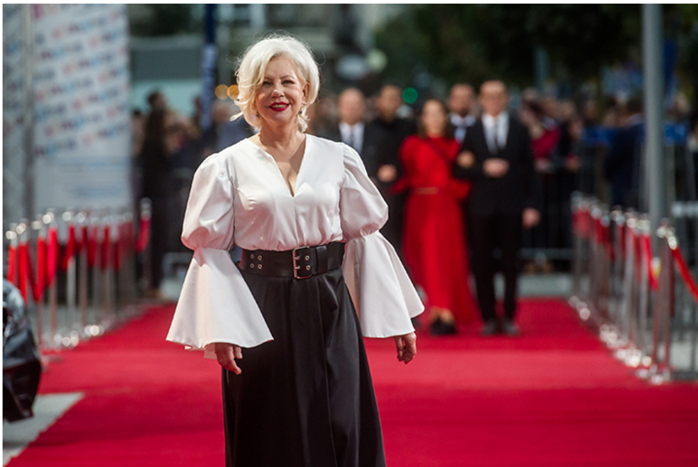
Gdynia. Teatr Muzyczny. 44. Festiwal Polskich Filmów Fabularnych w Gdyni. Gala zamknięcia. Nz Małgorzata Zajączkowska. 20.09.2019