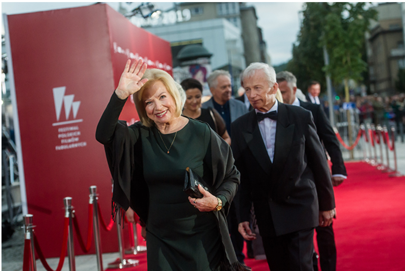
Gdynia. Teatr Muzyczny. 44. Festiwal Polskich Filmów Fabularnych w Gdyni. Gala zamknięcia. Nz Jury konkursu głównego. Bożena Dykiel. 20.09.2019