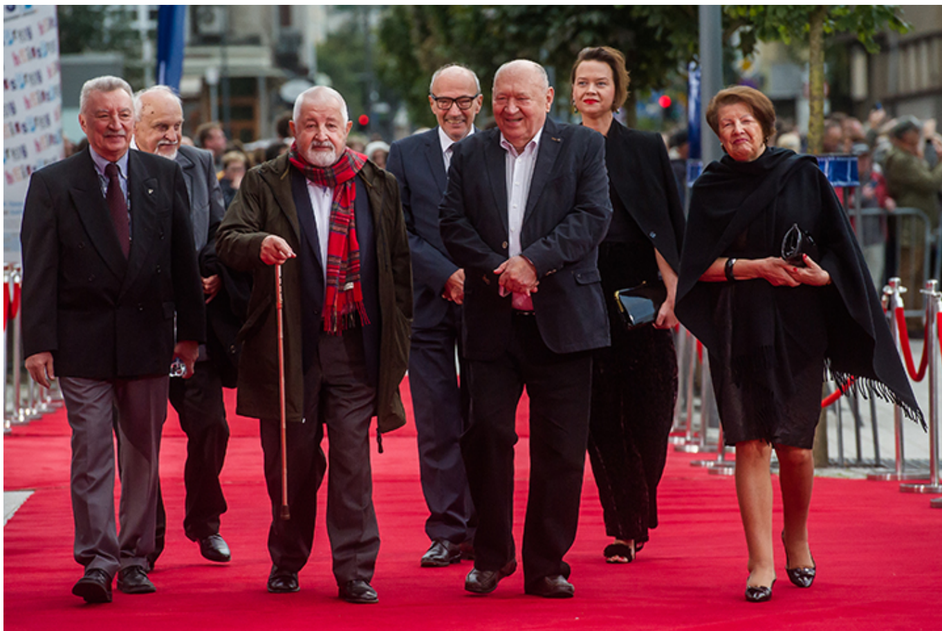
Gdynia. Teatr Muzyczny. 44. Festiwal Polskich Filmów Fabularnych w Gdyni. Gala zamknięcia. N. twórcy filmu pt. „Czarny mercedes” wśród nich reżyser Janusz Majewski. 20.09.2019