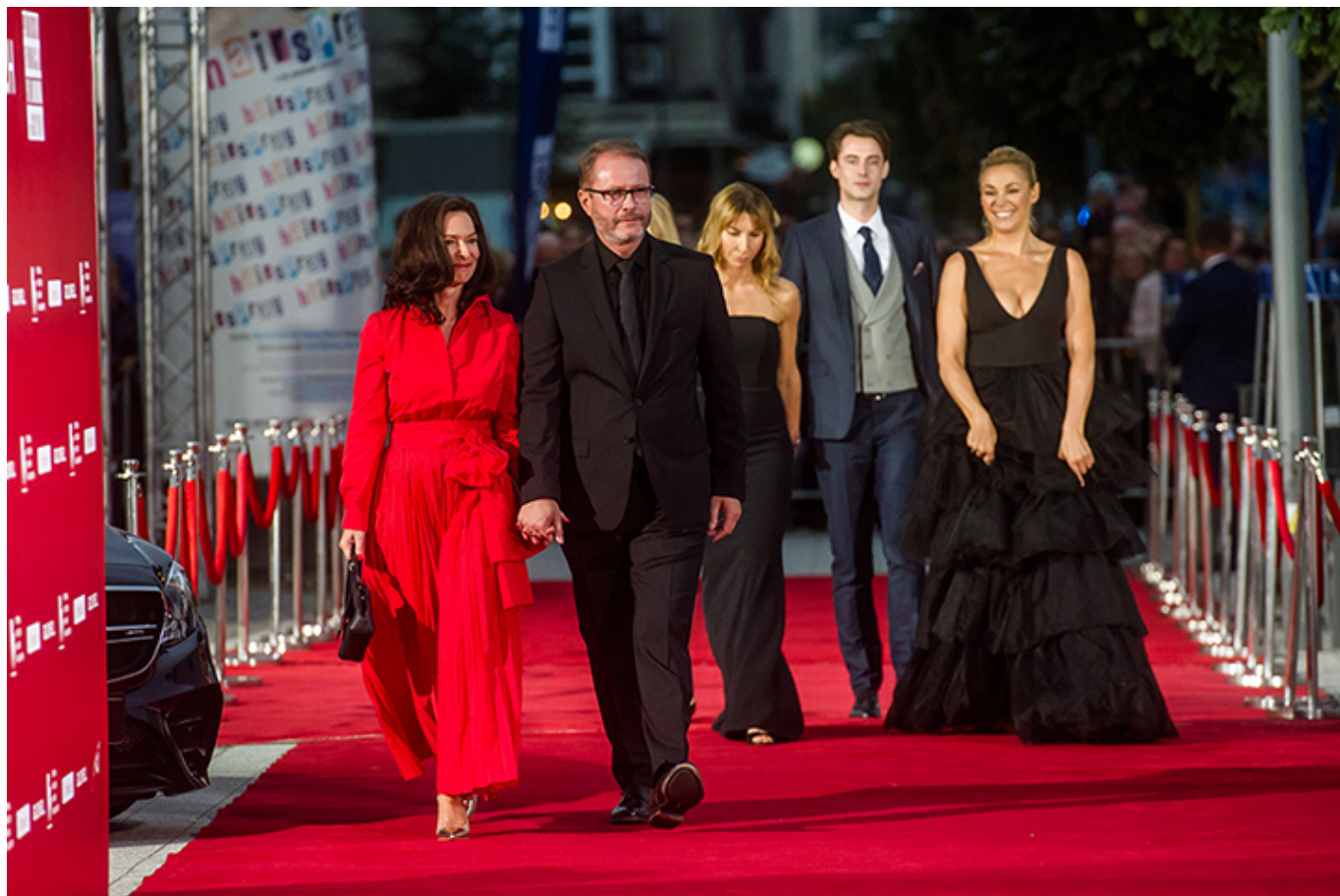
Gdynia. Teatr Muzyczny. 44. Festiwal Polskich Filmów Fabularnych w Gdyni. Gala zamknięcia. Nz twórcy filmu pt. „Czarny Mercedes”, m.in. Artur Żmijewski, Sonia Bohosiewicz. 20.09.2019