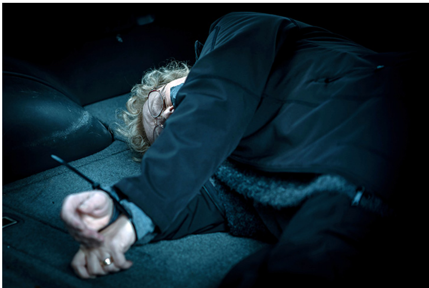
„Lokatorka”, reż. Michał Ołowski