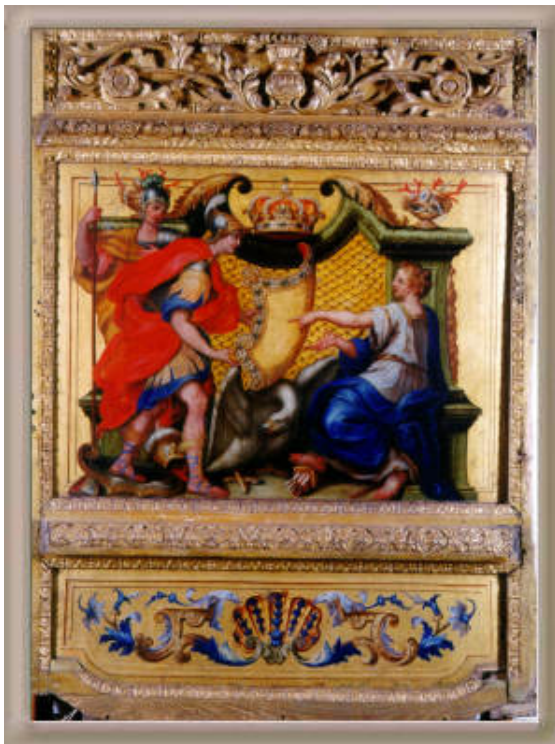
Fragment malowidła na drzwiach karety paradnej.

Muzeum Narodowe w Warszawie, do którego należał wówczas Wilanów, wysłało ambonę w depozyt do Muzeum Pomorza Środkowego w Słupsku, gdzie była eksponowana od 1966 do 1983 r. Fragmenty zespołu ambony nadal pozostawały w Wilanowie.