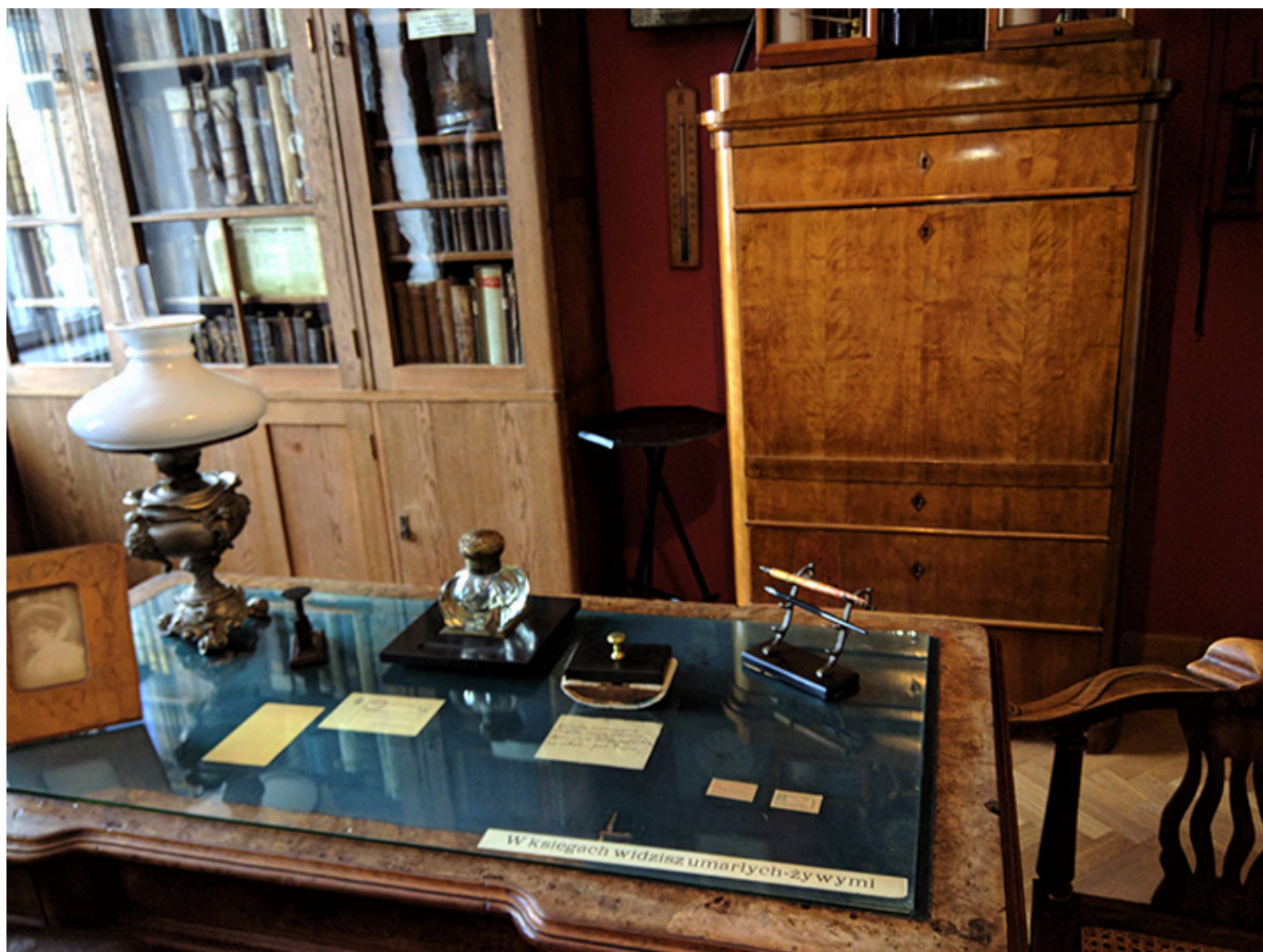
Gabinet Feliksa Przytkowskiego