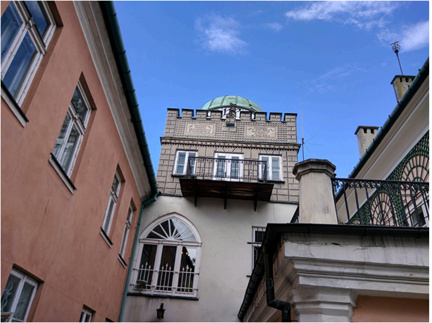
Obserwatorium astronomiczne Feliksa Przyrkowskiego