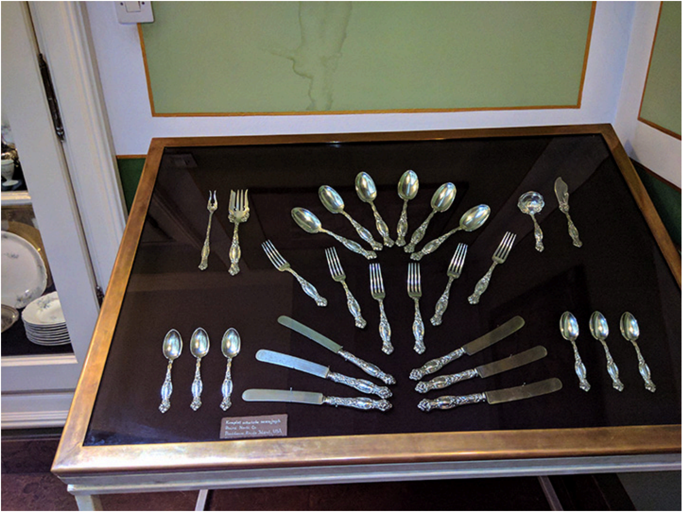
Complete silverware set B. & B. Co. Providence, Rhode Island, 1850s