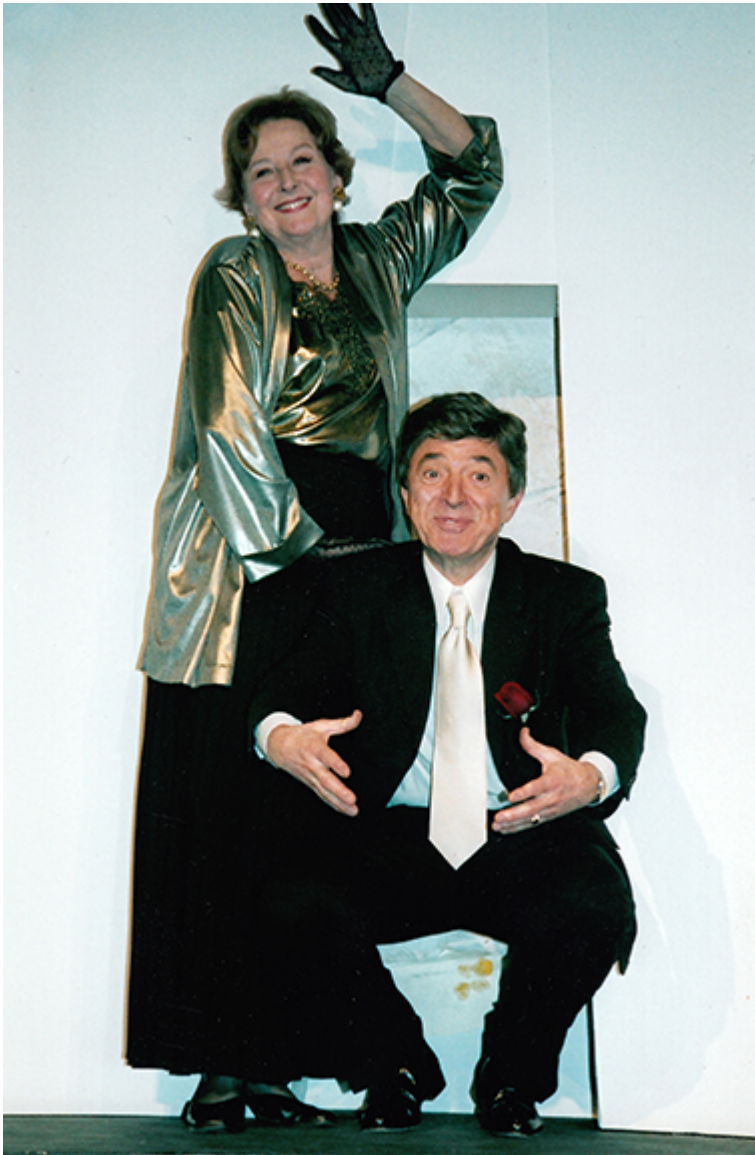
Maria Nowotarska i Jerzy Połomski, spektakl „Dopóki śpiewam ja”