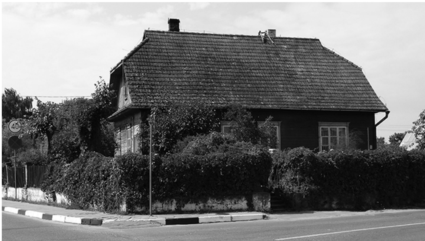
Brasław, dom Żurawskich, fot. Michał Żurawski, 2015 r.