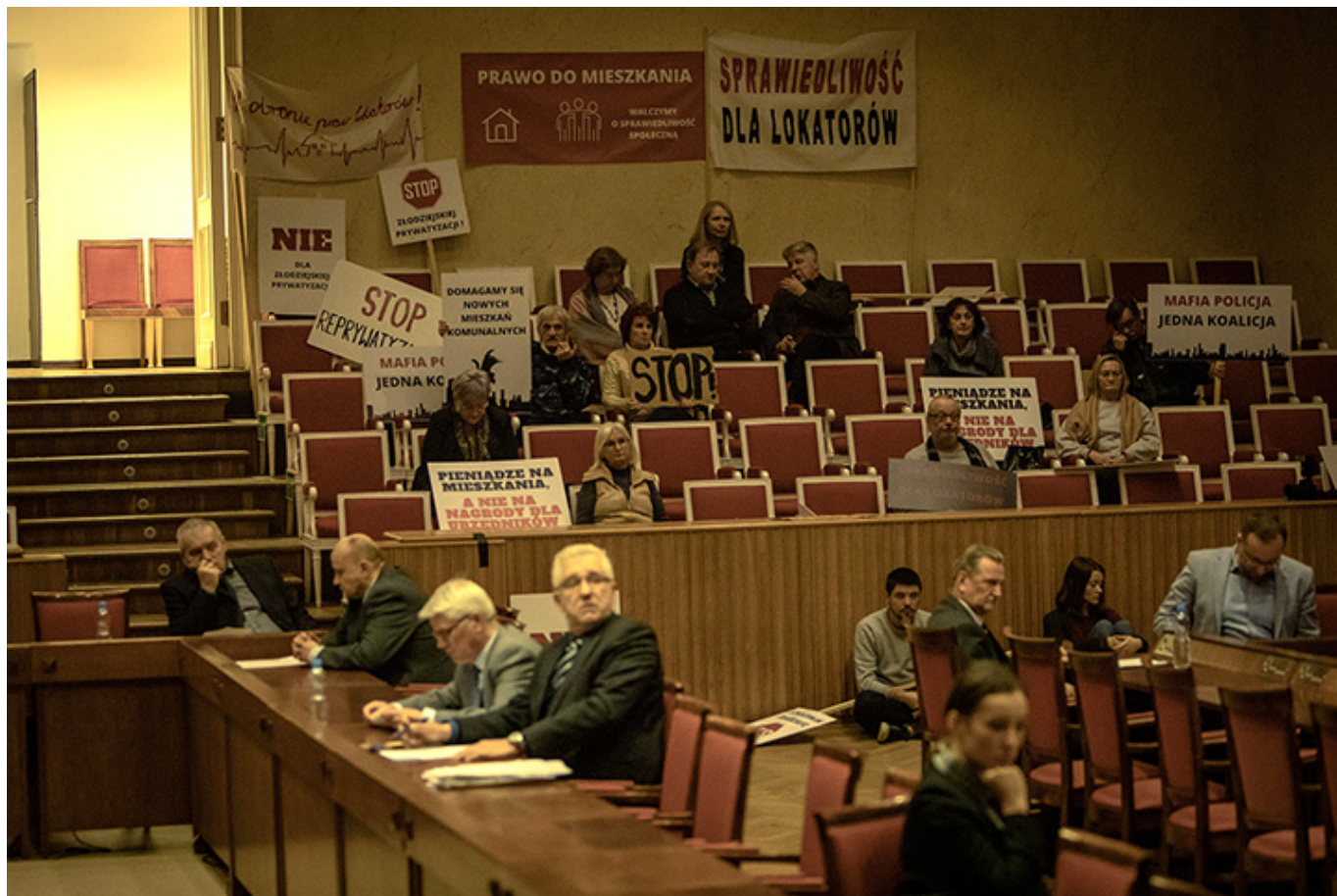
„Lokatorka”, reż. Michał Otlowski