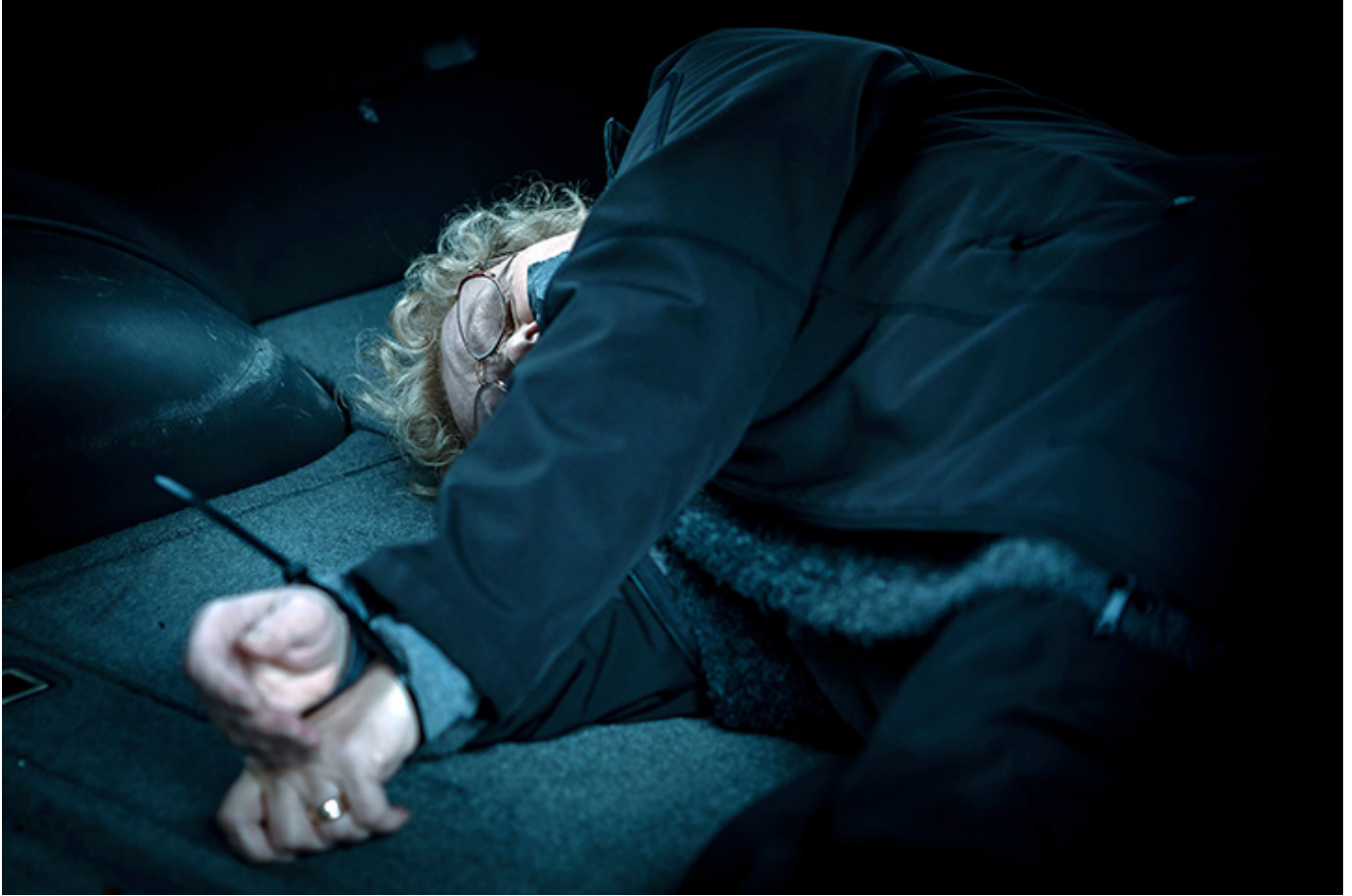
„Lokatorka”, reż. Michał Otłowski