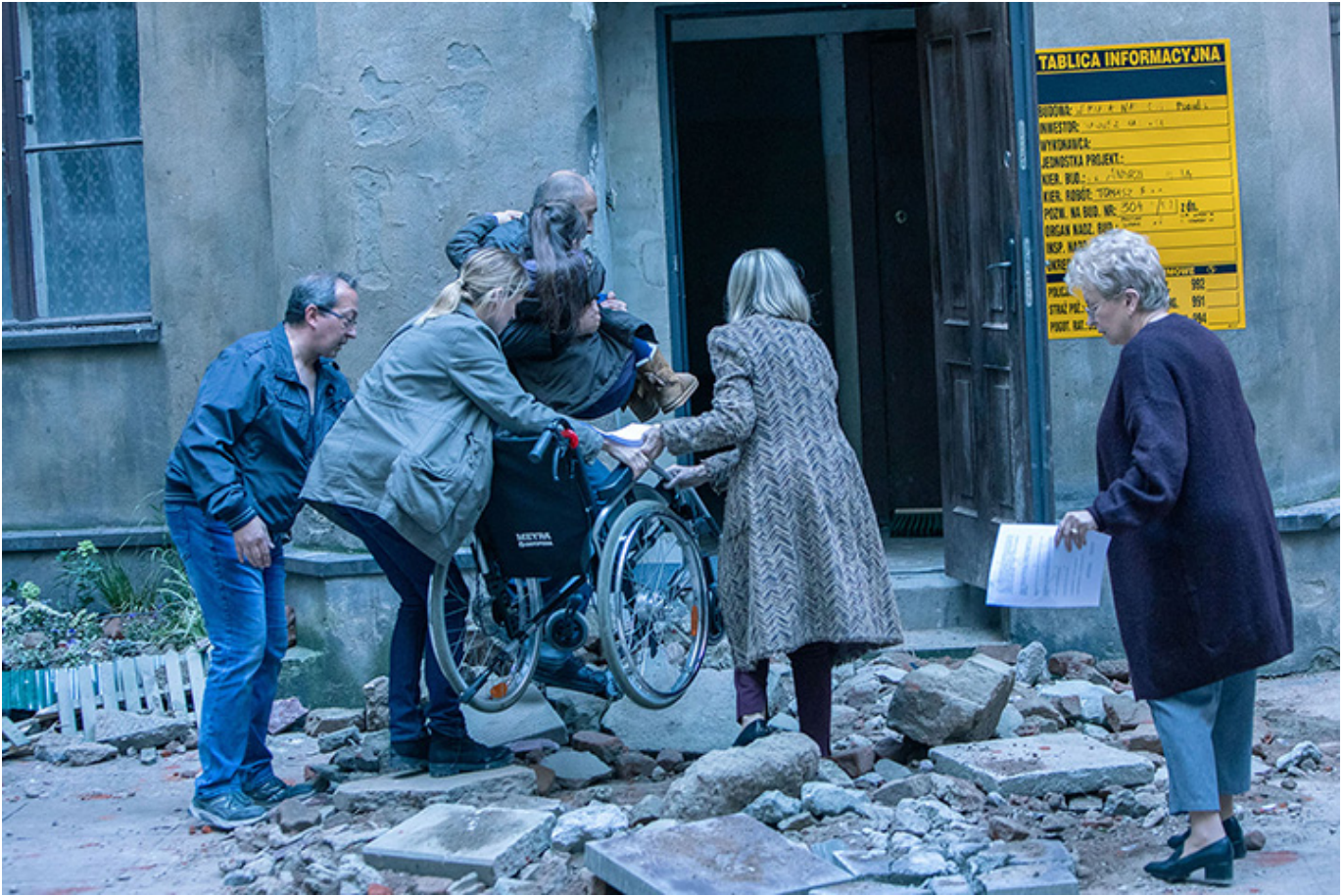
„Lokatorka”, reż. Michał Orlowski