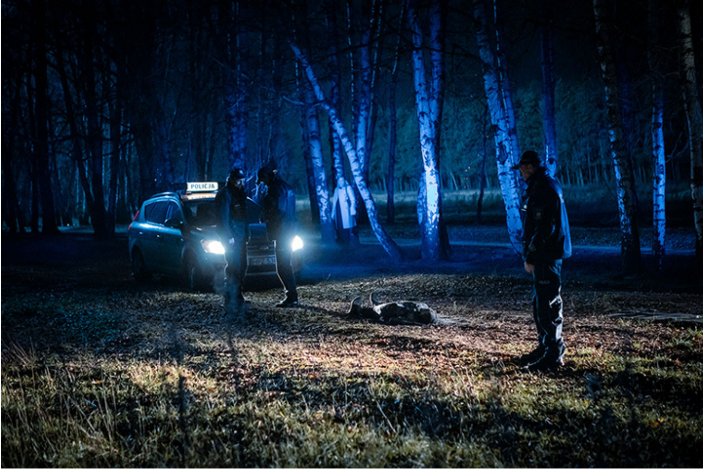
„Lokatorka”, reż. Michał Oślowski