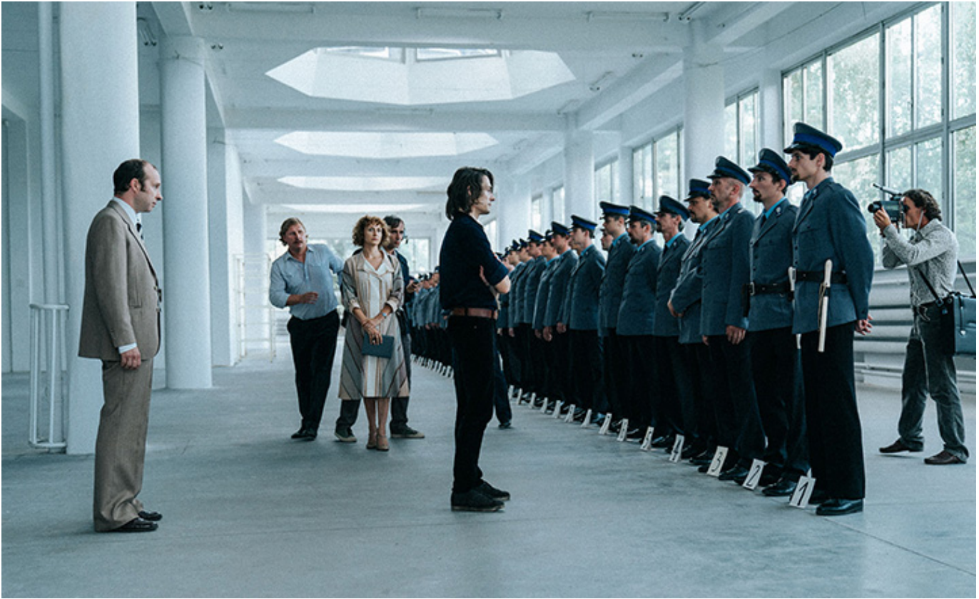
„Żeby nie było śladów”, reż. Jan P. Matuszyński