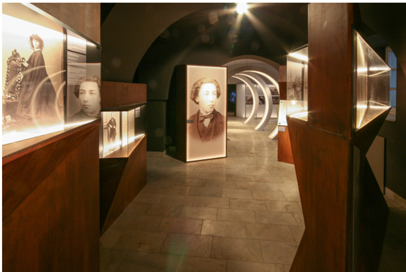
Muzeum Josepha Conrada w Berdyczowie, w odbudowanym budynku klasztoru Karmelitów Bosych, fot. Adam Orlewicz.