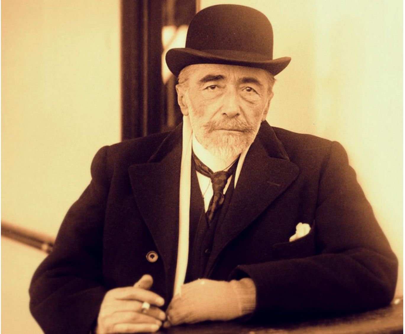
Józef Korzeniowski (Joseph Conrad)