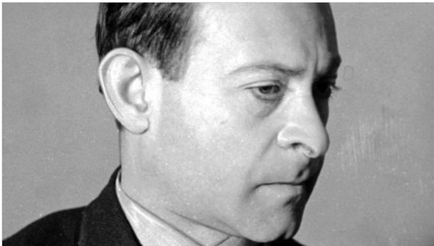
Józef Wittlin