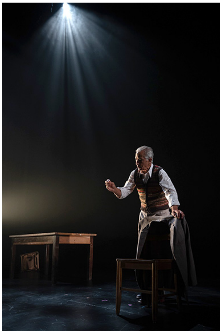
_____ jako Jan Karski w przedstawieniu _____ _____

_____ _____ _____ _____ _____ _____ _____ _____