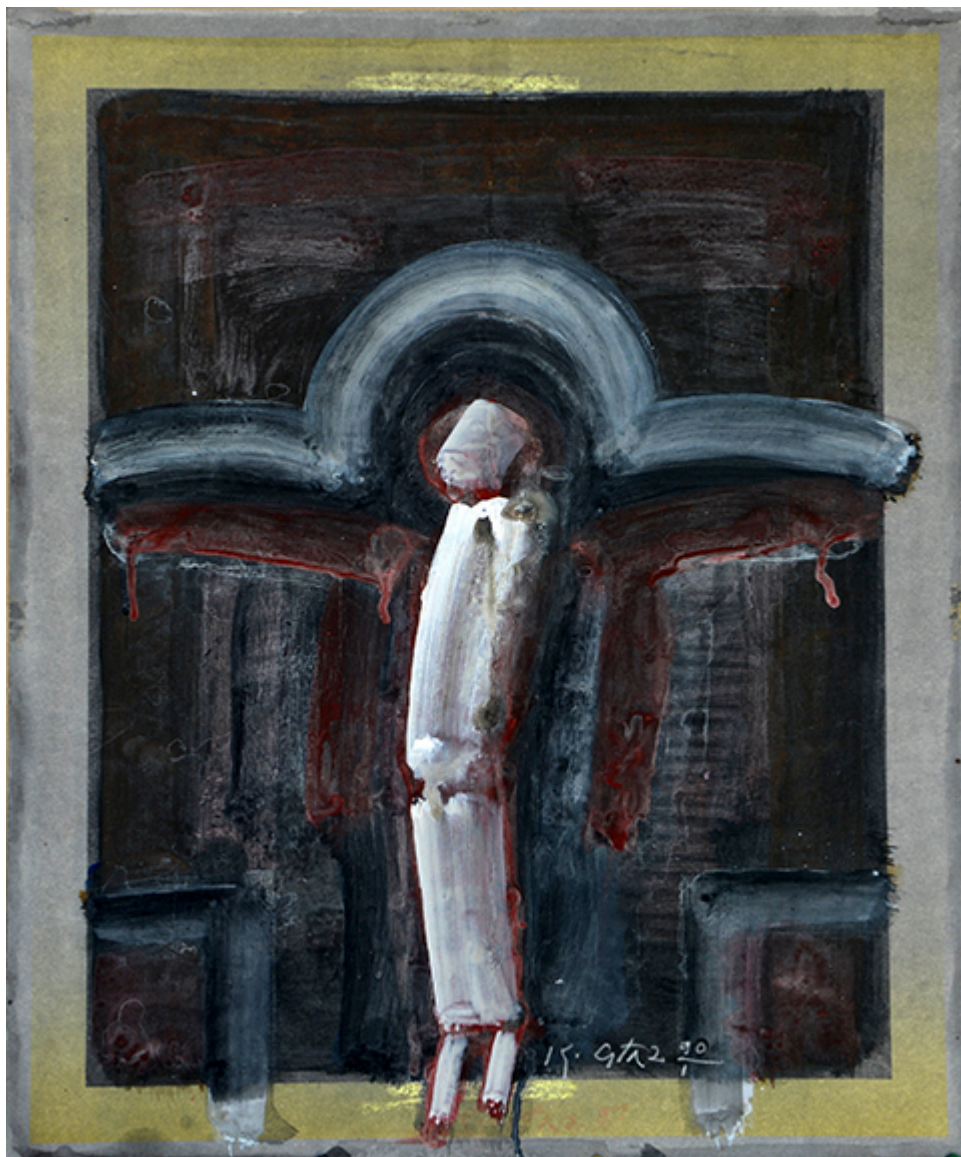
Kazimierz Głaz, Gwasze