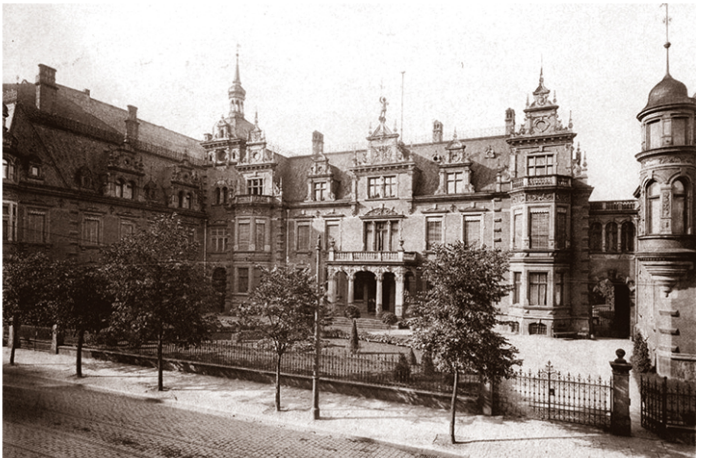
Pałac Schaffgotschów we Wrocławiu, lata 1900-1910, po II