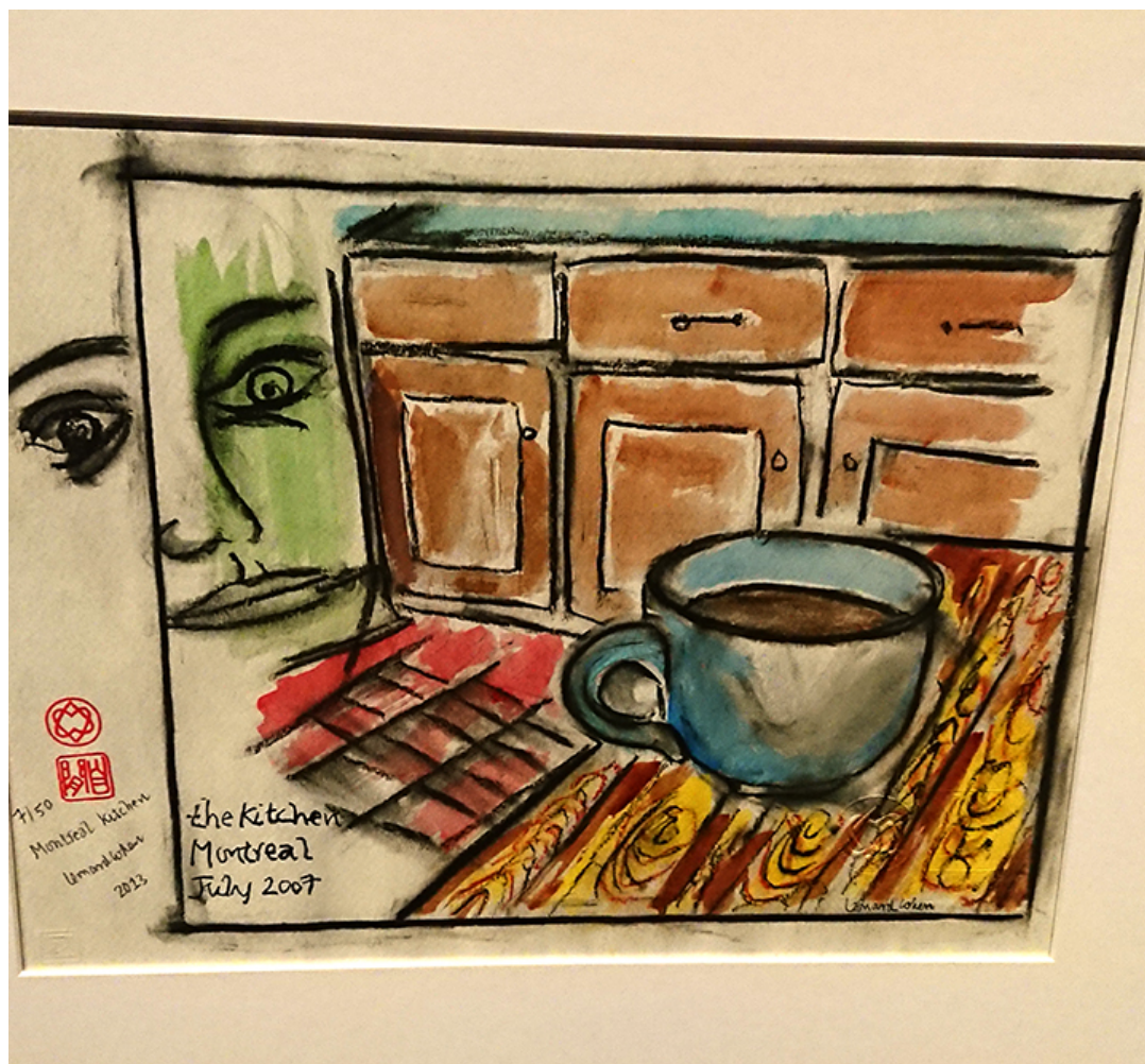
Leonard Cohen, The Kitchen, Montreal 2007, wystawa w Toronto, fot. Katarzyna Szrodt

Przy bliższej analizie koncepcji wystawy uderza brak obecności kobiet- zdjęć i opisów pokazujących ich rolę w życiu artysty, którego przecież całą twórczość liryczną i prozatorską przenikała fascynacja kobiecością. Ekspozycja nie porusza tematu kobiet, które były partnerkami muzyka i towarzyszyły mu na różnych etapach życia jako muzy inspirujące kolejne utwory, czy doprowadzające artystę do rozpacz, co też od razu znajdowało upust w tekstach. Uboższa o ten wątek wystawa „Everybody Knows” jednak mówi dużo o Leonardzie Cohenie i legendzie, jaką pozostawił po sobie. Prezentuje Cohena jako artystę