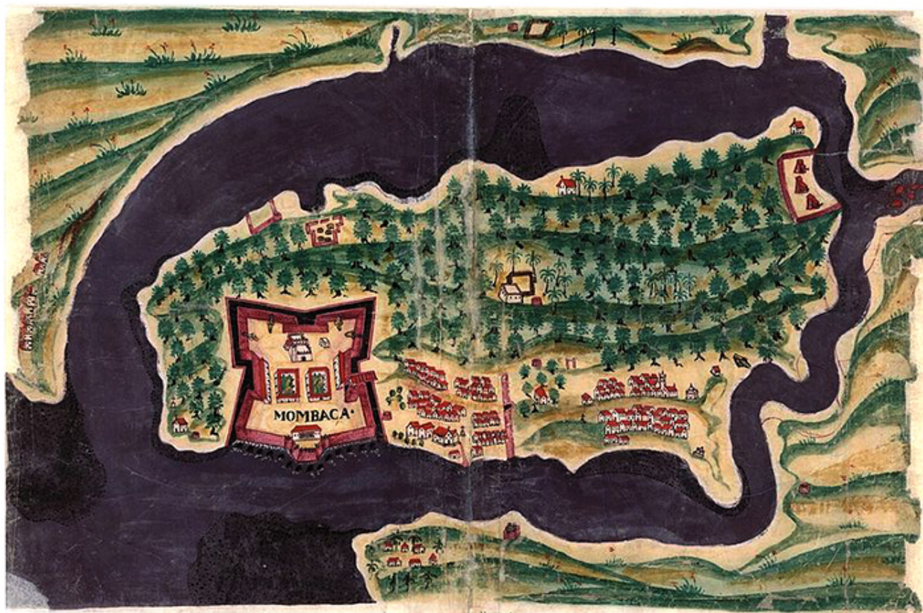
Forteca w Mombasie.

wielkie żaglowce, uzbrojonych w szable Portugalczyków oraz Arabów strzelających do nich z łuków, ryby, karabele. Na środku dziedzińca niska, ale obsypana gęsto wielkimi czerwonymi kwiatami akacja tropikalna („płomień lasu”). Wreszcie mam okazję sfotografować te kwiaty z bliska. Cudo!!!