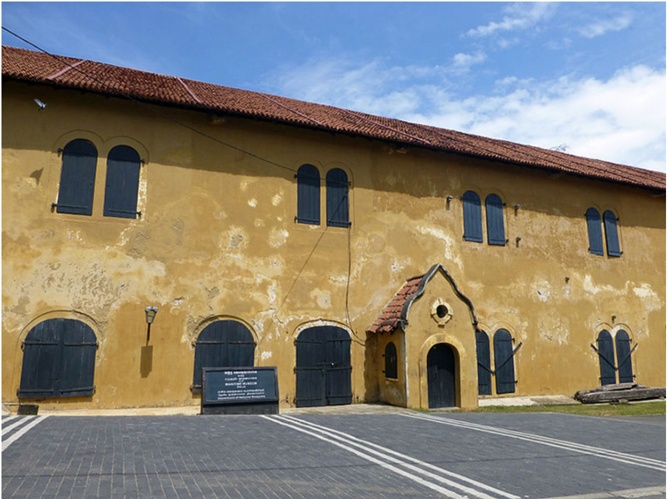
Galle. Muzeum Morskie.

Obecność portugalska na Cejlonie trwała krótko, zaledwie sto pięćdziesiąt lat. Portugalczycy zainteresowani byli głównie eksportem cynamonu, którego Cejlon był jedynym producentem. Zdążyli jednak zbudować kilka fortów. Poza Galle także w stolicy wyspy, Colombo i 40 km na północ od stolicy, w Negombo oraz w kilku innych miejscach. W roku 1640 pojawili się już Holendrzy i to oni na ponad sto kolejnych lat stali się panami wyspy. Udało mi się znaleźć holenderski plan fortu w Negombo z roku 1640. Myślę, że oddaje on dość wiernie jego portugalską strukturę. Wpływy portugalskie są do dziś widoczne w