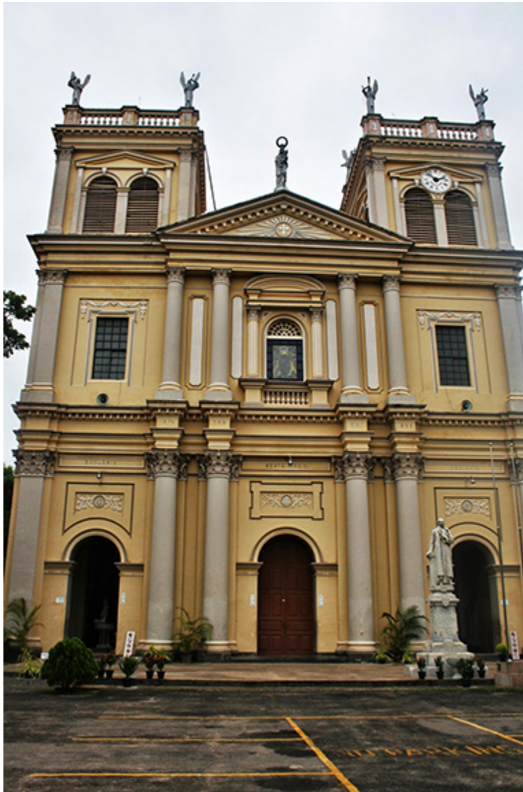
Kościół Matki Boskiej w Negombo (Sri Lanka),