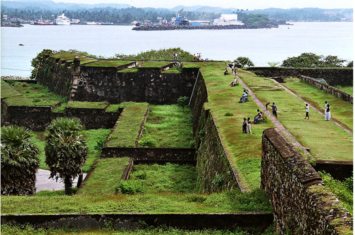
Galle. Fort portugalski.

Gdy podjeżdżamy autokarem w stronę kościoła ewangelickiego, otwiera się duży centralny plac ocieniony przepięknie ukształtowanymi gałęziami rozłożystych samanów. Ujrawszy tę nadzwyczajną koronkę „wyhaftowaną” misternie ponad dachami domów, postanawiam tam zostać, by napatrzeć się do woli na te urocze zakątki. Wrócę do autokaru „tuk-tukiem” za 2 dolary. Umawiam się z jego właścicielem, który niecierpliwie krąży koło mnie w jedną i w drugą stronę. Tu jakiś stary dom ozdobiony barokowymi wazami, tam długi budynek wsparty na masywnych, okrągłych kolumnach, inny, jeszcze dłuższy, o półokrągłych oknach pod samym dachem i wiekowych przyporach. Nad wejściem do jednego z tych budynków herb holenderskiej