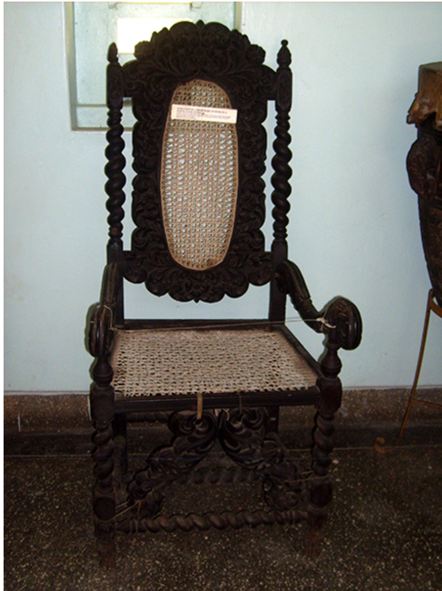
Fotel indo-portugalski w muzeum Fortu w Mombasie.