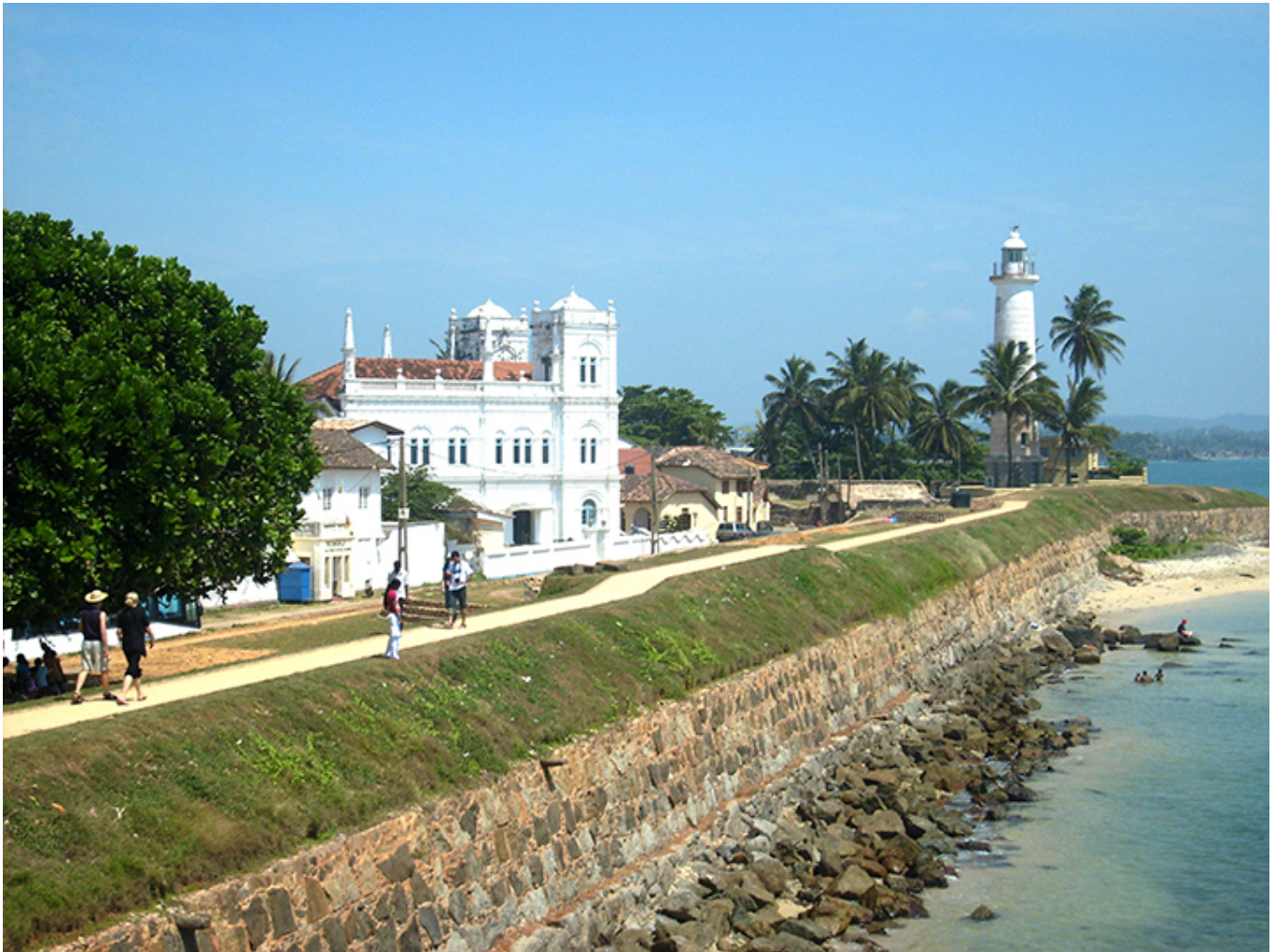
Galle. Dawny kościół portugalski, obecnie meczet.