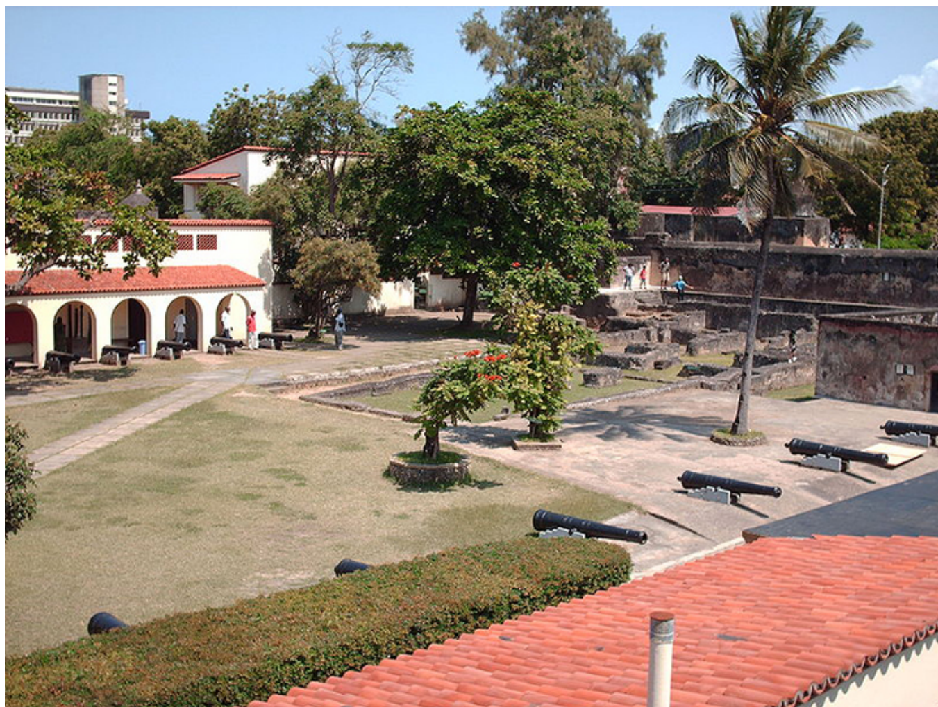
Fort Jezusa. Mombasa.

środku cytat z Koranu. Wychylamy się ku morzu w starym porcie Mombasa . Słońce piecze nieznośnie. Sklepy z interesującymi maskami, skromniutki meczet, stare hotele i znakomity punkt widokowy na portugalską fortecę. To stąd widać ją najlepiej. Potem świątynia hinduistyczna zbudowana w latach 50-tych XX wieku. Dla kogoś, kto nie był w Indiach, czy na Sri Lance , jest to niewątpliwie ciekawostka. Ładnie prezentują się zwieńczone kopułkami kaplice na skraju dziedzińca.