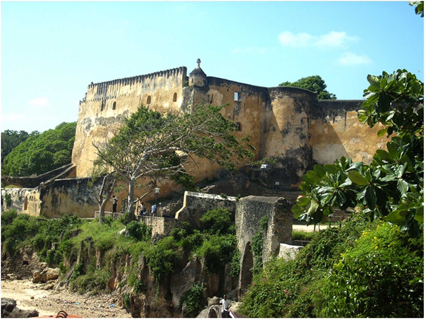
Fort Jezusa. Mombasa.