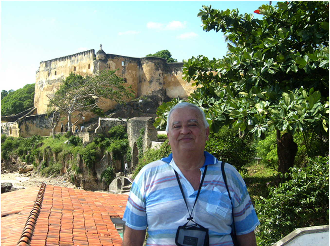
Autor na tle portugalskiego Fortu Jezusa w Mombasie.