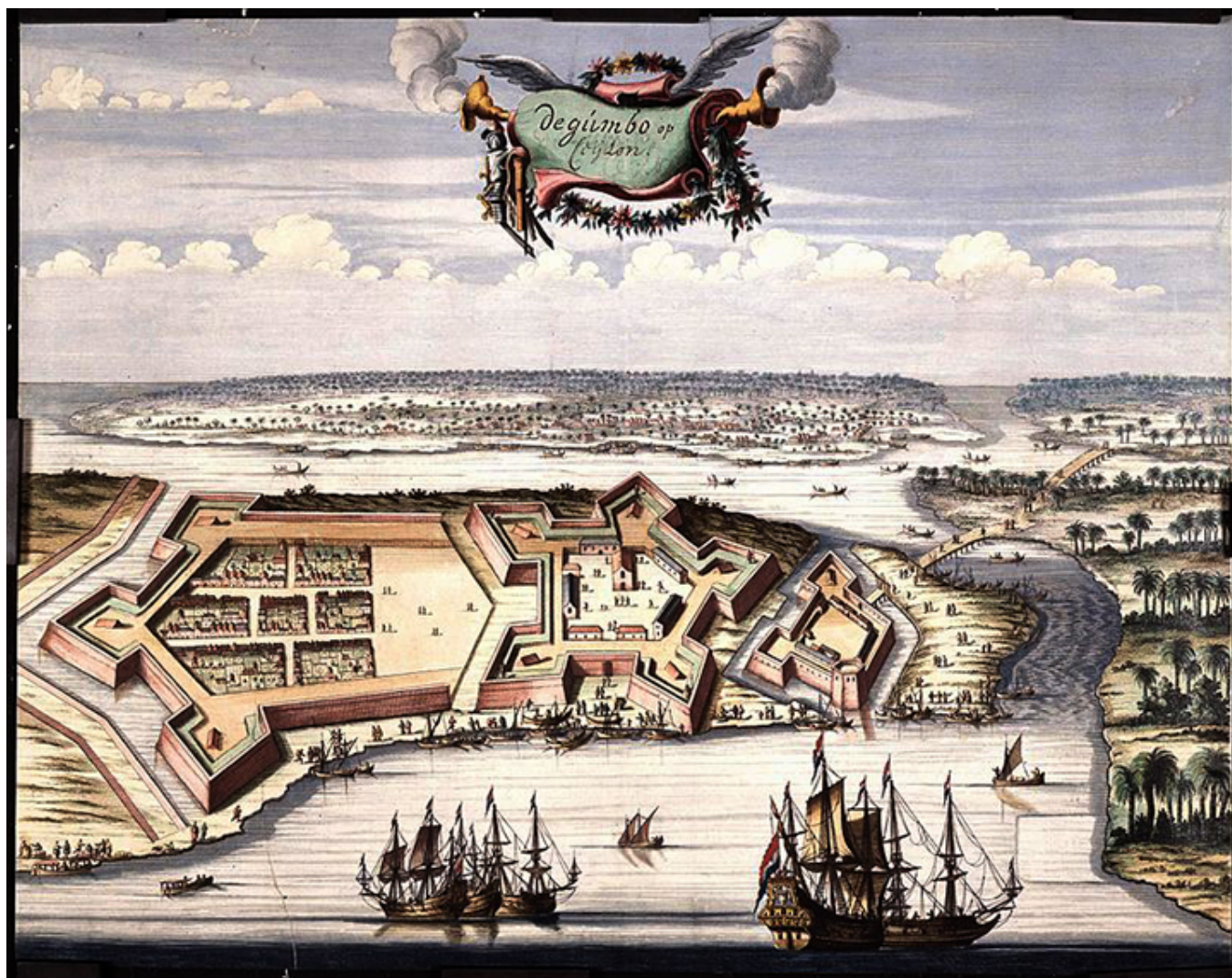
Portugalski, a potem holenderski fort Negombo. Plan z roku 1665 (40 km na północ od Colombo).

architekturze kościołów katolickich, a także w nazwiskach i w miejscowym języku usianym zapożyczeniami z języka portugalskiego.