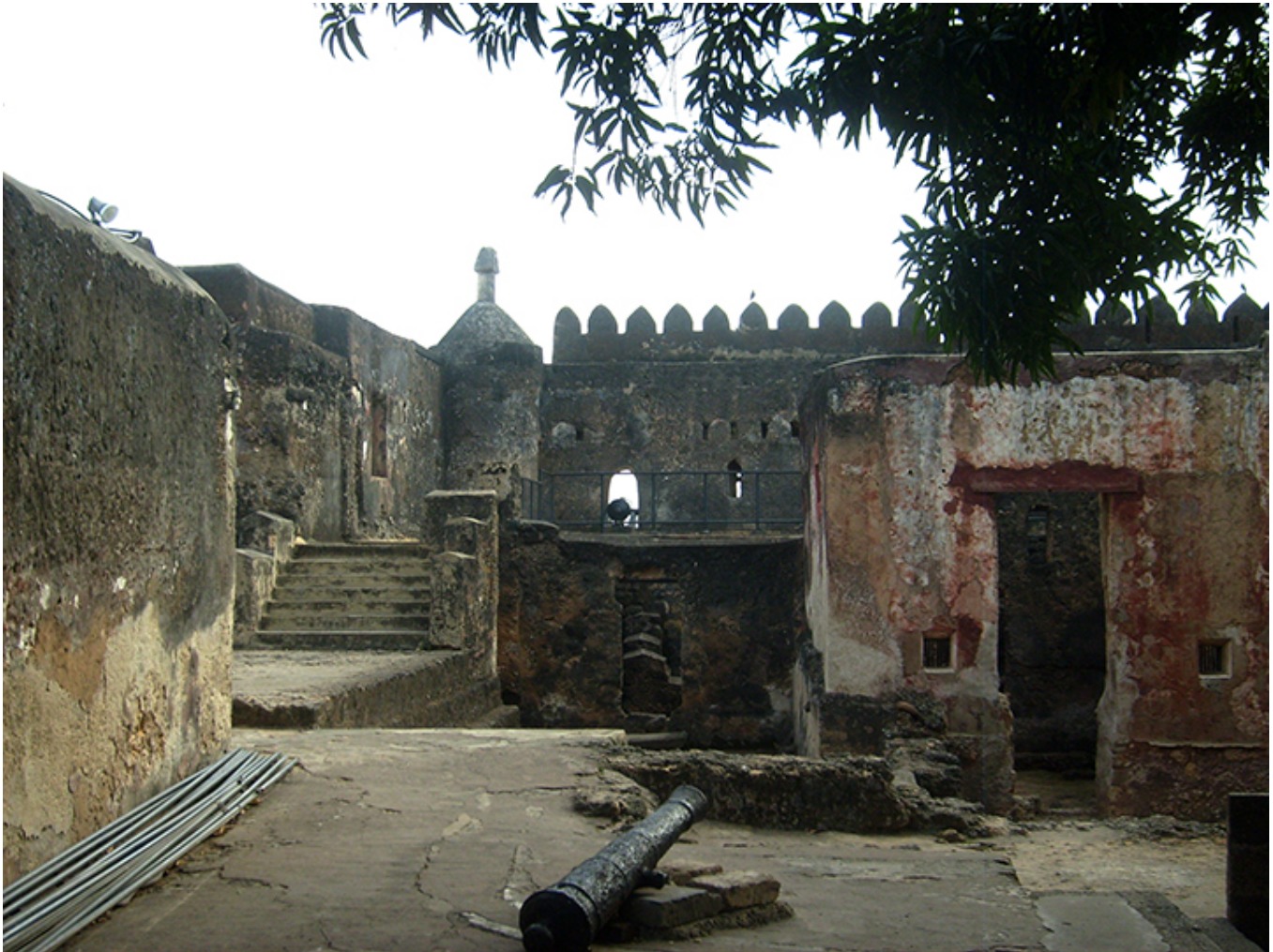
Fort Jezusa. Mombasa.

Gdy chodzi o ślady portugalskie w okolicy to na północ od Mombasy , na wybrzeżu Oceanu Indyjskiego , jest kolejna dawna forteca portugalska, Malindi (po portugalsku Melinde), oddalona o 119 km od Mombasy . W materiałach portugalskich odnalazłem informację, że w roku 1500 Portugalia założyła tam faktorię handlową. Niestety, nie udało mi się tam dotrzeć.