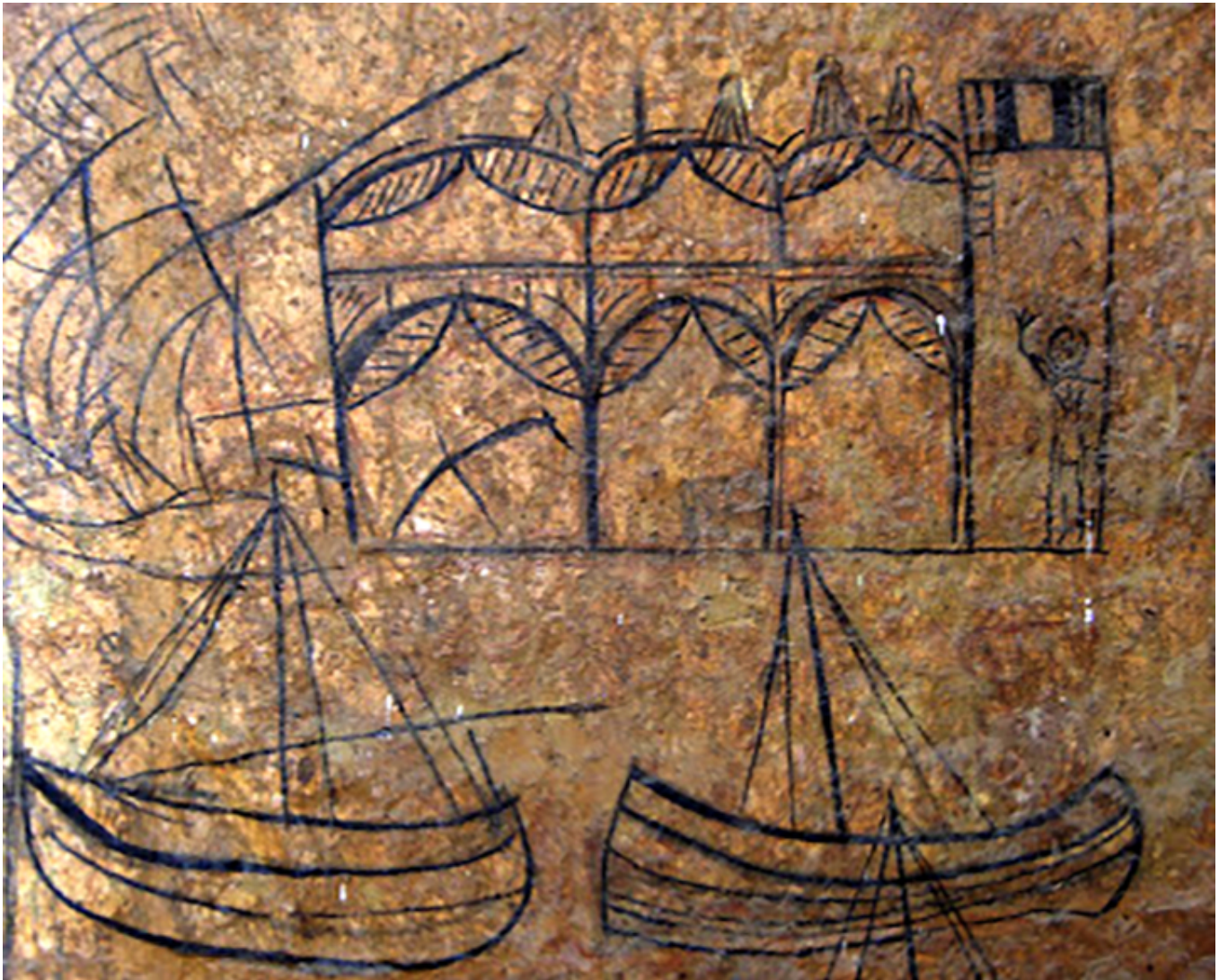
Fort Jezusa. Rysunki na ścianach.

Od momentu przejęcia fortecy przez Arabów w 1698 roku zaczął się ich wpływ w miejscowej sztuce i w wieku XVIII zdobili miasto i fortecę pięknie rzeźbionymi w drewnie i zdobionymi cytatami z Koranu drzwiami. Takie drzwi zachowały się na terenie fortecy, a na sąsiednim Starym Mieście stanowią jego najcenniejszą ozdobę. Widać w ich rysunku także wpływy indyjskie. Mimo, że Stare Miasto jest obecnie dość zaniedbane, niewątpliwie warto je zwiedzić głównie dla tych bogato rzeźbionych drzwi. W dekoracji przeważają elementy roślinne: kwiaty, piękne esy-floresy i na