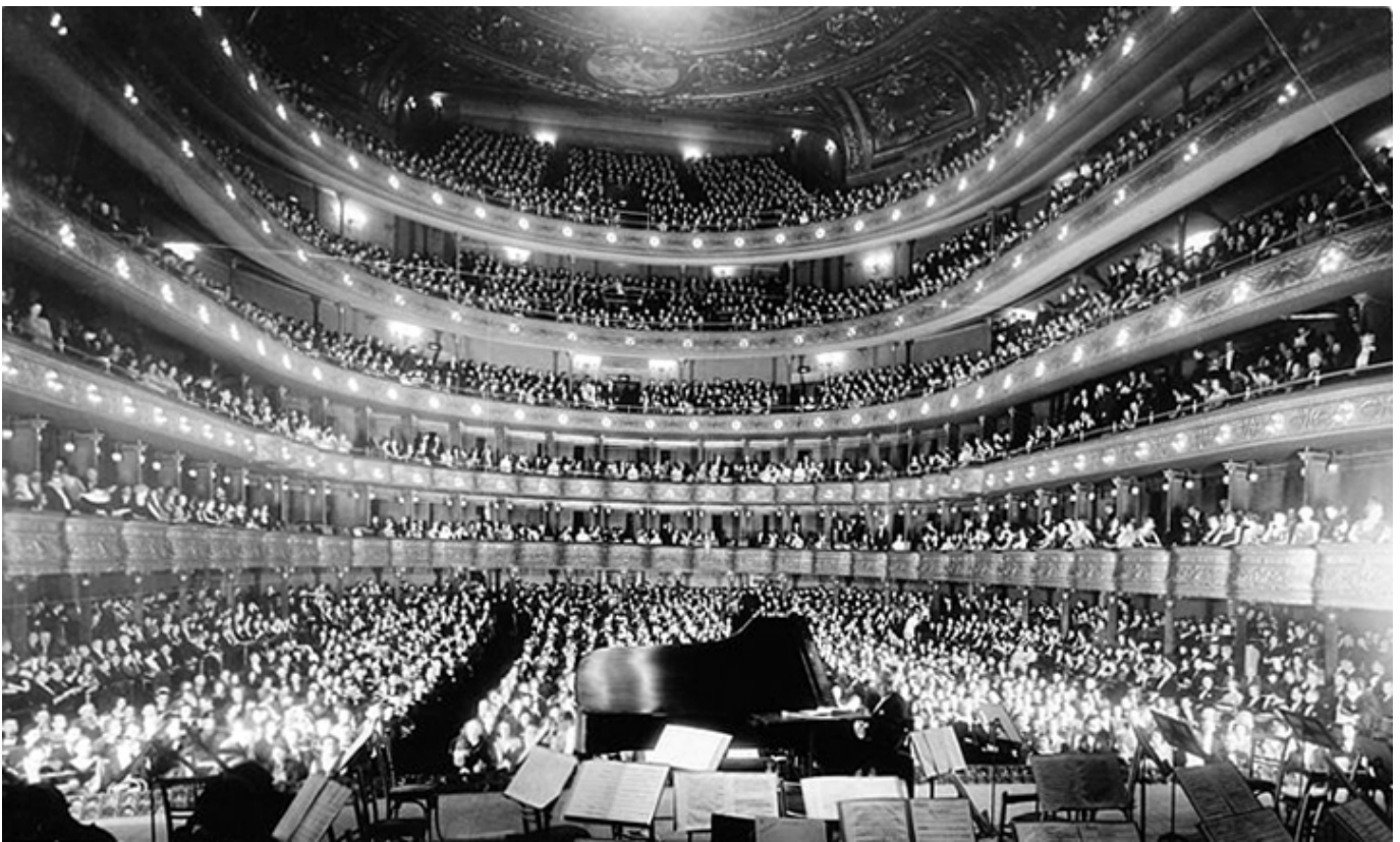
Sala w Carnegie Hall na 2800 miejsc w 1891 r.

Po pierwszych pięciu recitalach Paderewskiego w Nowym Jorku w sali koncertowej Madison Square Garden na 1500 osób okazało się, że miejsc brakowało i trzeba było dostawiać krzesła. Żaden impresario wcześniej nie rezerwowałaby sali na 2800 miejsc, ale „zapotrzebowanie” na Paderewskiego było tak duże, że sponsor trasy koncertowej, firma Steinway, zaryzykowała i zarezerwowała znacznie większą salę właśnie w Carnegie Hall.