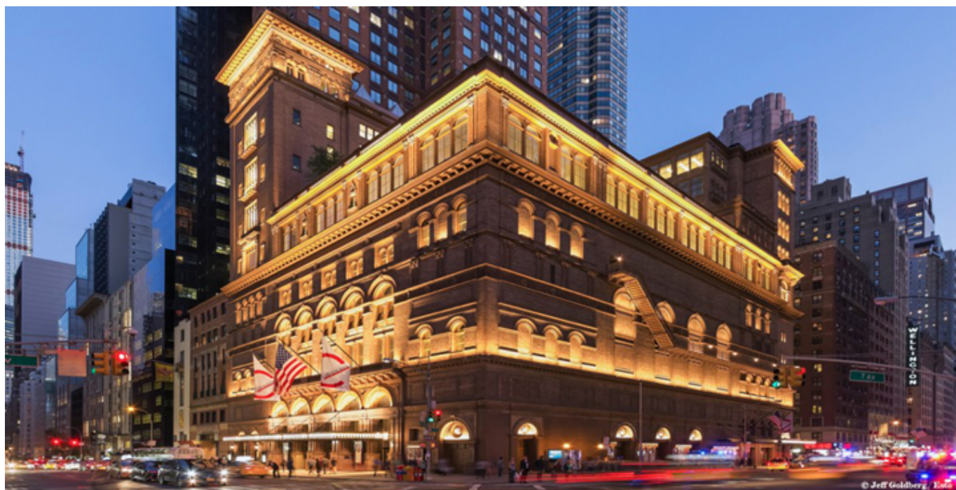
Carnegie Hall w Nowym Jorku.