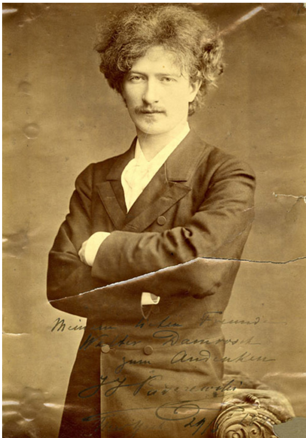
Portret Ignacego Jana Paderewskiego z dedykacją dla Waltera Damroscha