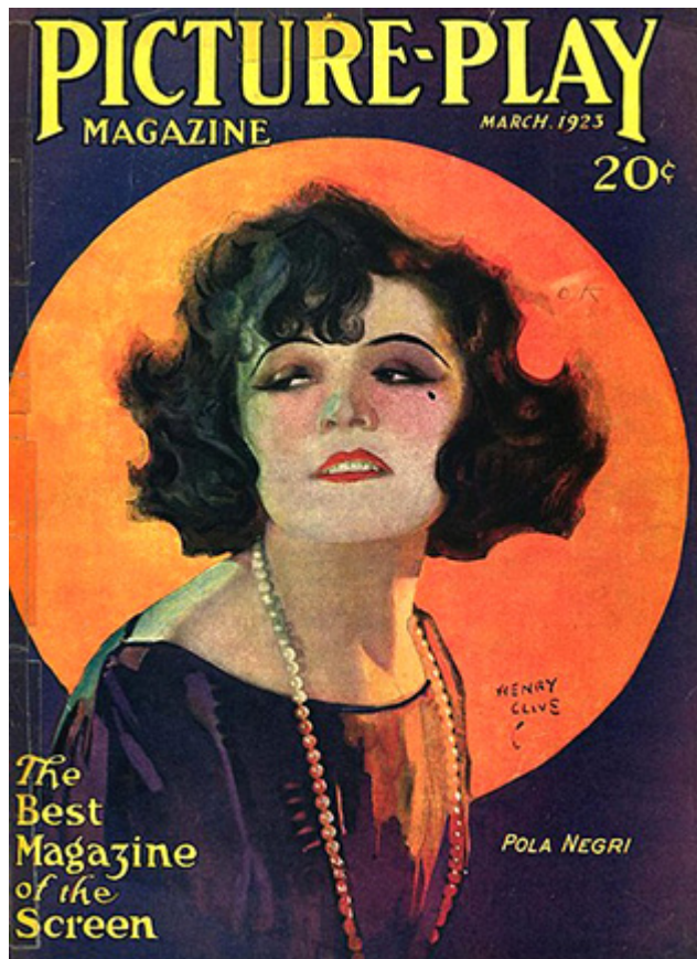
Pola Negri na okładce magazynu „Picture-Play”, 1923 r. malował Henry Clive

Jak na gwiazdę przystało, musiała stale podtrzymywać zainteresowanie swoją osobą – zwłaszcza poza ekranem. Działo się to poprzez promocję, sesje zdjęciowe, plakaty, obecność w gazetach i kolorowych magazynach, w życiu prywatnym poprzez głośne romanse, podróże, jej egzotykę, skandale towarzyskie czy drogie inwestycje jak: zakupy willi w Hollywood, białego rolls-royce’a z dodatkami z kości słoniowej, zamku we Francji, klejnotów Habsburgów. Nosła perłowe broszki i naszyjniki, biżuterię z diamentami, futra z gronostajów etc. Aktorka lansowała też modę: nosła turbany, wysokie buty „kozaczki”, malowała na ostry czerwony kolor usta, a latem na taki sam