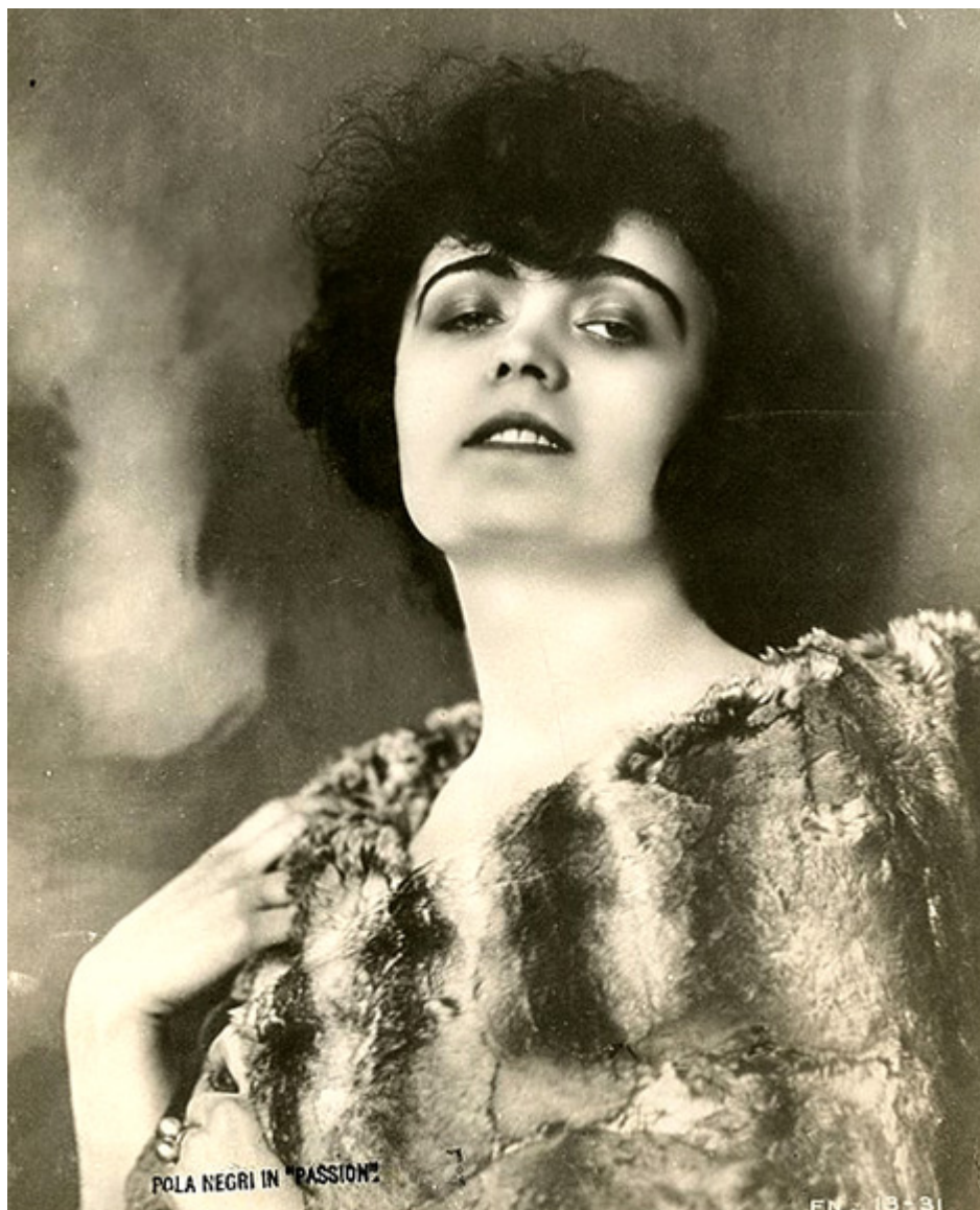
Pola Negri, 1921 r.

W poprzedniej części opisałem rodowód Poli Negri (1896-1987), jej drogę do stania się gwiazdą kina niemego, wyjątkową karierę w Hollywood. Teraz jej życie prywatne, hołdowanie polskości, upamiętnianie aktorki w Polsce i na świecie.