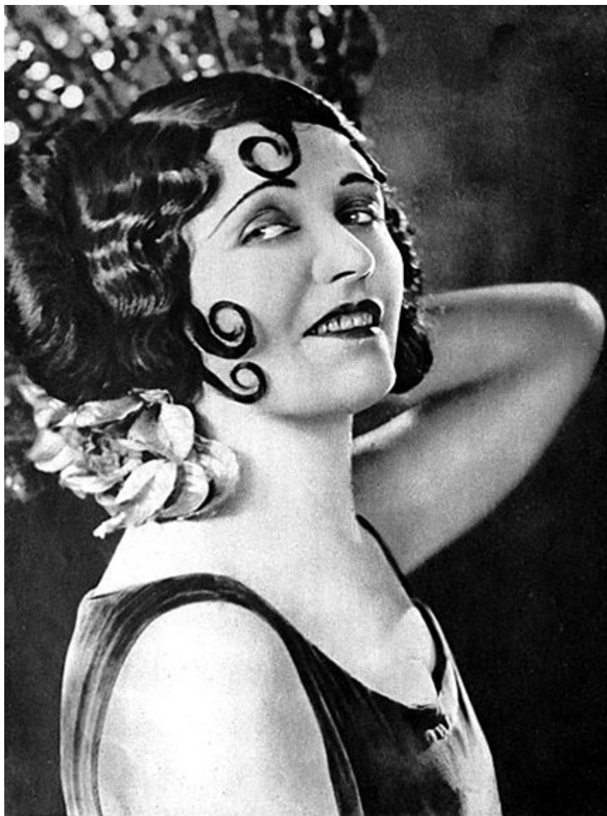
Pola Negri w magazynie "Screenland", 1923 r.