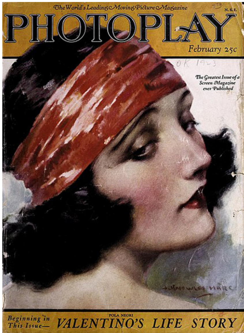
Pola Negri na okładce magazynu „Photoplay”, luty 1923 r.