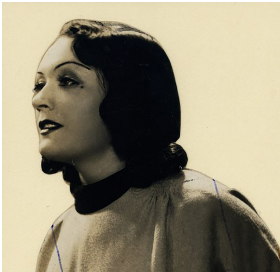
Pola Negri, Portugalia 1938 r.