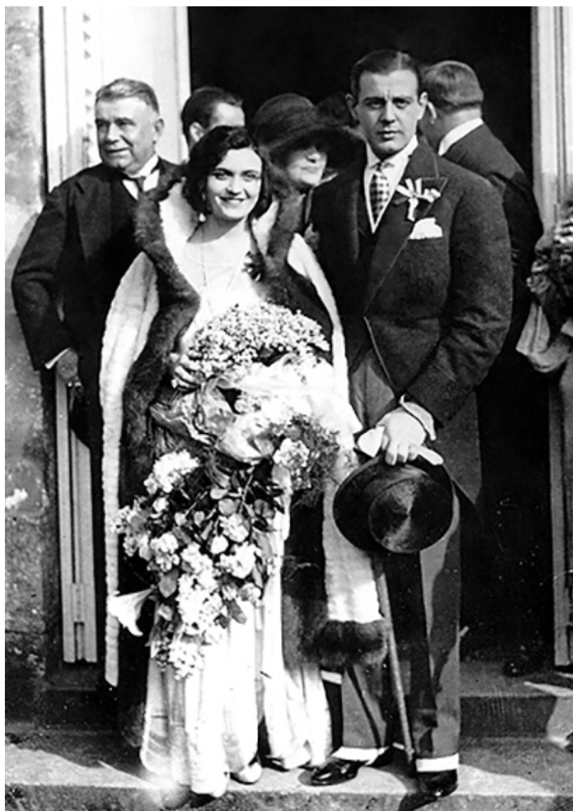
Ślub Poli Negri z księciem Sergiuszem Mdivanim, 14 maja 1927 r.

Kochała trzech mężczyzn, za których nie dane jej było wyjść za mąż: ww. Petroniusza, Rudiego i Glena Kidstona. Ten ostatni to angielski komandor, pilot, romansowała z nim w 1929 roku w Anglii podczas kręcenia tu filmu. Zginął w katastrofie lotniczej. O jej rękę zabiegał później także jeden z najbogatszych ludzi świata, Amerykanin Harold McCormick (1872-1941): elegancki, szarmancki, rycerski. Odmówiła m.in. z powodu zbyt dużej różnicy wieku, poza tym miał nierówne usposobienie, bała się też, że ceną dostatniego życia będzie rezygnacja z aktorstwa. A potem miała wątpliwości, czy dobrze zrobiła nie wychodząc za niego... Na koniec życia stwierdziła, że jednak ani Eugeniusza hr. Dąbskiego ani Serża księcia Mdivaniego nie kochała prawdziwie... Gdy w jednym z filmów wygłaszała