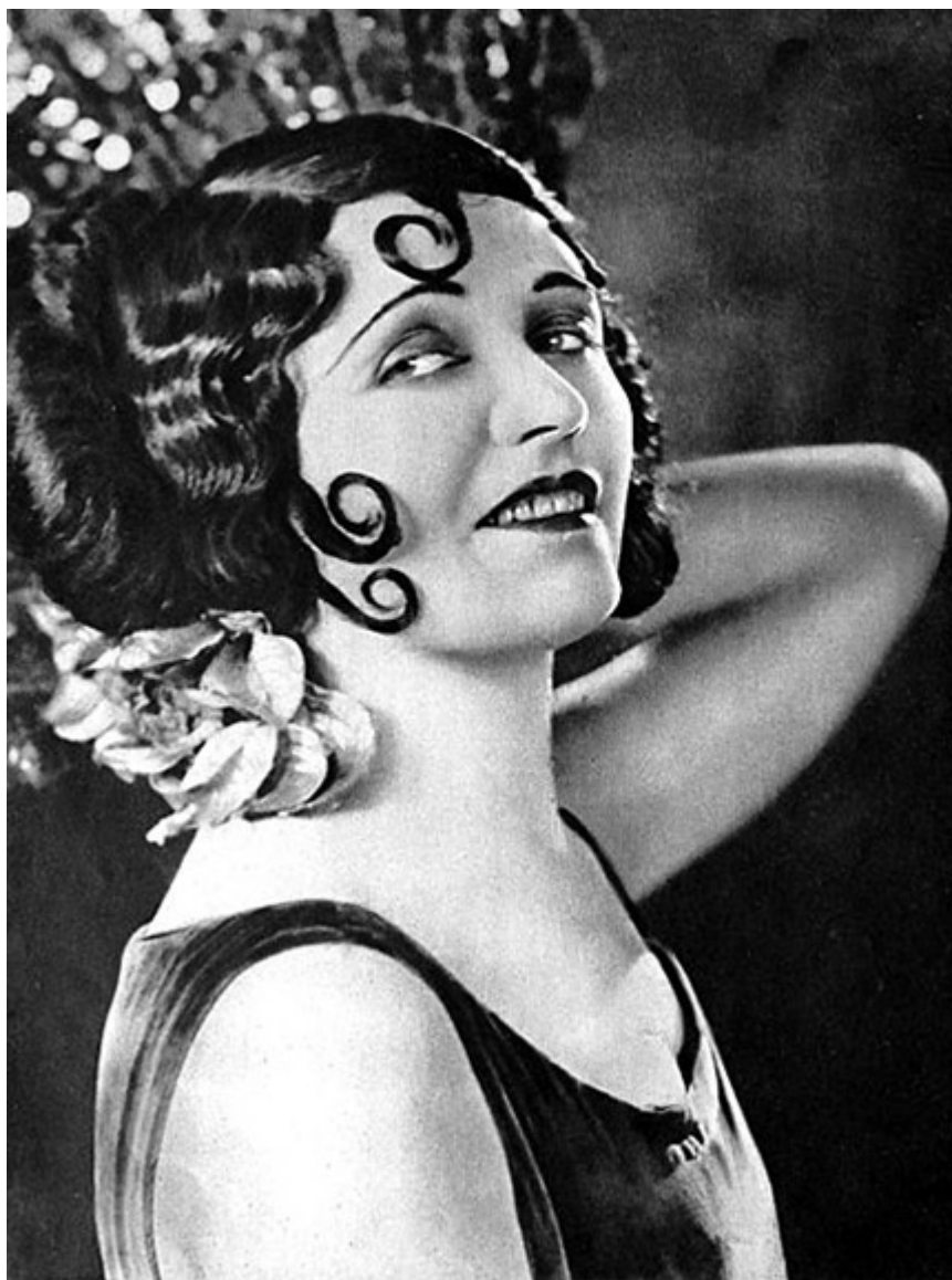
Pola Negri w magazynie "Screenland", 1923 r.

Kazimierz Hulewicz. Grała też w teatrze m.in. Jadwisie w Dzkiej kacze Henrika Ibsena w tym samym roku, zaś w 1915 dała świetny popis aktorstwa i tańca w Teatrze Wielkim, w operze Niema z Portici Daniela F. E. Aubera. Wystąpiła w bardzo trudnej roli Fenelli, ta niema bohaterka jest postacią dramatyczną, która dużo tańczy, gra mimiką twarzy, gestykulacją. W filmie Bestia w reż. Aleksandra Hertza (1917) gra dziewczynę uwikłaną w trójkąt miłosny, ucieka z prowincji do miasta, robi karierę tancerki, romansuje z bogatym mężczyzną. Gra bardzo emocjonalnie, żywiołowo, jest jak zawsze uwodzicielska. Ale gra też siebie, co widać i na planie - w jej pokoju po sukcesach scenicznych zawieszono wieniec kwiatów z taśmą z jej nazwiskiem.