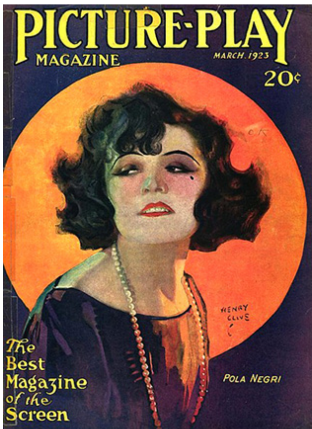
Pola Negri na okładce magazynu „Picture-Play”, 1923 r. malował Henry Clive

Jak na gwiazdę przystało, musiała stale podtrzymywać zainteresowanie swoją osobą – zwłaszcza poza ekranem. Działo się to poprzez promocję, sesje zdjęciowe, plakaty, obecność w gazetach i kolorowych magazynach, w życiu prywatnym poprzez głośne romanse, podróże, jej egzotykę, skandale towarzyskie czy drogie inwestycje jak: zakupy willi w Hollywood, białego rolls-royce’a z dodatkami z kości słoniowej, zamku we Francji, klejnotów Habsburgów. Nosła perłowe broszki i naszyjniki, biżuterię z diamentami, futra z gronostajów etc. Aktorka lansowała też modę: nosła turbany, wysokie buty „kozaczki”, malowała na ostry czerwony kolor usta, a latem na taki sam kolor paznokcie u stóp. Szokowały plotki o romansowaniu z Hitlerem, że była szpiegiem, że nosiła tytuł księżnej. Zwracały uwagę słynne awantury i gry (wg wielu sztuczne) prowadzone przez nią z młodszą gwiazdą Hollywood i jej rywalką Głorią Swanson, Amerykanką o szwedzko-włoskich korzeniach. Pracowały dla tej samej wytwórni filmowej, Swanson odeszła w proteście i atmosferze przegranej. Pola nie lubiła kotów, była przesądna i kiedyś nie wyszła na plan filmowy z garderoby, bo ktoś wypuścił pełno czarnych kotów. Padło podejrzenie na Głorię Swanson, która