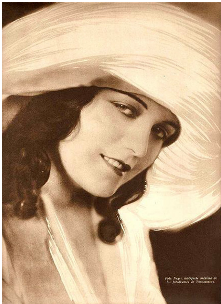
Pola Negri w „Argentinean Magazine”, 1927 r.