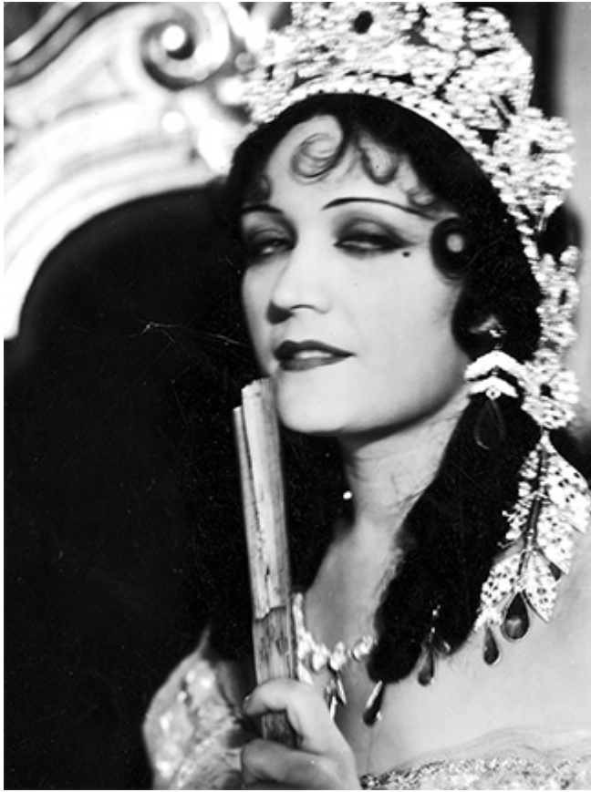
Pola Negri, kadr z filmu „Fanatyzm”, 1934 r.