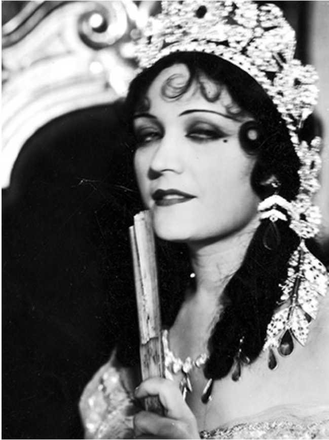
▪ Pola Negri, kadr z filmu „Fanatyzm”, 1934 r.