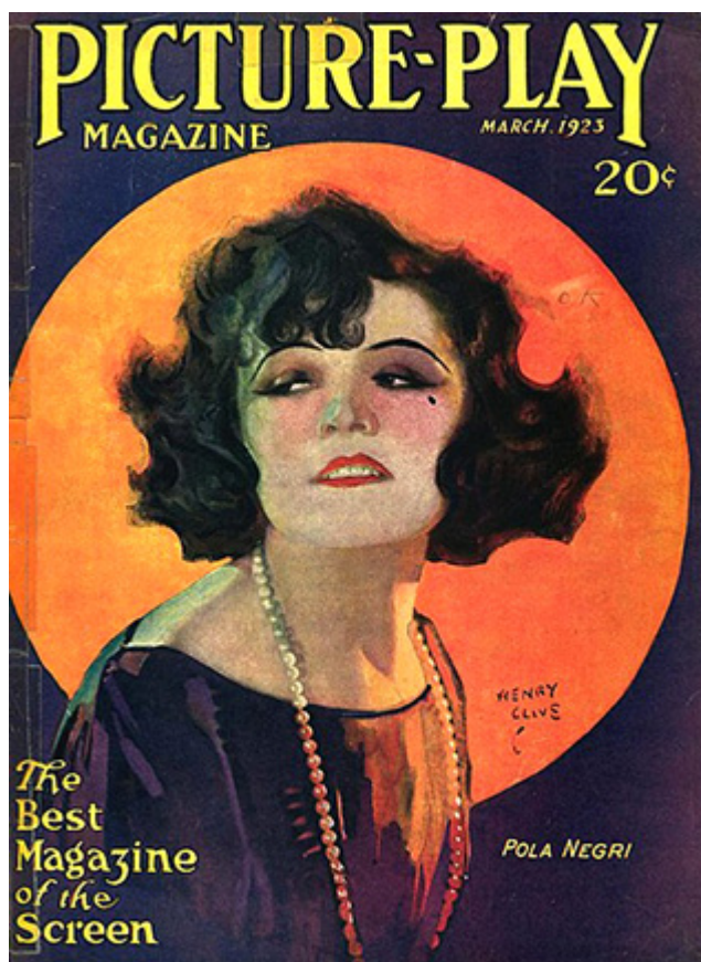
Pola Negri na okładce magazynu „Picture-Play”, 1923 r. malował Henry Clive

Jak na gwiazdę przystało, musiała stale podtrzymywać zainteresowanie swoją osobą – zwłaszcza poza ekranem. Działo się to poprzez promocję, sesje zdjęciowe, plakaty, obecność w gazetach i kolorowych magazynach, w życiu prywatnym poprzez głośne romanse, podróże, jej egzotykę, skandale towarzyskie czy drogie inwestycje jak: zakupy willi w Hollywood, białego rolls-royce’a z dodatkami z kości słoniowej, zamku we Francji, klejnotów Habsburgów. Nosła perłowe broszki i naszyjniki, biżuterię z diamentami, futra z gronostajów etc. Aktorka lansowała też modę: nosła turbany, wysokie buty „kozaczki”, malowała na ostry czerwony kolor usta, a latem na taki sam kolor paznokcie u stóp. Szokowały plotki o romansowaniu z Hitlerem, że była szpiegiem, że nosiła tytuł księżnej. Zwracały uwagę słynne awantury i gry (wg wielu sztuczne) prowadzone przez nią z młodszą gwiazdą Hollywood i jej rywalką Głorią Swanson, Amerykanką o szwedzko-włoskich korzeniach. Pracowały dla tej samej wytwórni filmowej, Swanson odeszła w proteście i atmosferze przegranej. Pola nie lubiła kotów, była przesądna i kiedyś nie wyszła na plan filmowy z garderoby, bo ktoś wypuścił pełno czarnych kotów. Padło podejrzenie na Głorię Swanson, która