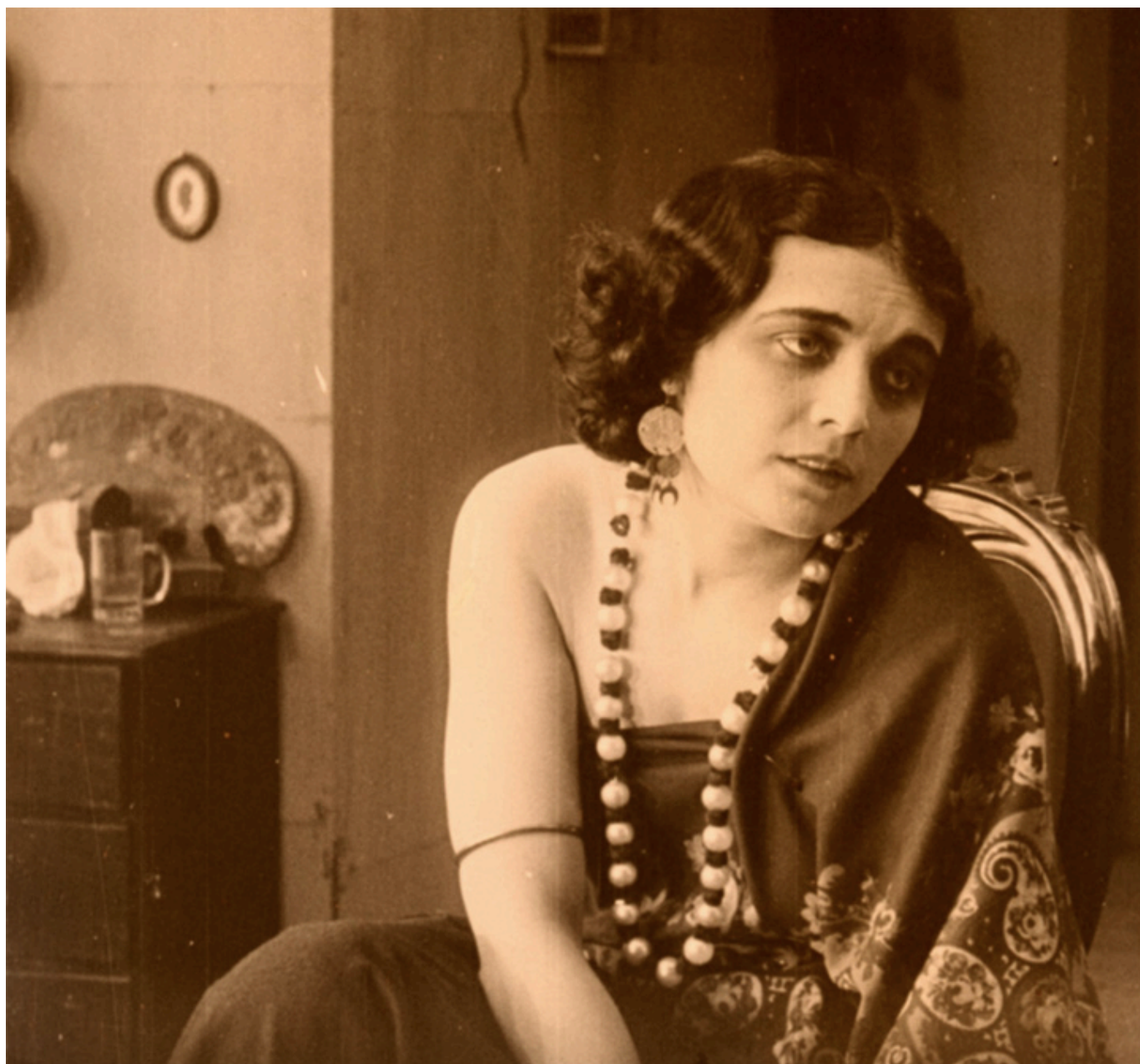
Pola Negri,, kadr z filmu „Mania. Historia pracownicy fabryki papierosów”, 1918 r.

Pola Negri (1896-1987) zdobyła na początku XX wieku pozycję największej aktorki kina niemego. Była pierwszą Europejską i jak dotąd jedyną Polką, która podbiła Hollywood. W okresie kina niemego jej kariera w Europie, Ameryce i na świecie sięgnęła szczytów. Dziś powoli następuje w Polsce renesans Poli Negri, autentycznej i profesjonalnej artystki, prawdziwej gwiazdy światowego formatu.