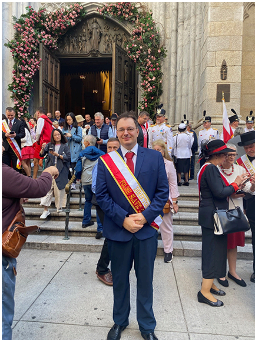
Po Mszy przed Katedrą św. Patryka w Dniu Parady

Zjednoczone to duży kraj, trochę też zróżnicowany stanowo, ale jest więcej możliwości prezentowania muzyki kameralnej, natomiast orkiestrowo wydaje mi się jest trudniej. Ale można usłyszeć fenomenalne interpretacje historyczne wykonywane przez takie orkiestry jak te z: Cleveland, Filadelfii, Chicago, Pittsburgha, czy posłuchać oper w: Metropolitan Opera. Muzyki najnowszej nie ma tak wiele w programach i stanowi mały procent.