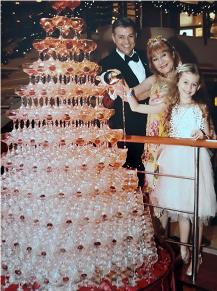
Saskia z babcią i dziadkiem na statku