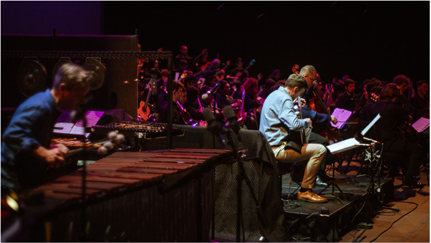
Fenomenalny koncert w Aisd Performing Arts Center w Austin, 18-tego lutego 2023 r.

[Redacted text block consisting of multiple horizontal black bars]