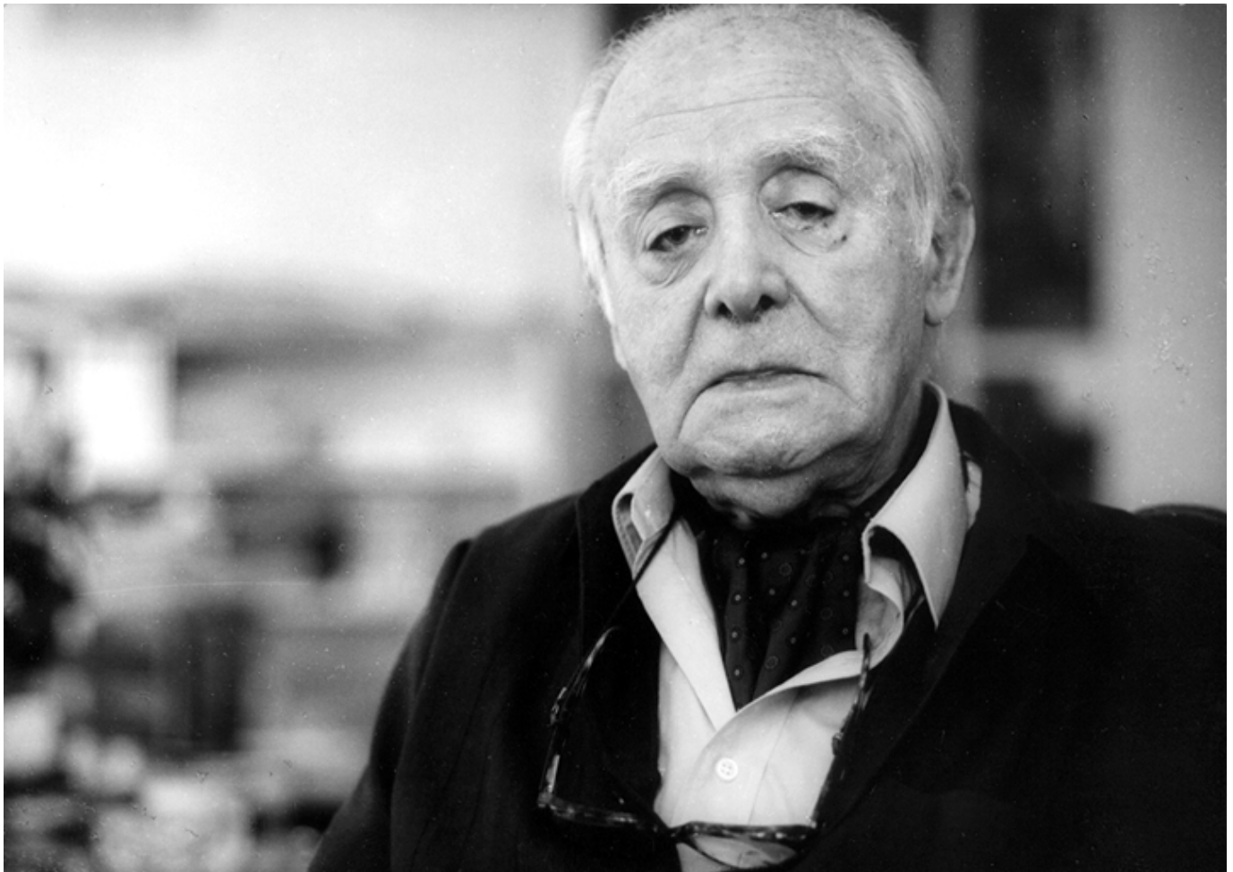
Jerzy Giedroyc

Nie bardzo rozumiem co Pan nazywa „woltą Kultury”... Nie sądzę bowiem, by uważał Pan za woltę popieranie przez nas wolności prasy i tzw. rewizjonistów krajowych z „Po Prostu” i „Krzywym Kołem” na czele? Popierając Październik i udzielając kredytu Gomułce nie traktowaliśmy tego jako wstąpienia do nowego BBWR, a jedynie przyłączenie się do walki prowadzonej w kraju o dalszą demokratyzację stosunków, nie tracąc ma się rozumieć z oczu wszystkich trudności, które istnieją. Mówiąc inaczej współpracujemy z pismami i czynnikami niezależnymi , a nie z czynnikami oficjalnymi. Czyba to też powinno być po linii „Merkuriusza”?