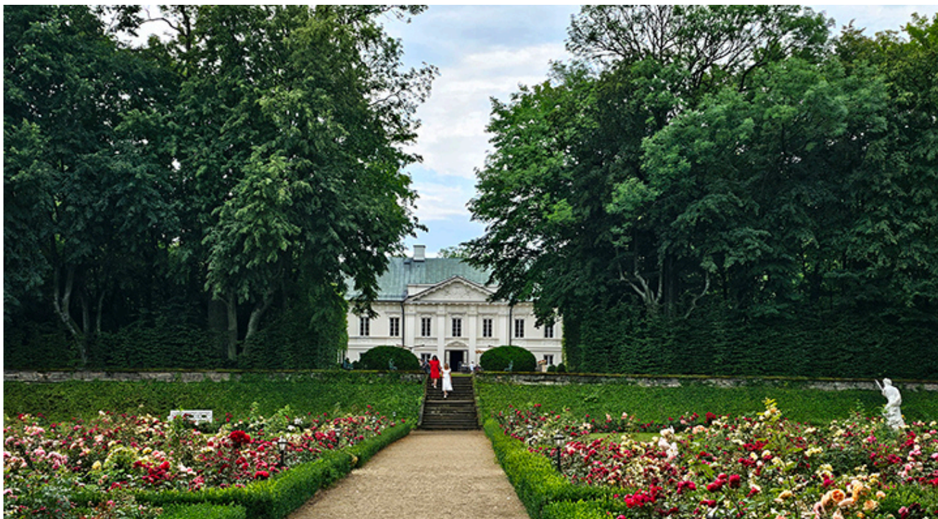
Pałac w Małej Wsi, koło Grójca