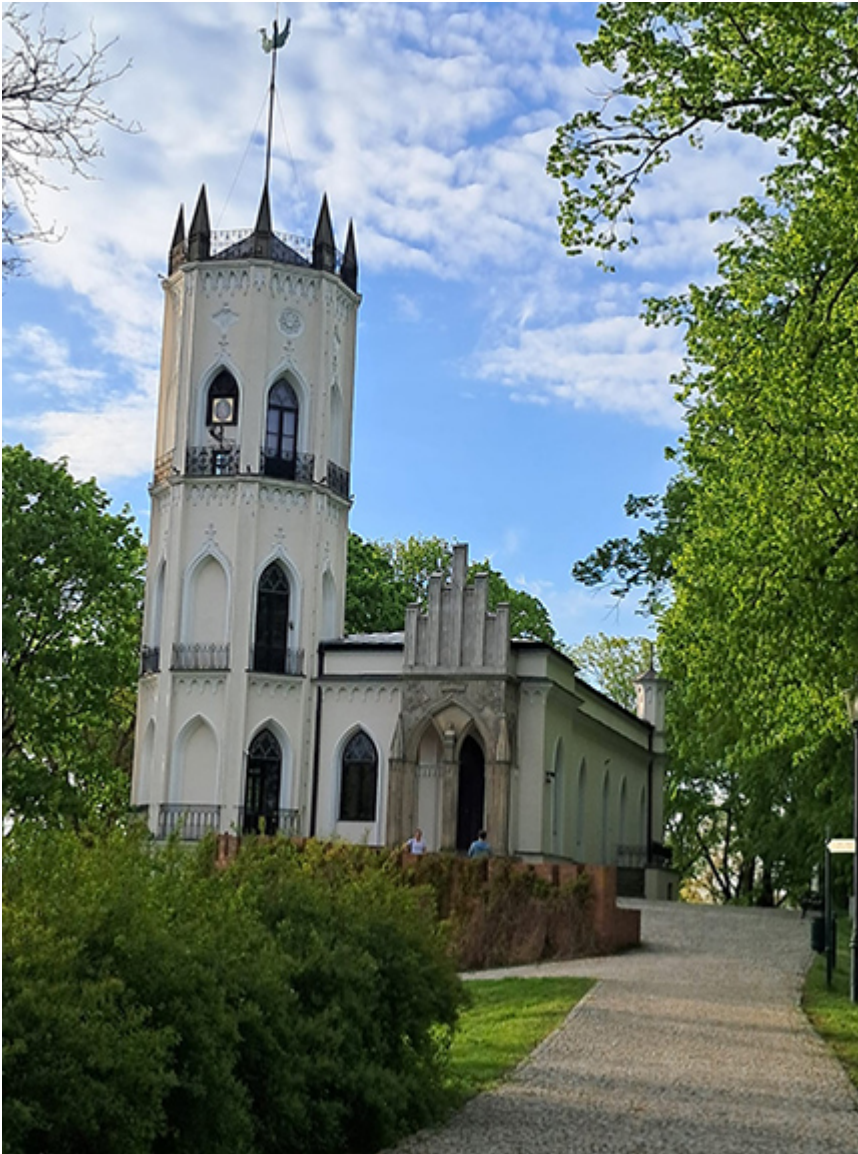
Rezydencja Krasińskich w Opinogórze

Wydarzenia, w których sztuka splata się z historią i pięknem otaczających ogrodów, zawsze przyciągają licznych melomanów.