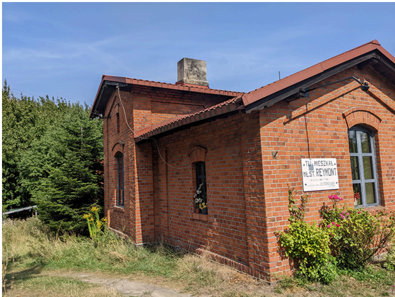
W latach 1888-1893 Władysław Reymont pracował jako dróżnik Kolei Warszawsko-Wiedeńskiej i mieszkał m.in. w Lipcach w tym domu, położonym przy przejeździe kolejowym