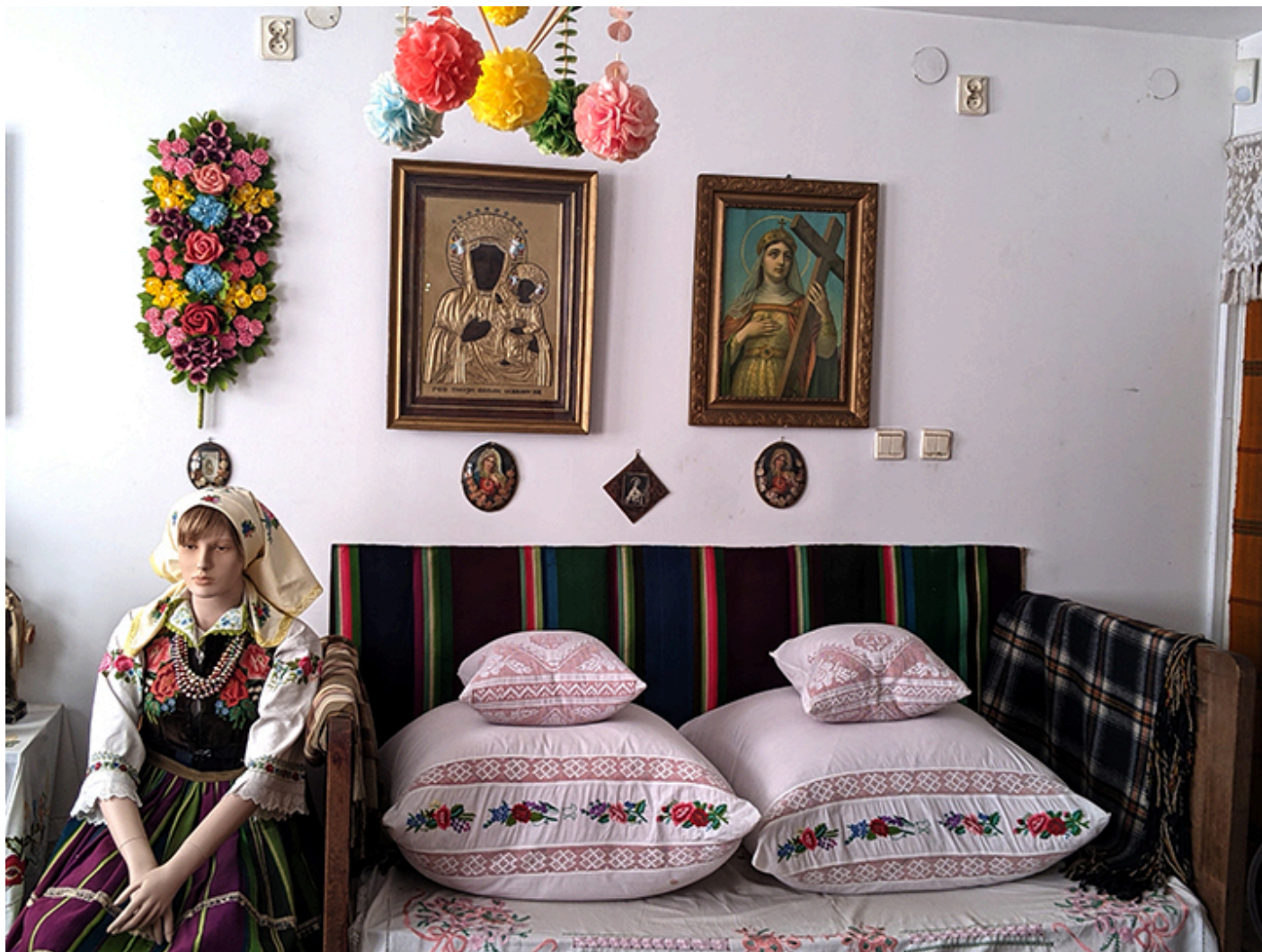
Muzeum im. Władysława Reymonta w Lipcach Reymontowskich