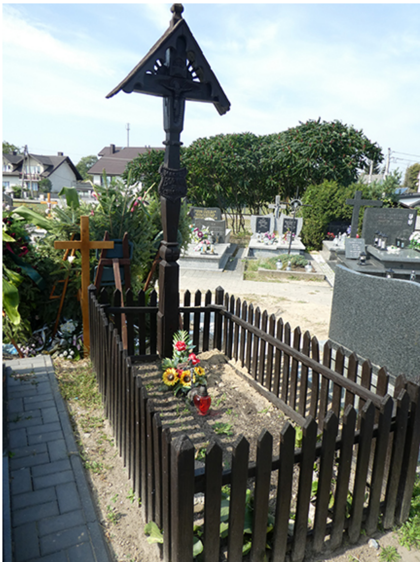
Symboliczny grób Macieja Boryny na cmentarzu w Lipcach Reymontowskich, fot. A. Sokołowski