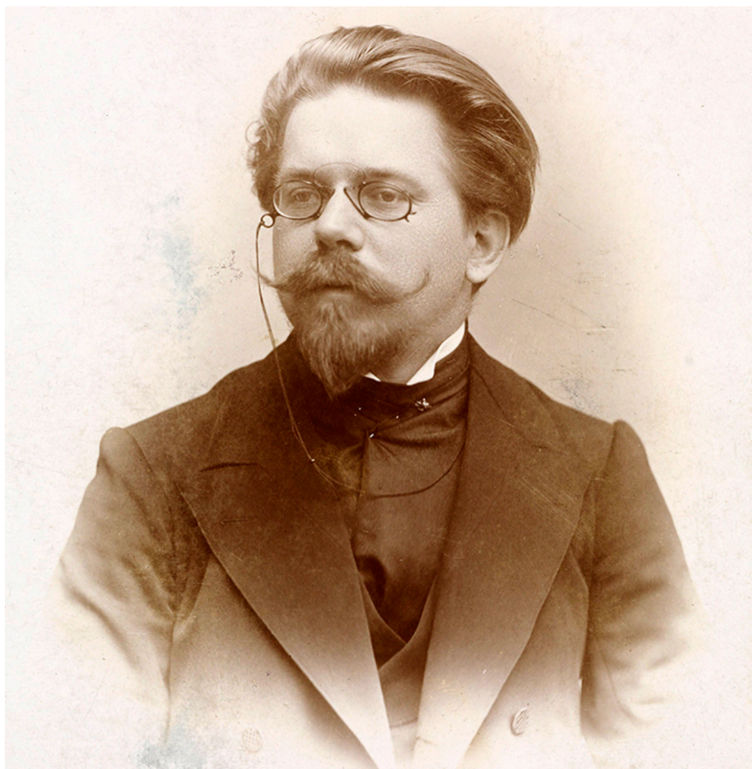
Władysław Reymont, ok. 1897 r)

„Illustrowanym” w latach 1904-1909. Akcja powieści obejmuje dziesięć miesięcy – od września do lipca na przełomie XIX i XX wieku – i rozgrywa się w małej wiosce Lipce i podzielona jest na cztery części, odzwierciedlające cykl przyrody: „Jesień”, „Zima”, „Wiosna” i „Lato”. Wybitny literaturoznawca Kazimierz Wyka podkreślał, że Reymont stworzył unikatowe w literaturze polskiej dzieło, które nie tylko opowiada o życiu chłopów, ale również wiernie oddaje ich mentalność, obyczaje oraz postrzeganie świata. Analizując powieść, Wyka zauważał, jak autor buduje świat przedstawiony poprzez rytm natury, cykliczne prace rolnicze, zmiany pór roku oraz święta, wyznaczające rytm życia bohaterów. „Chłopi” to także studium uniwersalnych ludzkich emocji i konfliktów – miłości, zazdrości, chciwości czy walki o władzę – nadające powieści ponadczasowy i uniwersalny charakter.