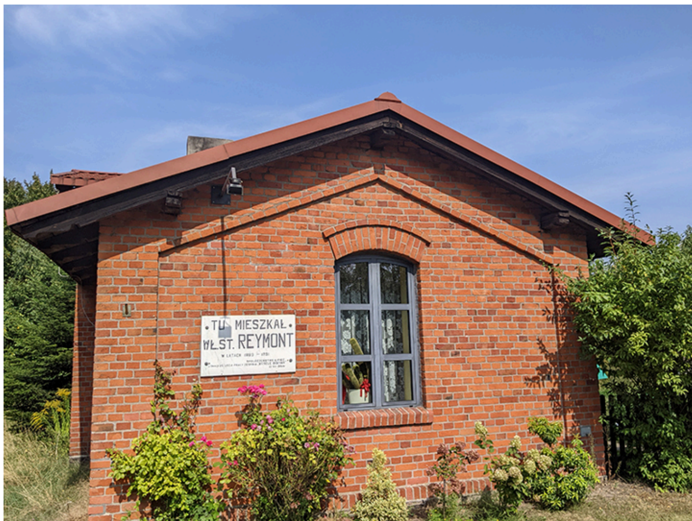
Dom Władysława Reymonta w Lipcach Reymontowskich. To tu pisarz umieścił akcję „Chłopów”. Lipce (teraz Lipce Reymontowskie) były tylko inspiracją, nie są dokładnie odtworzone w powieści