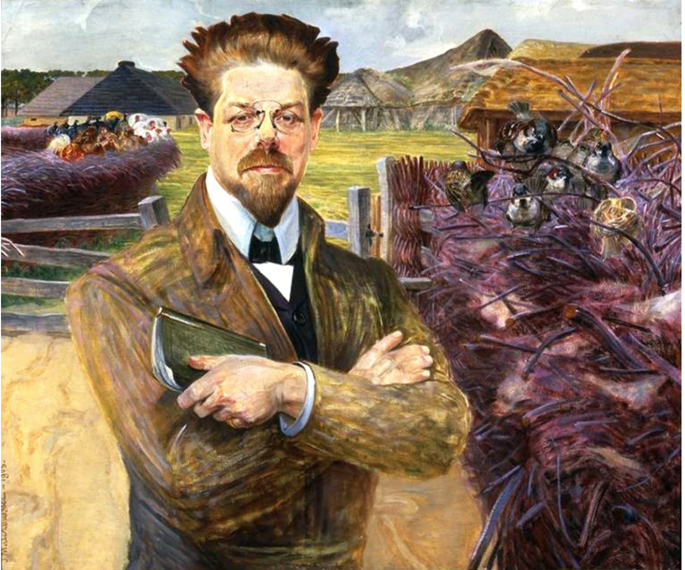
Jacek Malczewski, Portret Władysława Reymonta (1905)