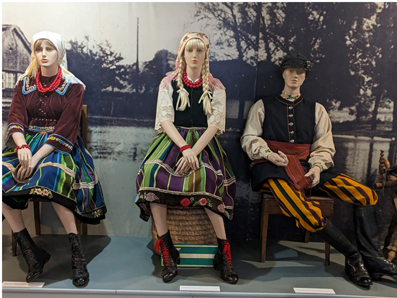
Muzeum im. Władysława Reymonta w Lipcach Reymontowskich