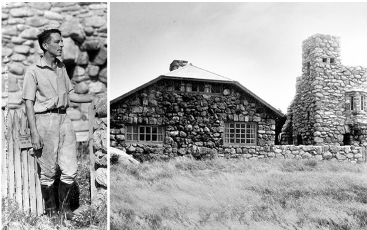
Robinson Jeffers i jego dom w Carmel na wybrzeżu Kalifornii.

pełne węgla płonących, z krwią i kośćmi ludzkimi zmieszane, a rozżarzone krańce nieba, zasnuते dymem, przybierają szarą barwę karku osła.