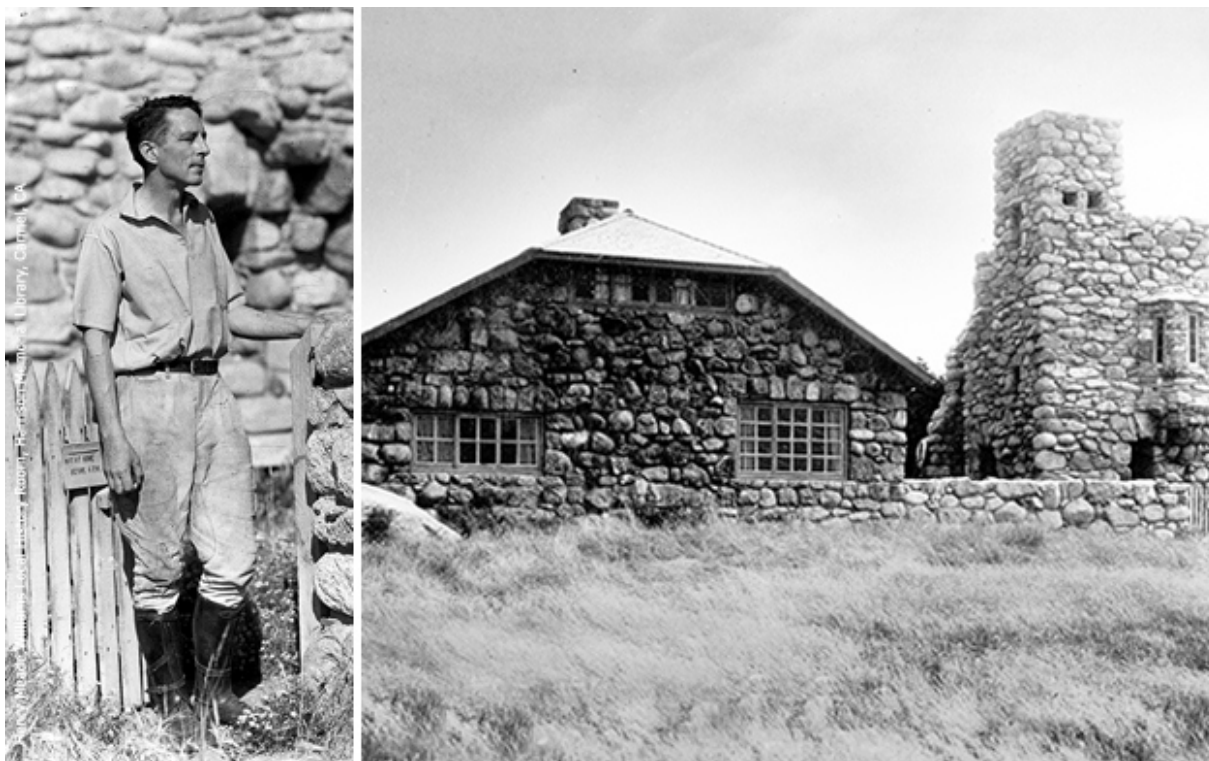
Robinson Jeffers i jego dom w Carmel na wybrzeżu Kalifornii.

pełne węgla płonących, z krwią i kośćmi ludzkimi zmieszane, a rozżarzone krańce nieba, zasnuते dymem, przybierają szarą barwę karku osła.