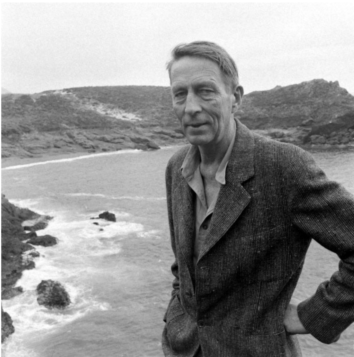
Robinson Jeffers

Podziwiałem piękno wtedy gdy byłem człowiekiem, teraz jestem częścią piękna. Wędruję w powietrzu będąc, ogólnie, gazem i wiatrem i tym co krąży w oceanie. Dotykam ciebie i Azji w tej samej chwili; zanurzam rękę we wschodzie słońca i w iskrzeniu trawy. Zostawiłem światło aby się sączyło z grobu do ziemi na dowód swojej miłości.