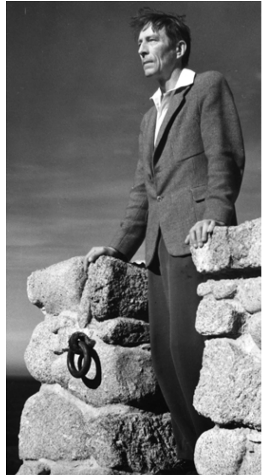
Robinson Jeffers, 1940 r.

Nim ptaki znowu pojawią się nad skałami Point Lobos, nad Oceanem Spokojnym, niech trwa ta cisza wokół nas, rozkładających ręce od Aleutów po Ziemię Ognistą. Ramiona człowieka, rozciągnięte szeroko, niech obejmują tę ciszę, tę przestrzeń nad Oceanem. I całą Ziemię. Od brzegu Aleutów po brzegi Japonii.