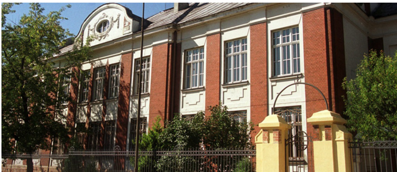
Łódzka Szkoła Filmowa

Chętnie uczęszczałam na tę uczelnię o renomowanej światowej sławie, którą ukończyli tacy filmowcy jak Andrzej Wajda czy Roman Polański. Uczono nas niekonwencjonalnego spojrzenia na świat, spotykaliśmy ludzi filmu o międzynarodowej sławie i zanurzaliśmy się w nowoczesnej polskiej kulturze. Studia w Łodzi dawały też rzadką okazję, aby móc pracować z profesjonalnym zespołem podczas kręcenia filmów, z zawodowymi dźwiękowcami, edytorami, operatorami, oświetleniowcami. Uwielbiałam casting i współpracę z aktorami. Zaintrygowało mnie kierowanie kamerą, które stało się nowym doświadczeniem w mojej filmowej edukacji. Poza tym oglądanie filmów stworzonych przez moich rówieśników z całego świata było fascynujące.