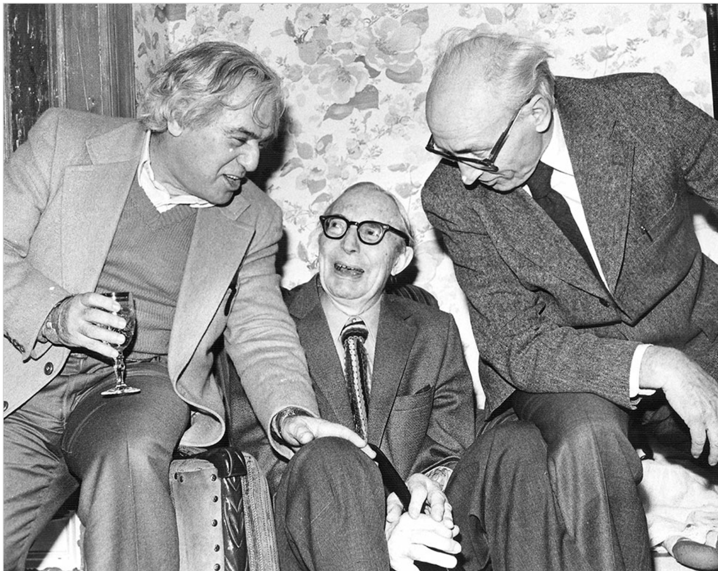
Poeci montrealscy: od lewej Irving Layton (1912-2006), Frank R. Scott (1899-1985) i Louis Dudek (1918-2001).

Wspominał, że już jako siedemnastoletni chłopak zauważył nieobecność literatury, a przynajmniej jej niską wartość. To kazało mu o nią walczyć, tak że w konsekwencji całe późniejsze życie profesora, krytyka i pisarza temu zagadnieniu poświęcił, aby przywrócić jej prymat i godne miejsce w cywilizacji.