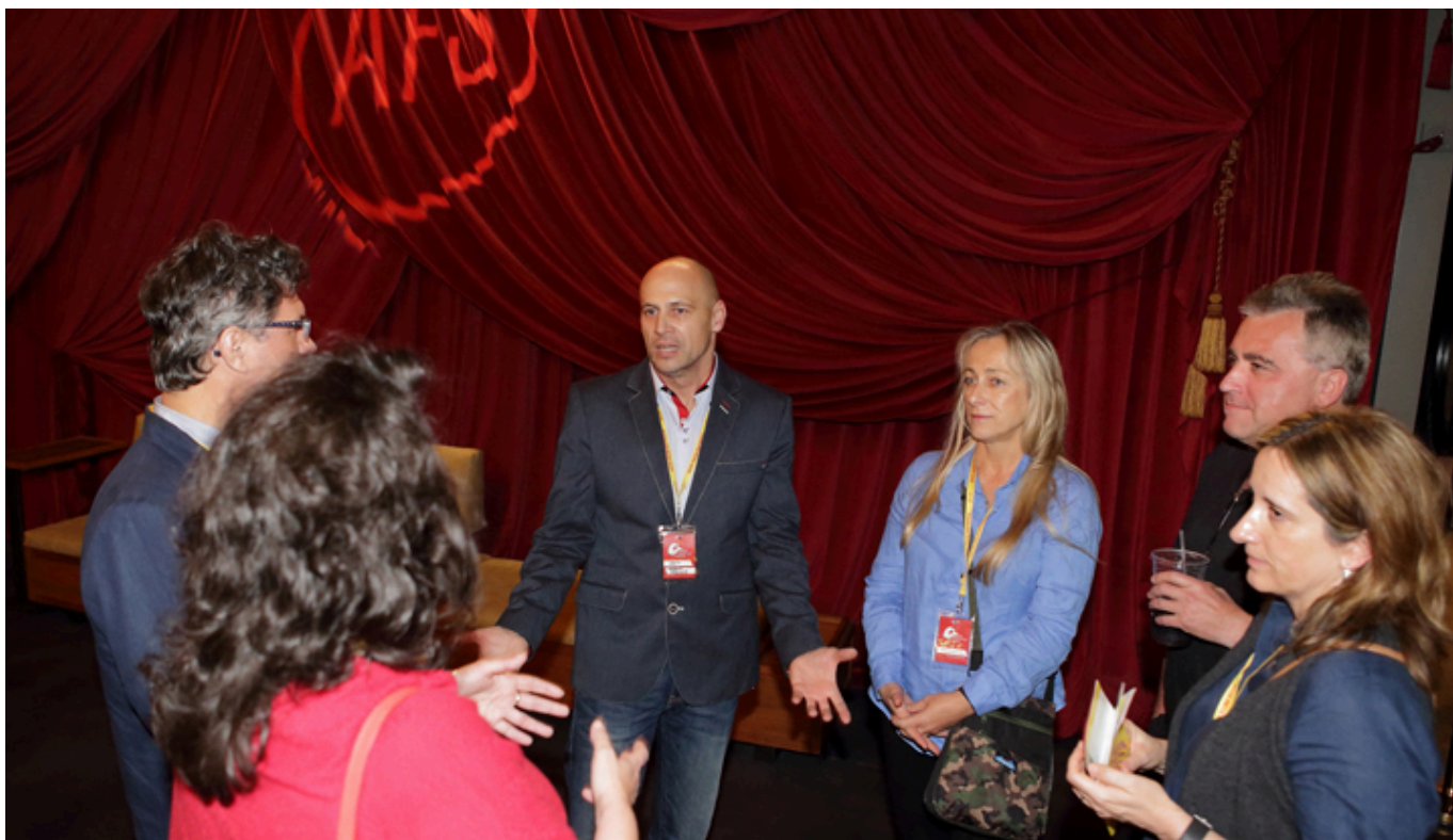
Rozmowa z Robertem Wrzoskiem po projekcji filmu „Wyklęty”, fot. Marek Proga.