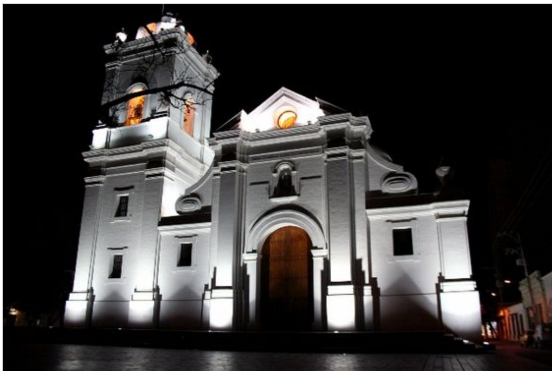
Santa Marta. Kolumbia

km na północ od miasta. Wodospad rozczarował nas zupełnie, bo choć spada w głębokim kanionie z wysokości 145 metrów, okazał się wówczas dość wąską i na dodatek mocno cuchnącą strużką wody. Kopalnia soli imponuje wielkimi rozmiarami i wykutą w jej wnętrzu katedrą z godnymi uwagi ołtarzami rzeźbionymi w solnej skale. Kolumbijczycy podkreślają z dumą, że to jedyna taka katedra na świecie. Gdy próbowałem zaprzeczyć wymieniając Wieliczkę, przewodnik, korpulentny starszy pan, uciął krótko: „No tak, ale Wieliczka jest o wiele mniejsza”. I tu musiałem przyznać mu rację.