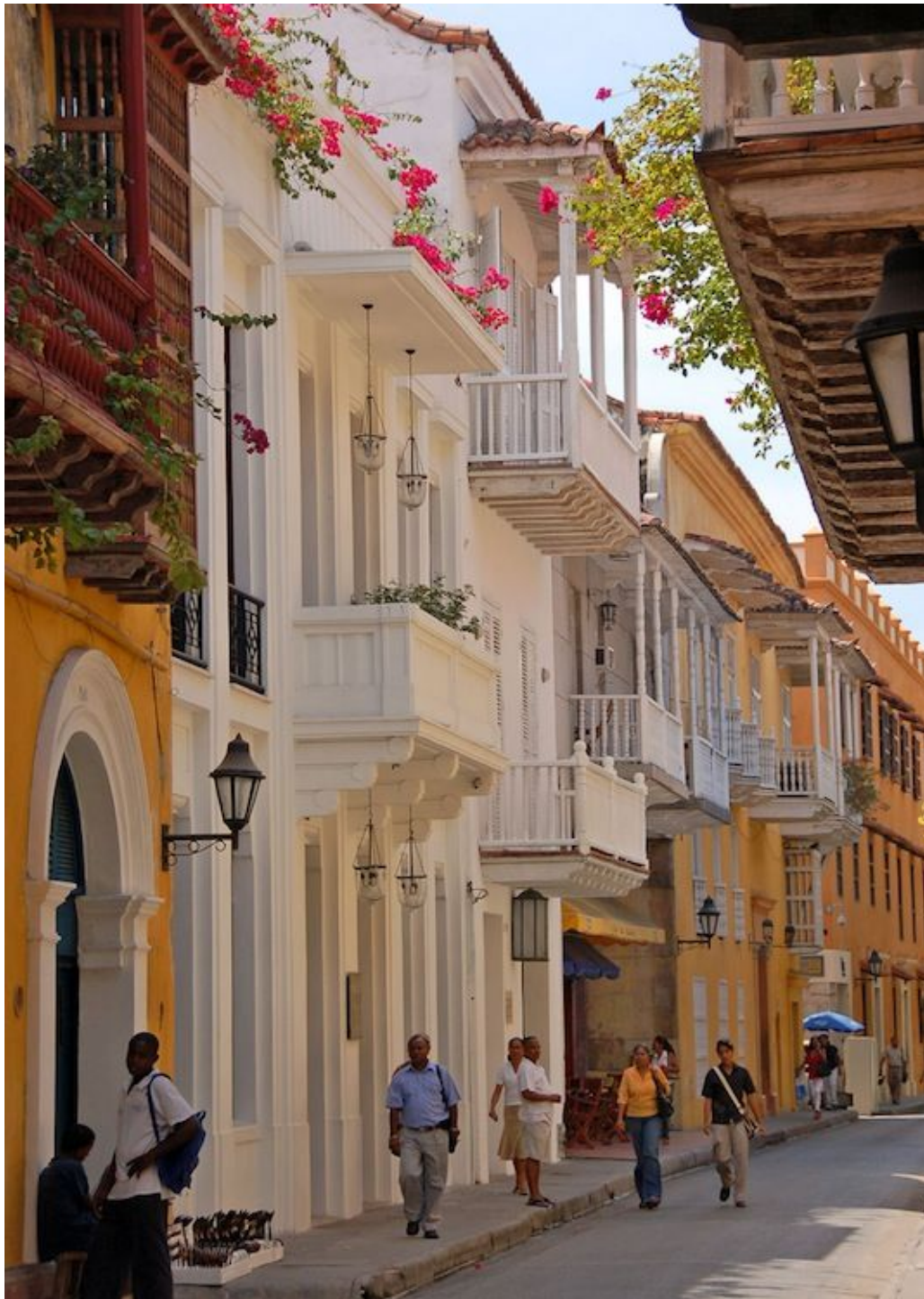
Cartagena de Indias

Lot z Barranquilla do Cartagena de Indias trwa pół godziny i ani się obejrzelśmy, jak znaleźliśmy się w tym arcyciekawym kolonialnym mieście otoczonym siedemnastowiecznymi murami obronnymi, bastionami i systemem fortec, z których najpotężniejsza, przypominająca jakąś wielką piramidę, zwie się Castillo de San Felipe de Barajas (Zamek św. Filipa z Barajas) na cześć królów hiszpańskich o tym