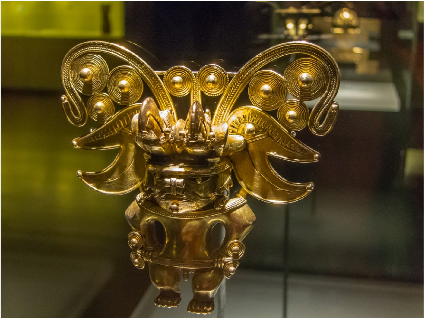
Museo del Oro, Bogota