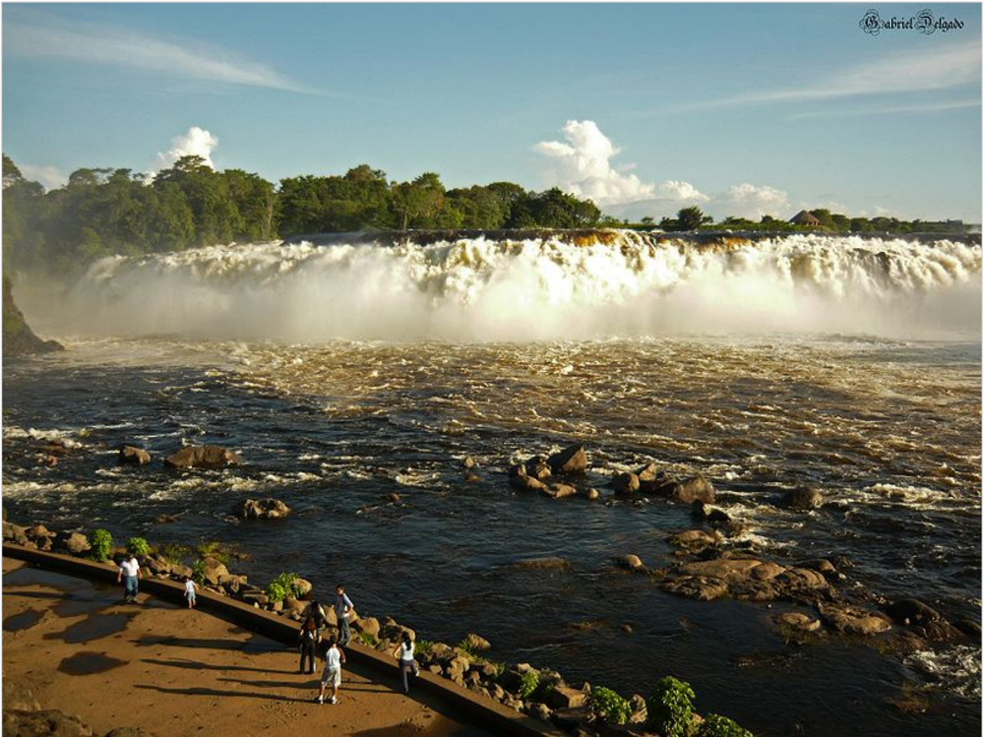
Park La Llovizna

Znacznie bardziej interesowały mnie jednak ruiny kościoła Matki Boskiej Niepokalanego Poczęcia i klasztor Kapucynów Katalońskich, z 1724 roku, w pobliżu miasta San Félix, a nade wszystko nagrania wywiadów z byłymi zbieraczami kauczuku w puszczach gujańskich. Boom kauczukowy rozkwitł w latach 20-tych XX wieku właśnie na tych terenach. W tutejszych lasach rośnie drzewo purguo ( Mimusops Balata ), którego sok zwany balatá służył do produkcji gumy. Pracę zbieraczy balatá opisuje