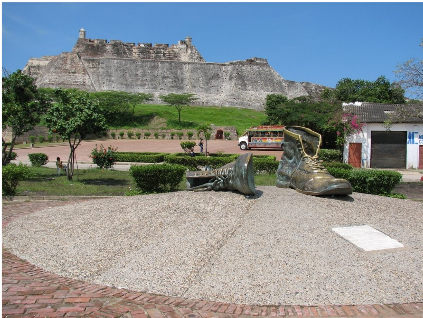
Cartagena, Forteca Św. Filipa z Barajas, pomnik Starych Butów.

Cartagena była ostatnim etapem naszej podróży po Kolumbii. Gdy wróciliśmy po tygodniu do Caracas, przywitał nas w domu ostry zapach doszczętnie zeschniętych kwiatów, w niczym nie przypominających tych wspaniałych bukietów wręczonych nam po ślubie. 2 października 1972 roku zacząłem moją pracę w Wyższym Instytucie Pedagogicznym. Prowadziłem seminarium z leksykografii hispanoamerykańskiej w Zakładzie Języka Hiszpańskiego, Literatury i Łaciny. Moim bezpośrednim szefem