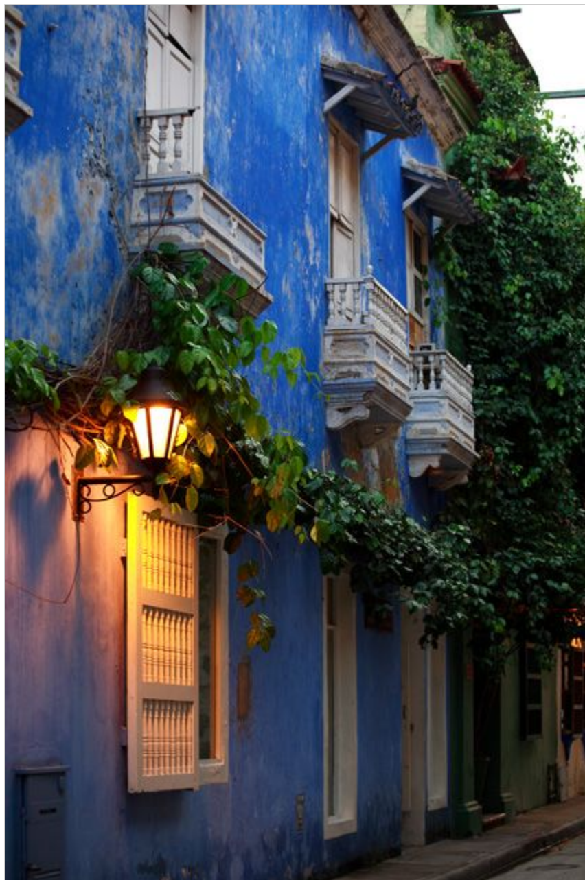
Cartagena de Indias

Cartagenę zapamiętałem jako jedno z najbardziej upalnych, może wręcz najbardziej upalne miejsce, w jakim zdarzyło mi się przebywać kiedykolwiek. Zaduch był nieziemski, a przecież miasto leży nad samym morzem. Cóż z tego! Morze z murów obronnych wyglądało jak szeroko rozlana zupa niemal buchająca