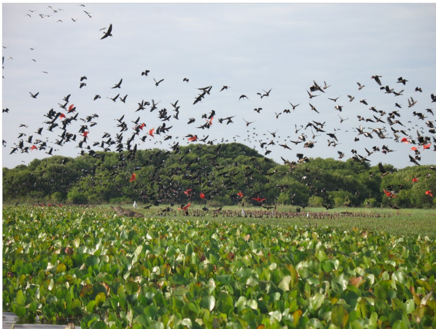
Los Llanos, Venezuela

metrów obok. Wielkie wrażenie robi przejazd przez tak zwaną „dżunglę zamgloną” ( selva nebulosa lub nublada ) w górach, na obszarze Parku Narodowego Rancho Grande imienia wielkiego szwajcarskiego botanika Henri Pittiera, który jako pierwszy sklasyfikował poszczególne gatunki flory wenezuelskiej. Mgła wisi nad tą dżunglą prawie stale. Wyłaniające się spoza tej mlecznej zasłony potężne pnie i konary drzew, wysokie paprocie i inne zarośla tworzą wyjątkowo baśniową i tajemniczą dekorację, na którą nie mogłem się napatrzeć!