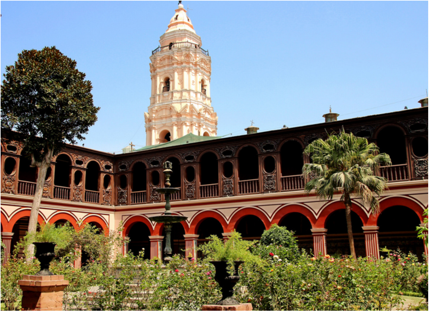
Lima. Klasztor św. Dominika.