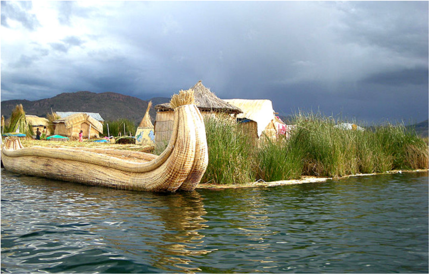
Wyspa Indian Urów na jeziorze Titicaca.