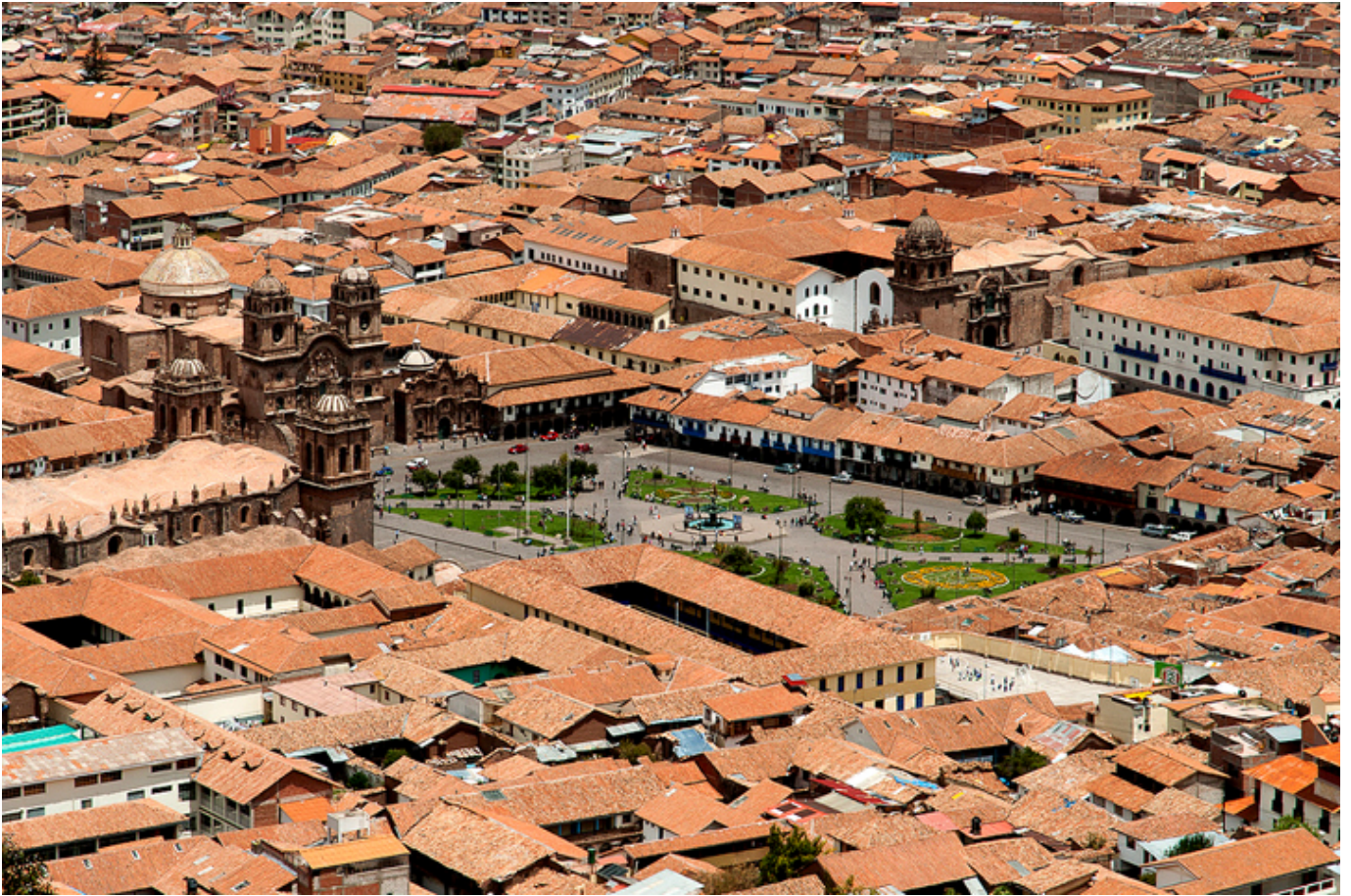
Cuzco. Plac Broni