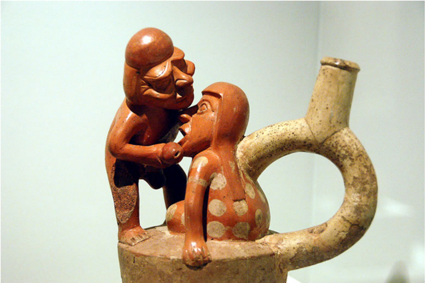
Lima. Muzeum rzeźb erotycznych. Rafaela Larco Herrery.