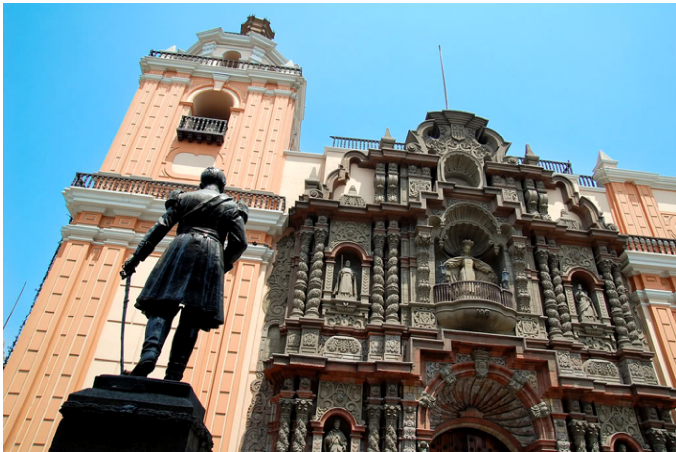
Lima. Kościół Matki Boskiej Łaskawej.