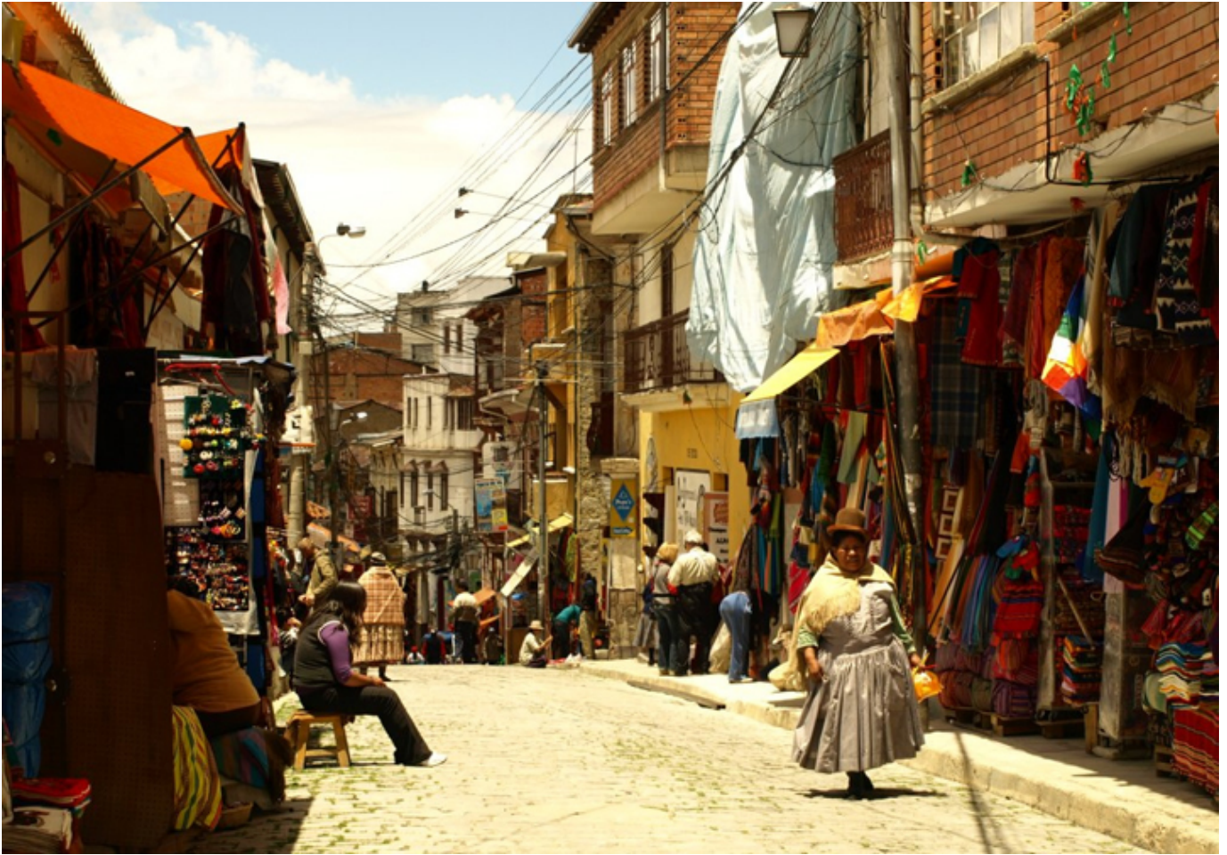
La Paz. Targ Czarowników.