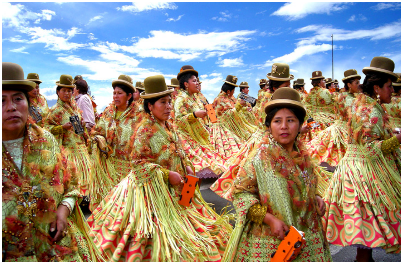
Morenada w La Paz.