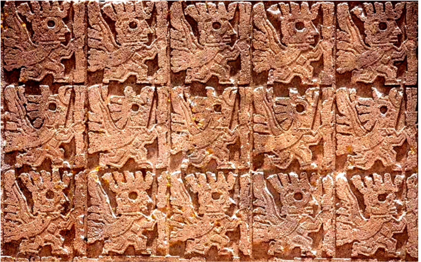
Tiahuanaco. Płaskorzeźby na Bramie Słońca.