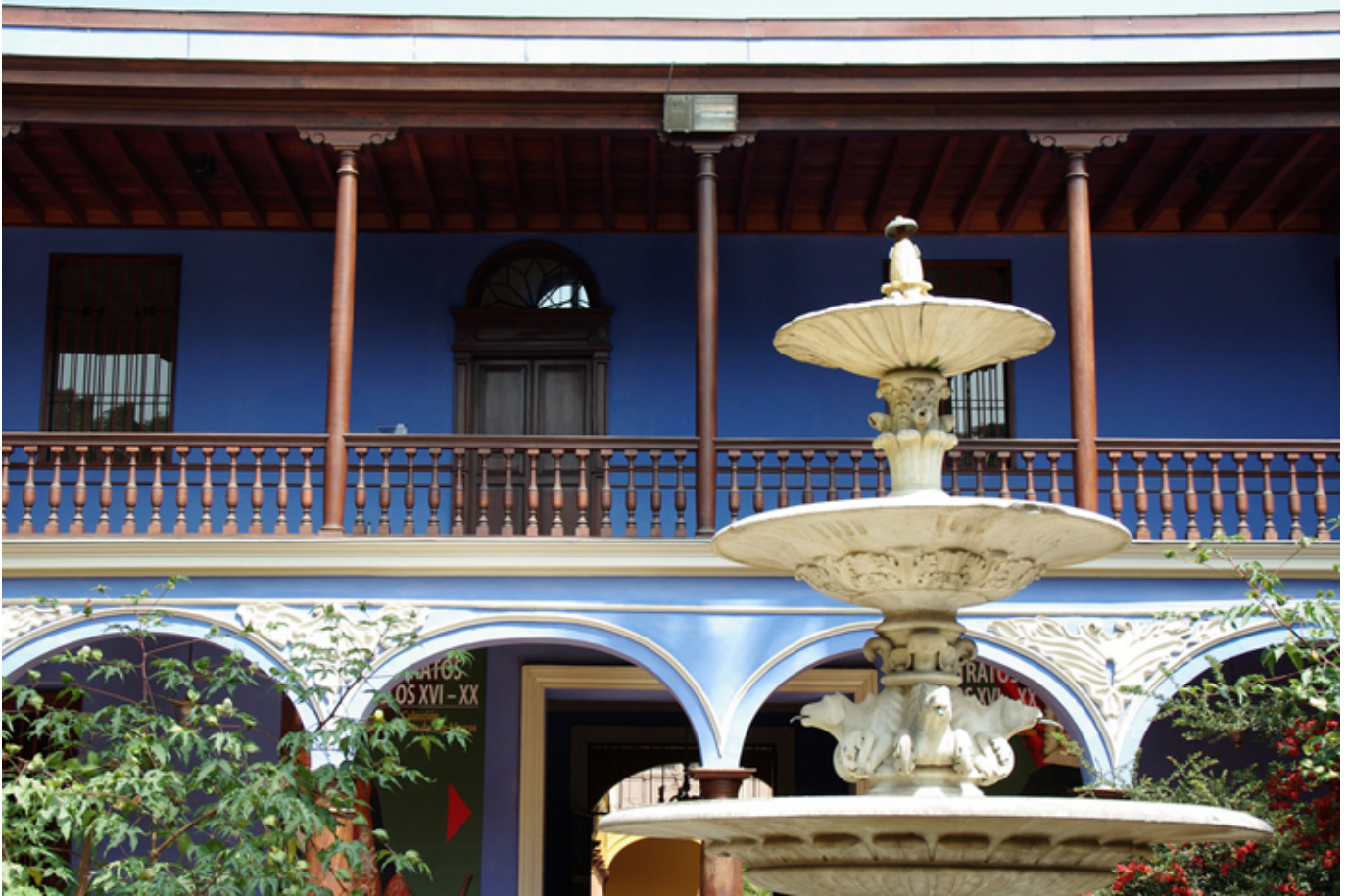
Lima. Uniwersytet św. Marka.