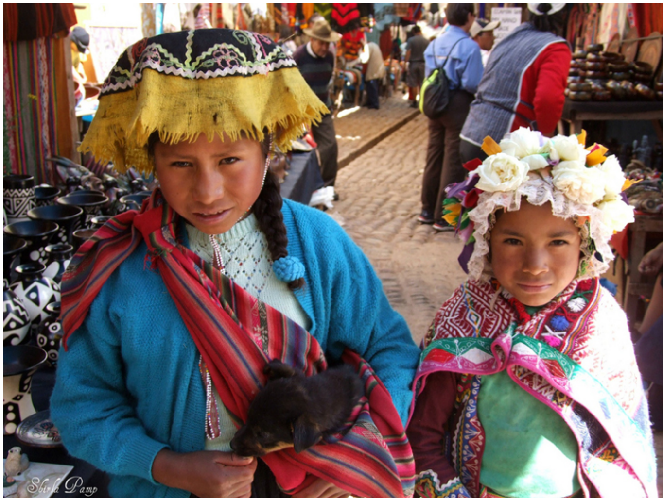
Indianeczki na targu w Pisac.

wzniesieniu wspaniałe ruiny inkaskie z zegarem słonecznym. Pojechałem tam razem z Indianami odkrytą ciężarówką. Wokół, na stokach nad Urubambą , nadal są uprawiane inkaskie tarasy.