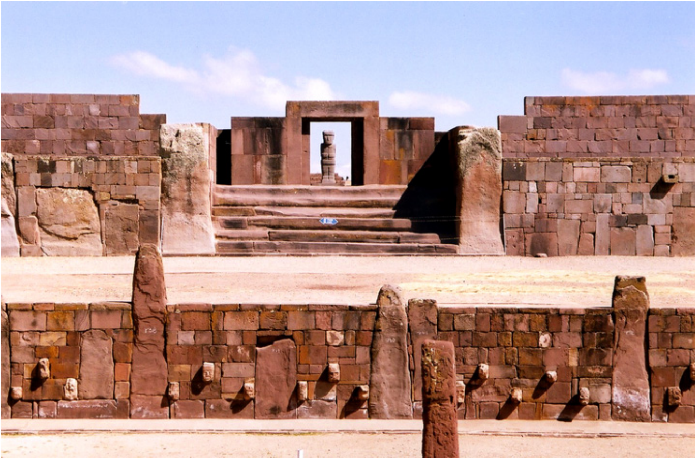
Tiahuanaco. Świątynia Kalasasaya i Świątynia Masek.