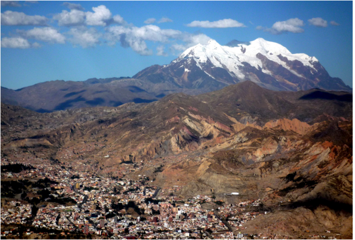
Illimani (6.438 m) i La Paz.