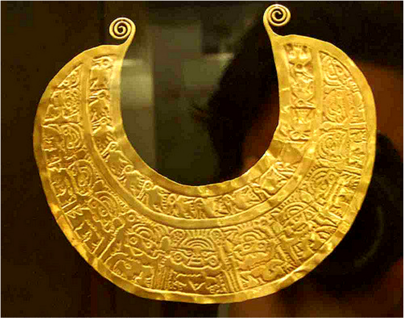
Lima. Naszyjnik ze zotej blachy. Muzeum Złota.