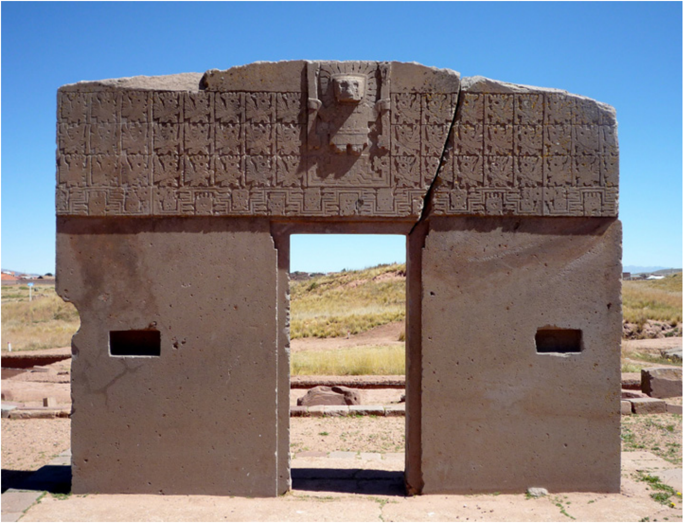
Tiahuanaco. Brama Słońca,