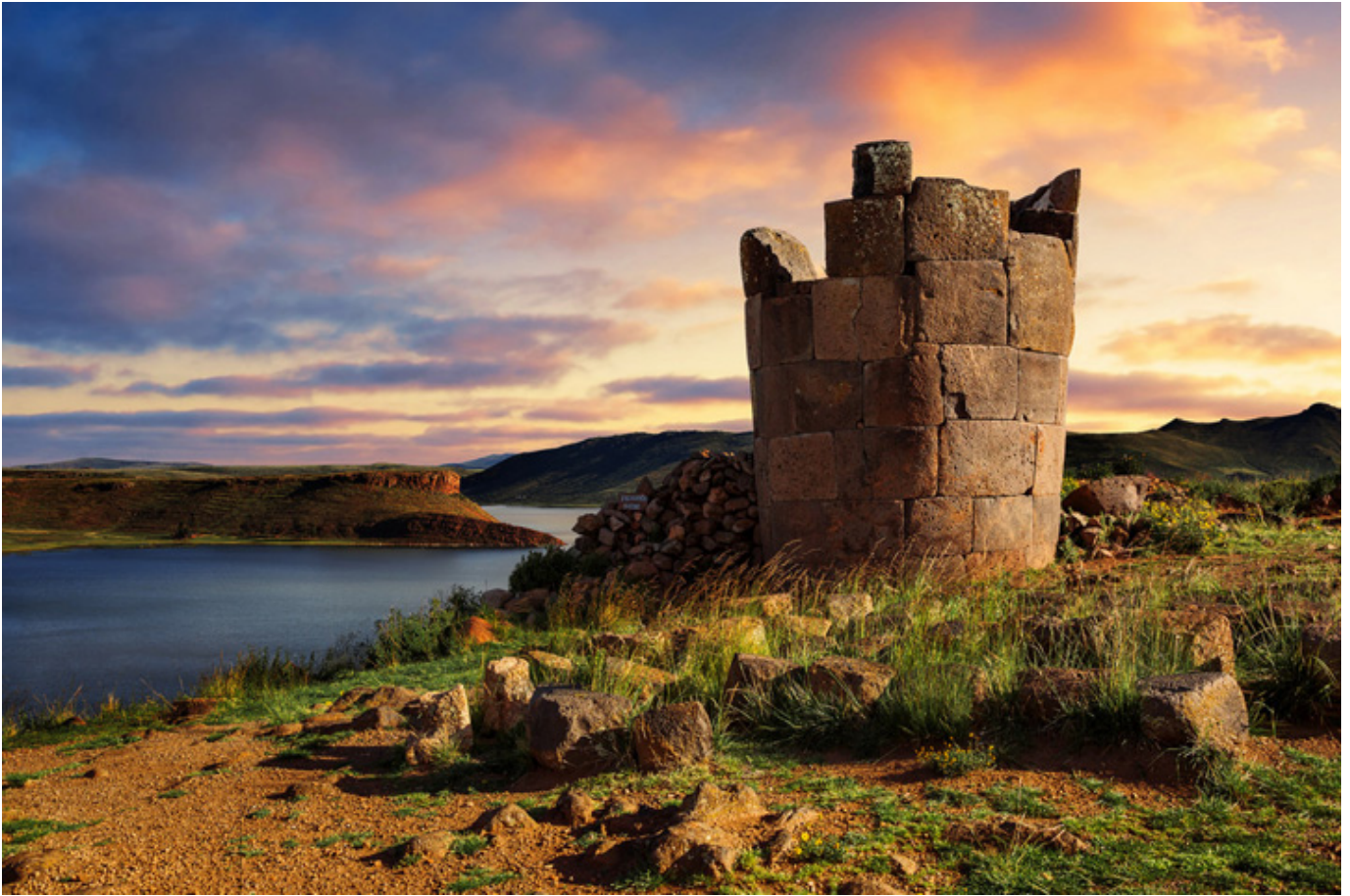
Preinkaskie grobowce Chullpas de Sillustani.