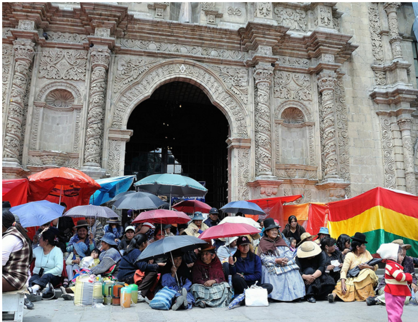
La Paz. Przed wejściem do kościoła św. Franciszka.