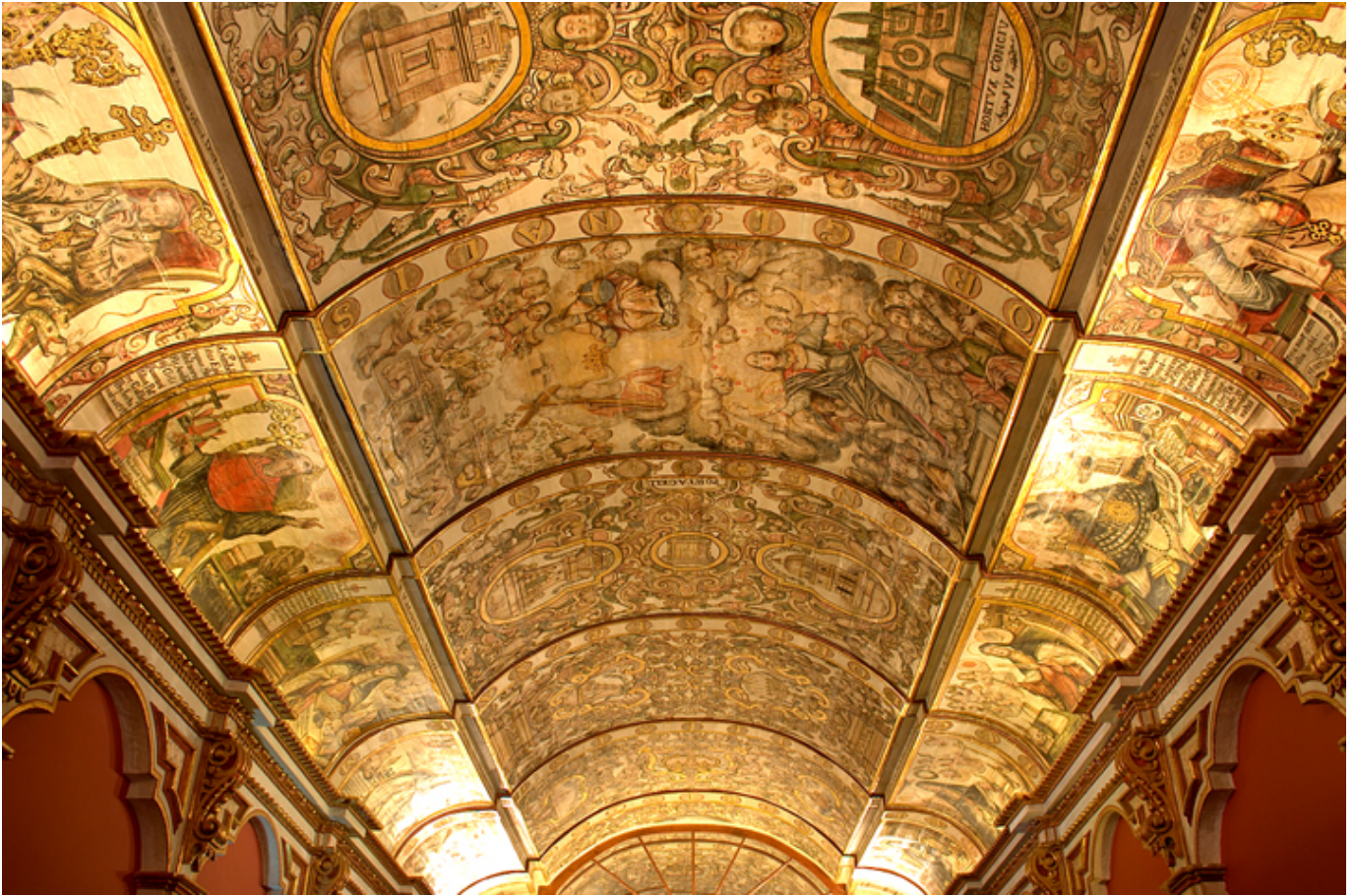
Lima. Wnętrze Uniwersytetu św. Marka, fot. Juan Manuel Parra.