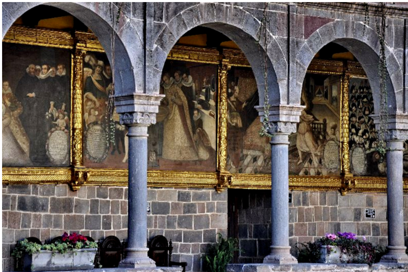
Cuzco. Wirydarz klasztoru św. Dominika.