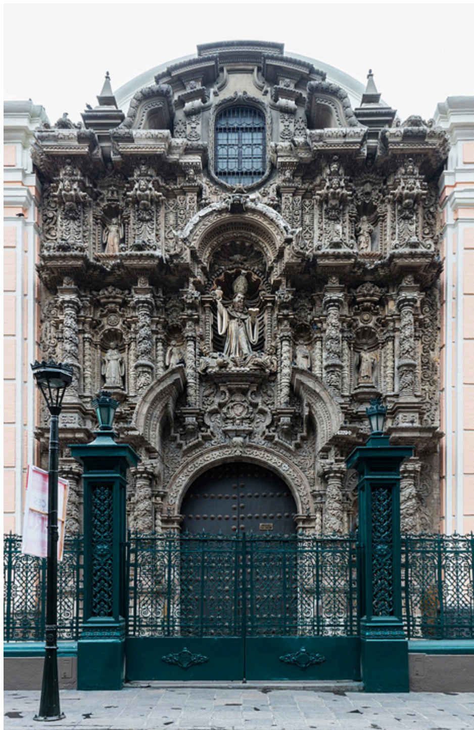
Lima. Fasada kościoła św. Augustyna.