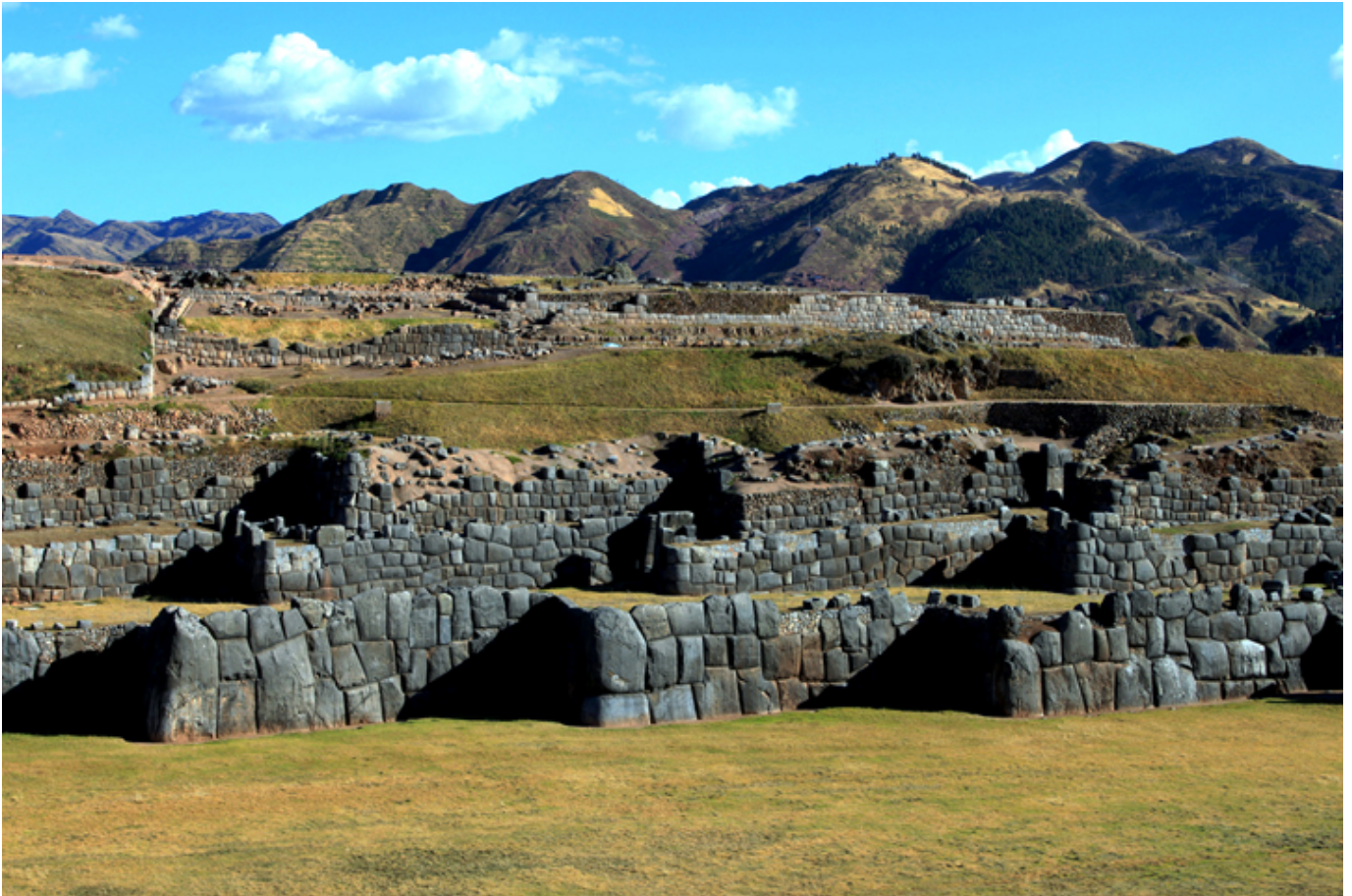
Cuzco. Mury twierdzy Sacsahuamán