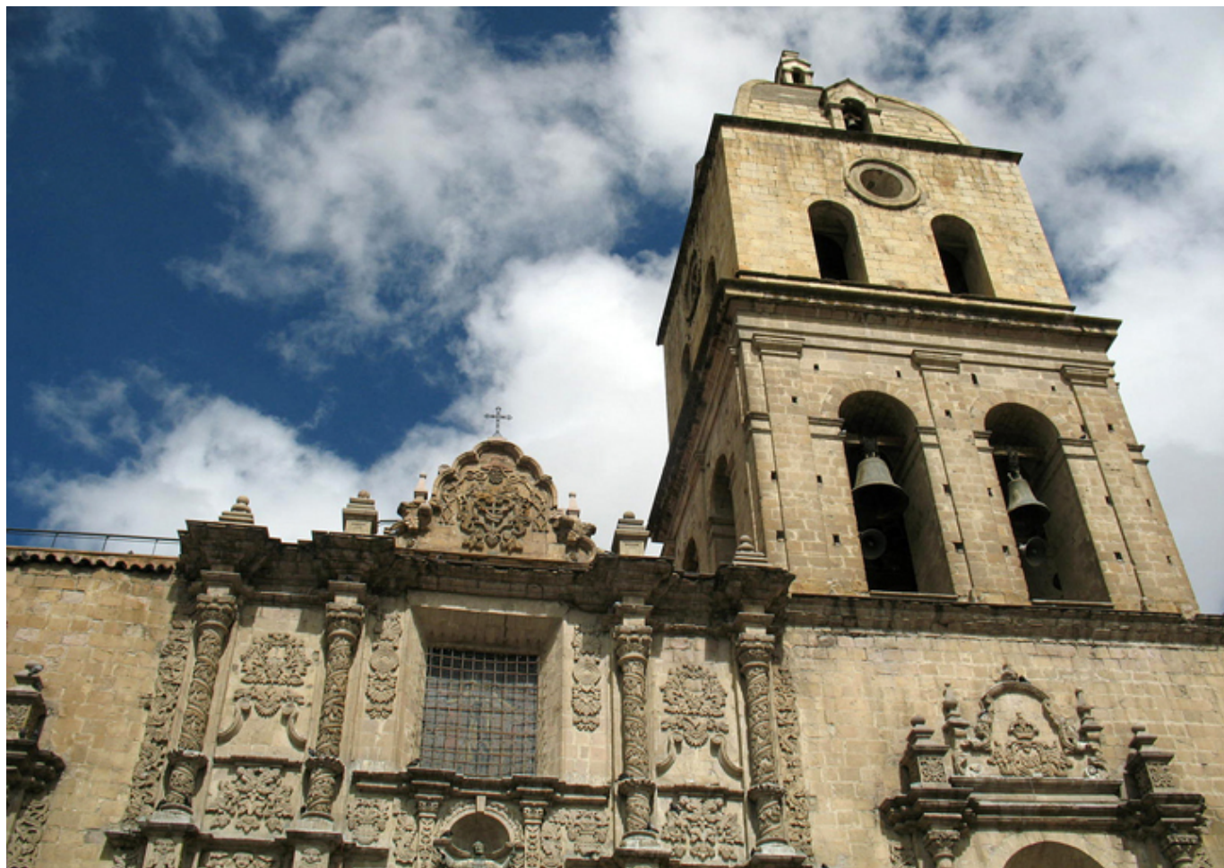
La Paz. Kościół św. Franciszka.