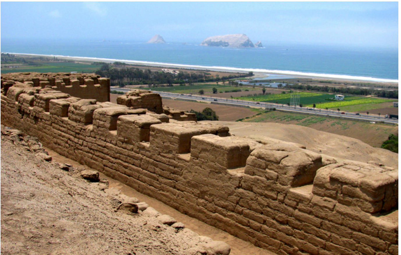
Pachacamac. Ruiny nad Pacyfikiem.