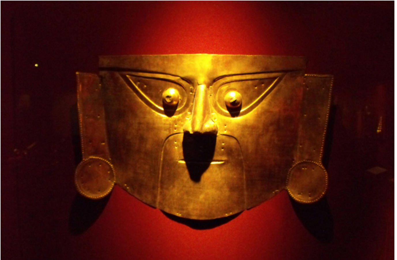
Lima. Złota maska w Muzeum Złota.