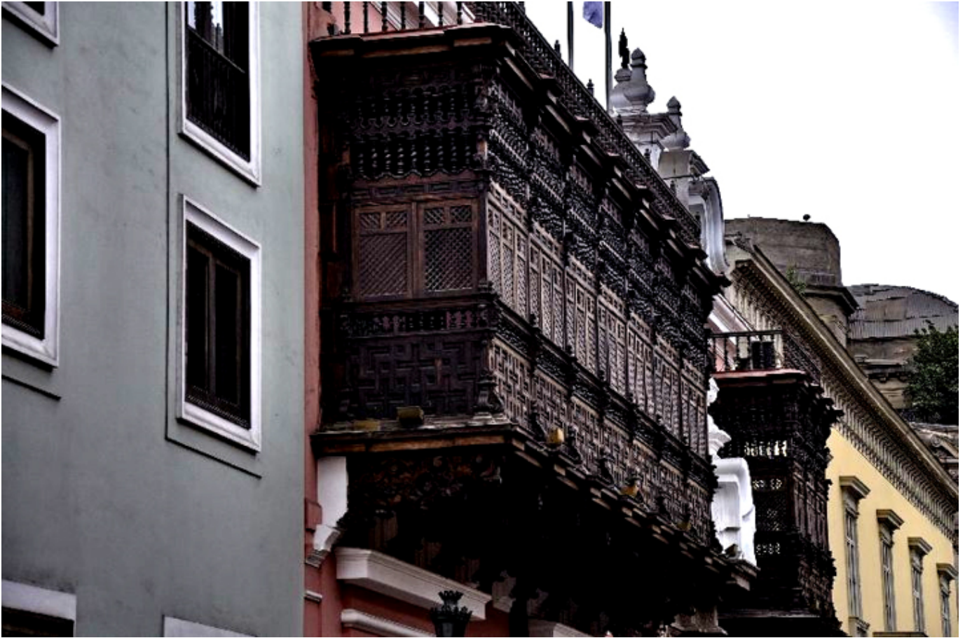
Lima. Pałac Torre Tagle.