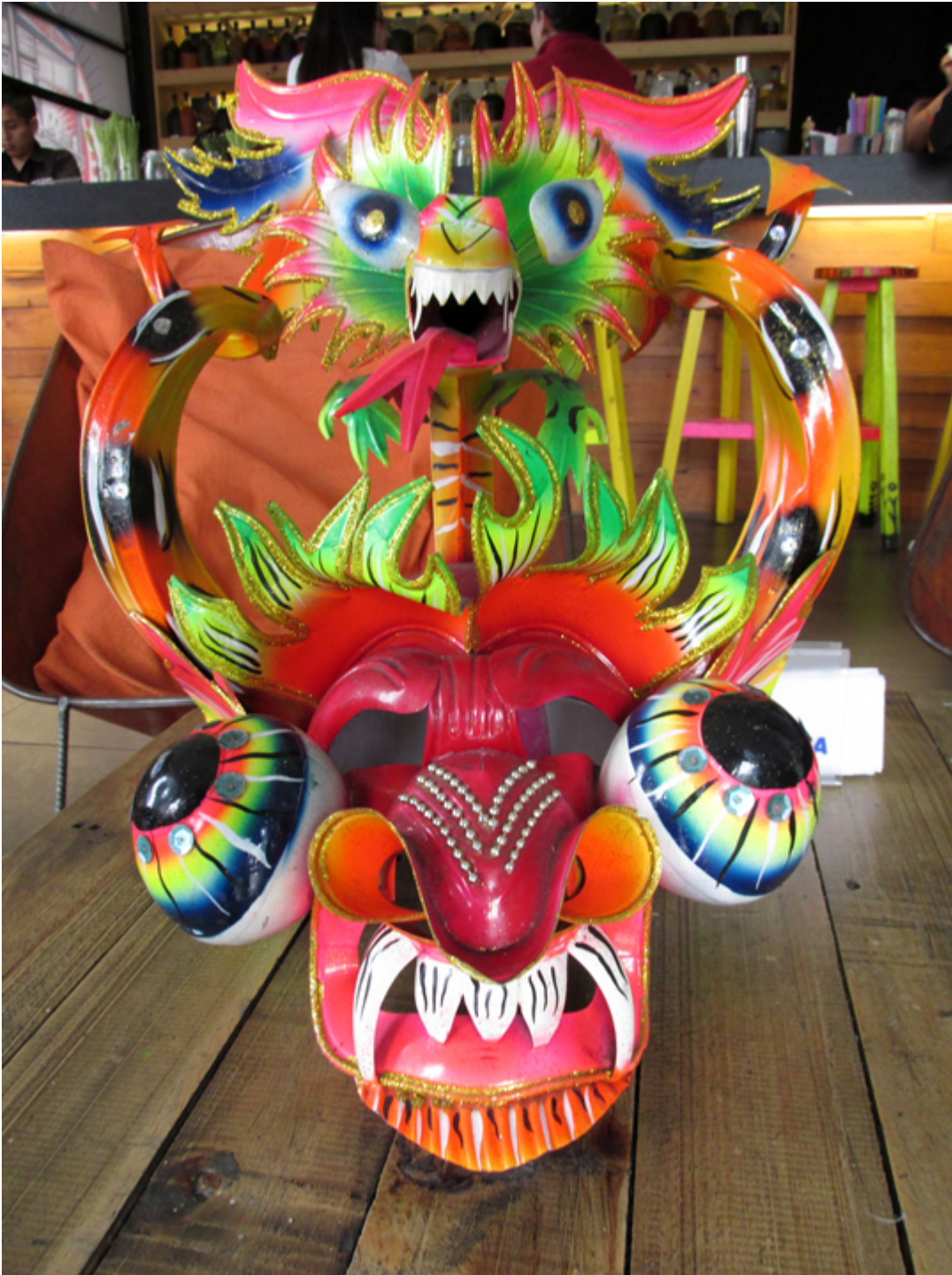
Czerwona maska do diablady.