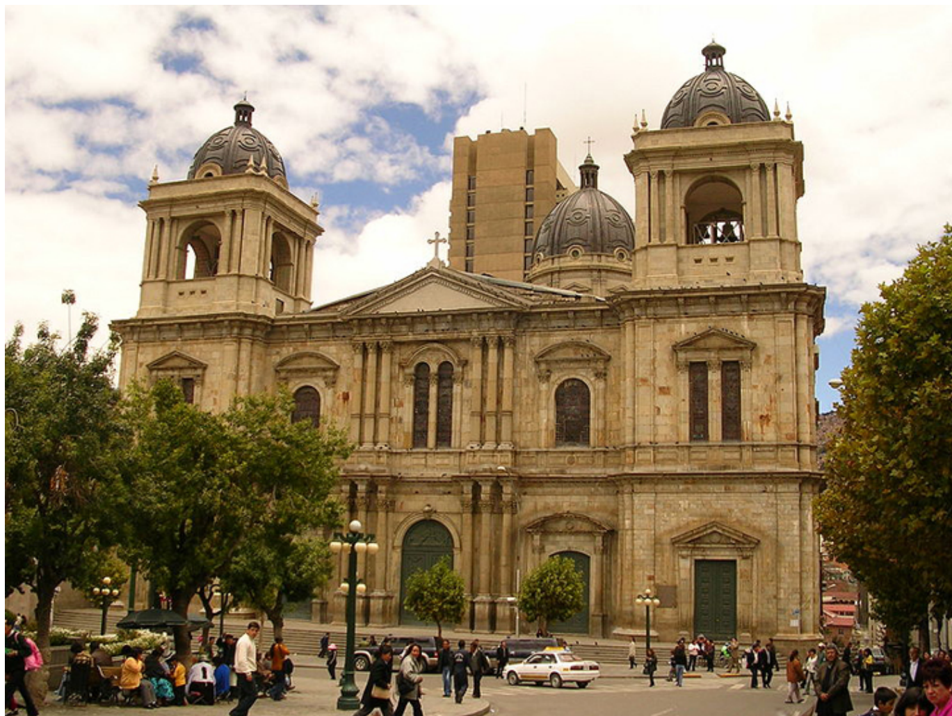
Katedra Metropolitalna w La Paz.