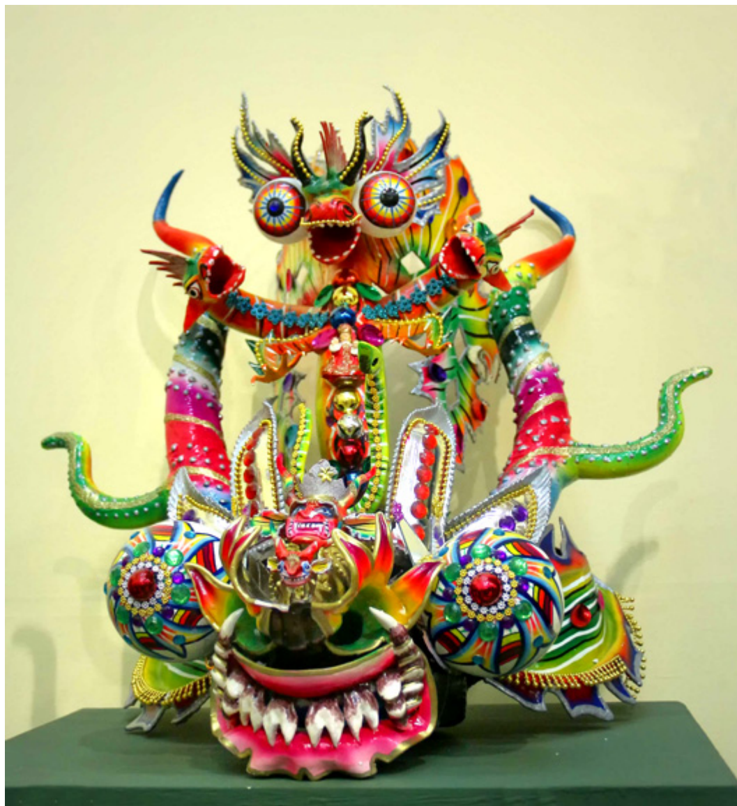
Zielona maska do diablady.