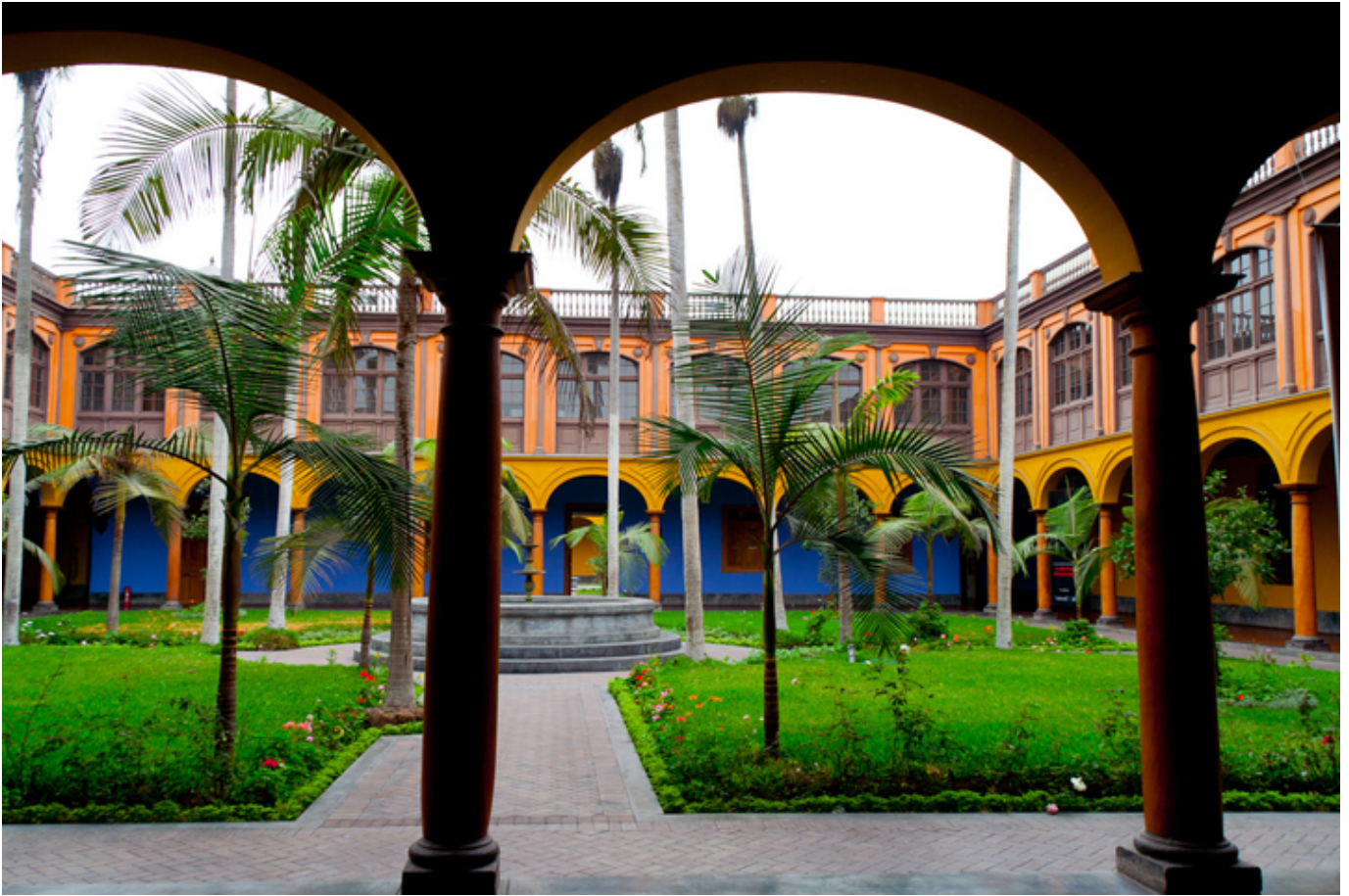
Lima. Działanie Wydziału Filologii.