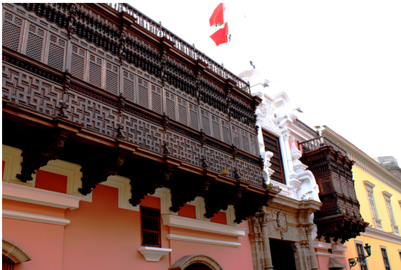
Lima. Balkony na fasadzie Pałacu Torre Tagle.