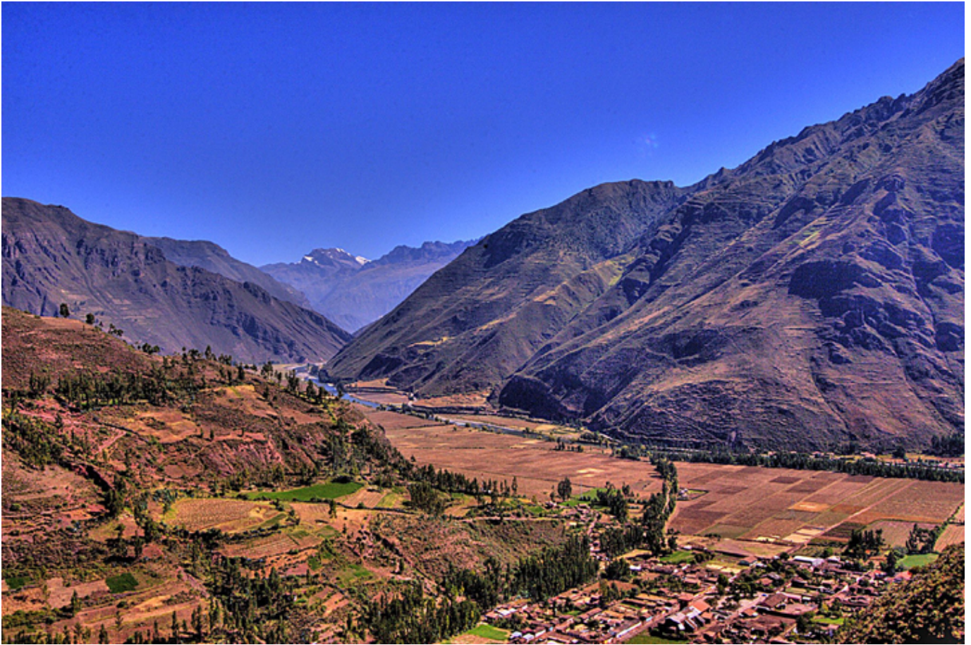
Dolina rzeki Urubamby - Święta Dolina Inków,