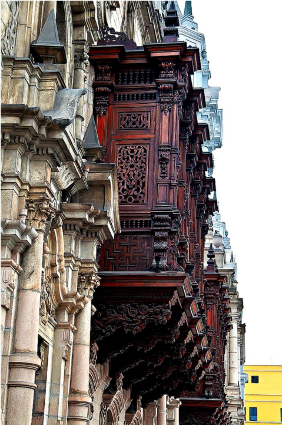
Lima. Balkony na Placu Broni.