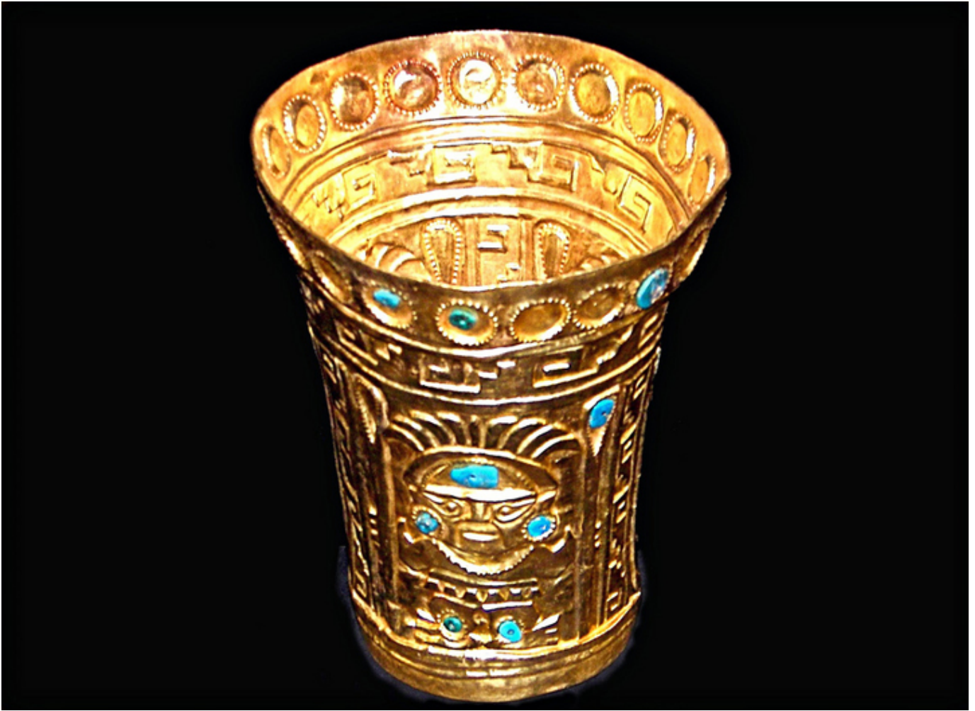
Lima. Kero - naczynie ceremonialne w Muzeum Złota.