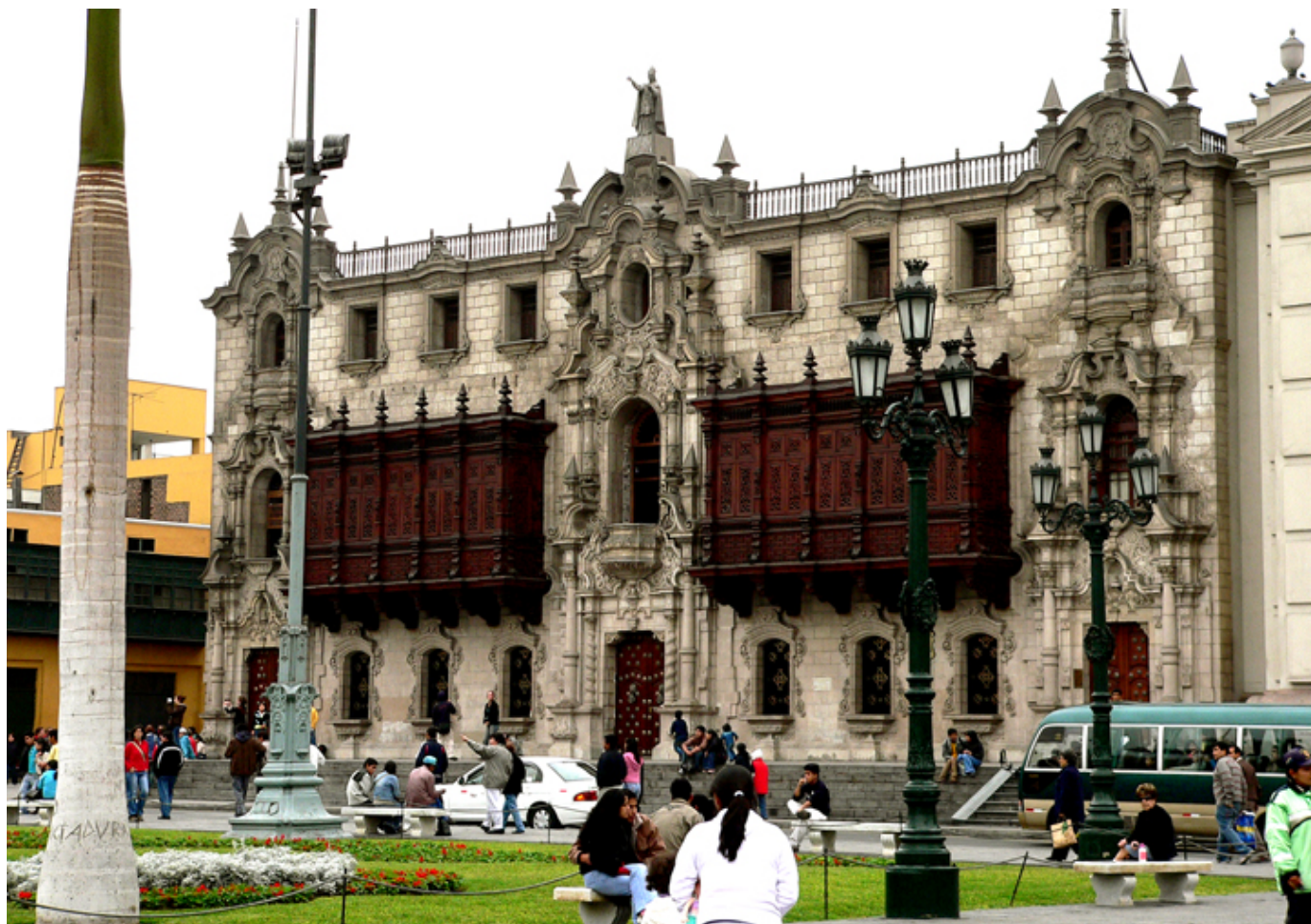
Lima. Pałac Arcybiskupi.