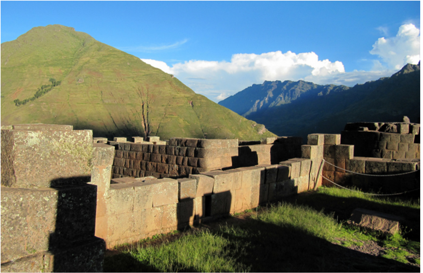
Inkaskie ruiny nad miasteczkiem Písac.