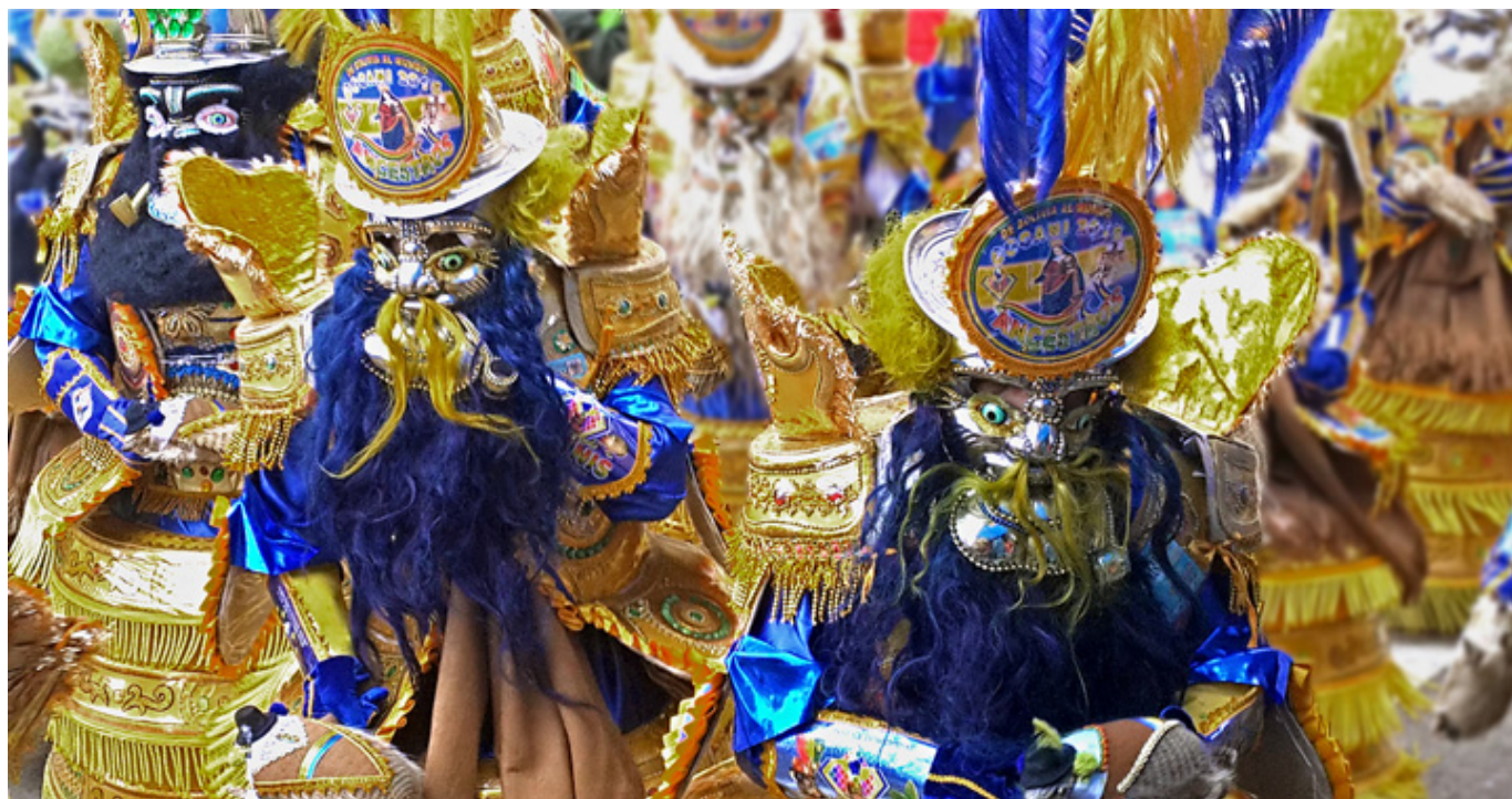
Morenada w La Paz, fot. Carlos E. Machuca.

Poprzednie części wspomnień z podróży Zygmunta Wojskiego: