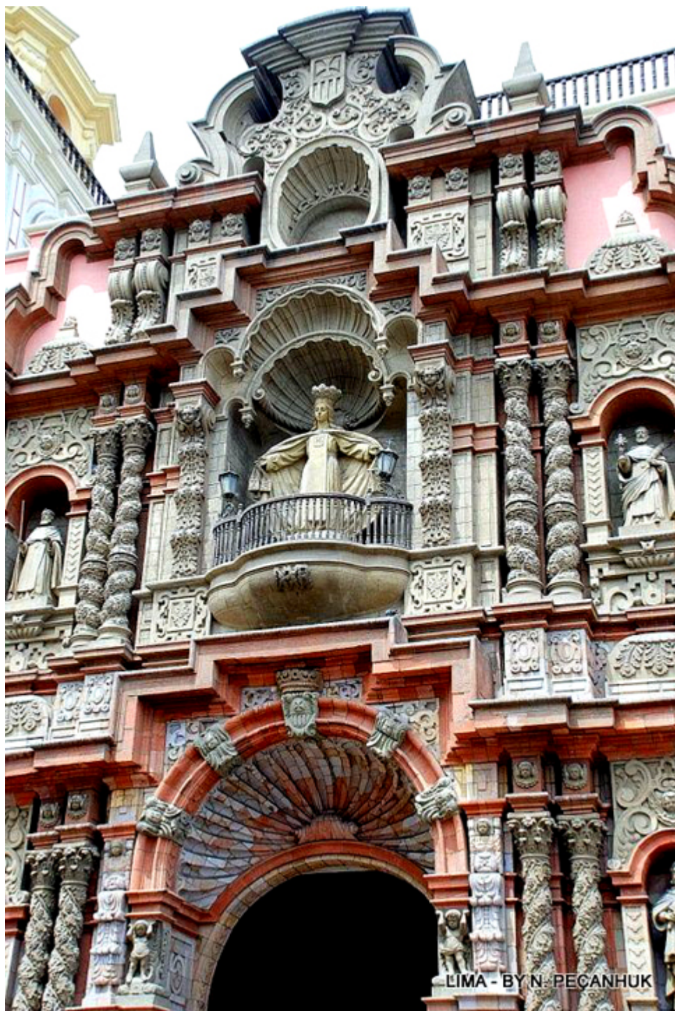
Lima. Fronton kościoła Matki Boskiej Łaskawej.