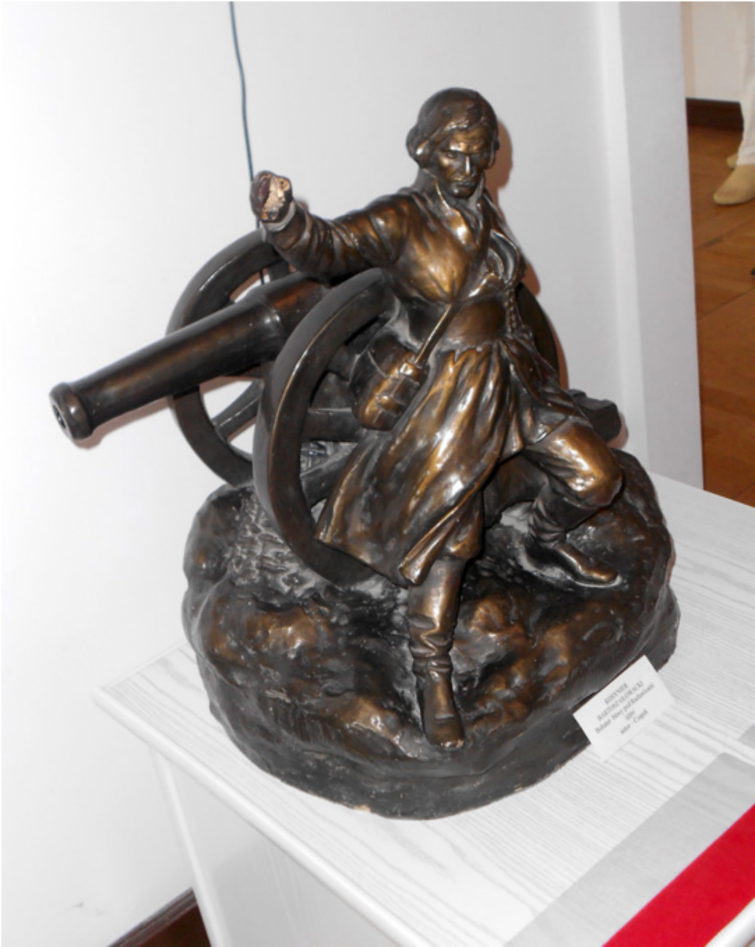
1800-1808 BUSTO ARSIZIO Busto bronze per monumento 1808 anni - Europa