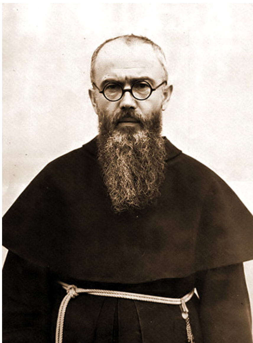
Ojciec Maksymilian Kolbe, 1936 r.

angielsku w amerykańskim Buffalo. We wszystkich tych sztukach epilogiem jest „Męka świętego Maksymiliana”, która może też funkcjonować samodzielnie. Była ona odczytywana przez trzech lektorów - tak jak czyta się Mękę Jezusa Chrystusa w Wielkim Tygodniu - w kościołach na terenie Polski, Kanadzie, Stanach Zjednoczonych. Pragnąłem nadal uczyć się od świętego, być jakoś blisko niego. Z tego pragnienia powstały otwierające ten tom - „Pieśni świętego Maksymiliana”. I tak jak ksiądz mówi - stał się on moim „towarzyszem podróży” w ostatnich latach. Jego „Regulamin życia” jest zarówno drogowskazem, jak też przypomnieniem, jak wiele mi brakuje do sprostania jego wymaganiom.