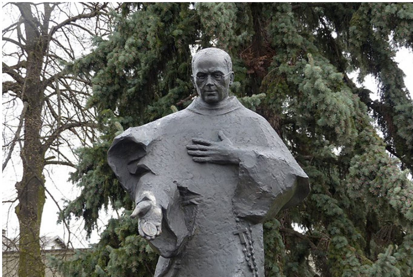
Pomnik św. Maksymiliana Kolbe w Niepokalanowie