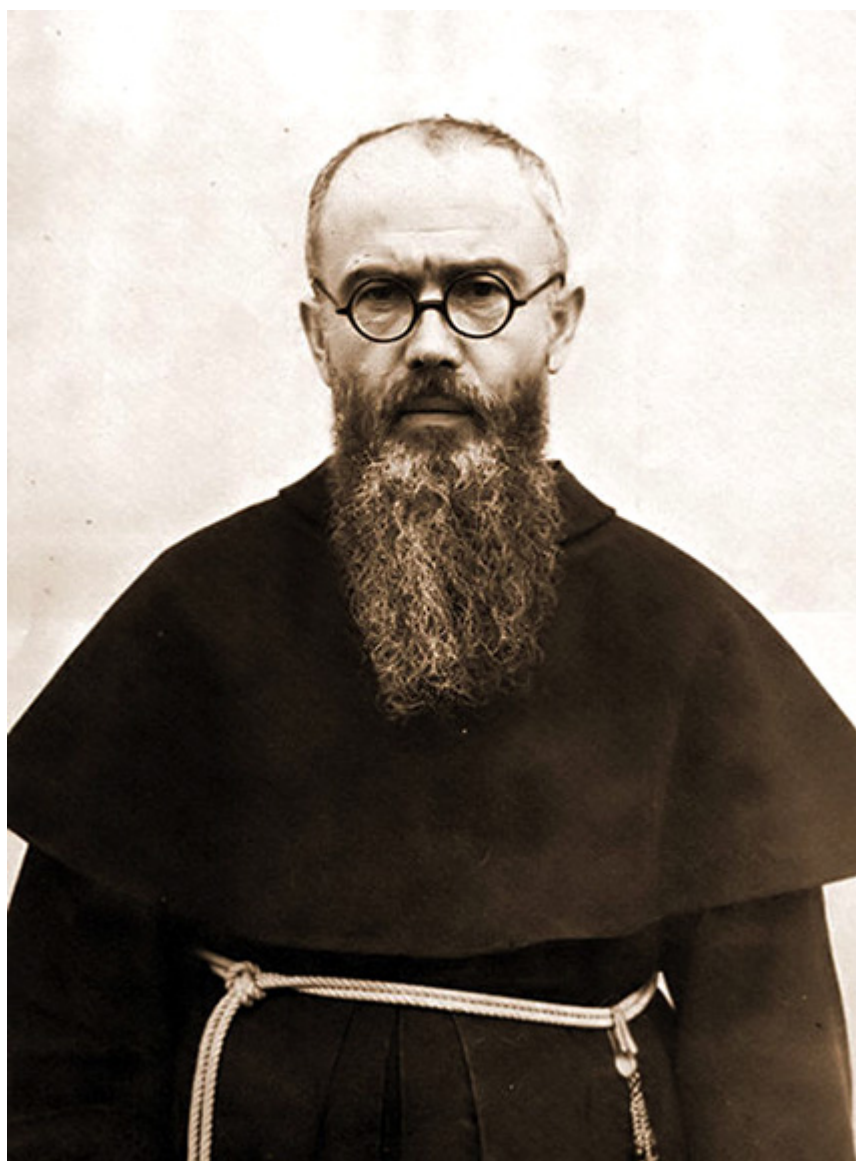
Ojciec Maksymilian Kolbe, 1936 r.

angielsku w amerykańskim Buffalo. We wszystkich tych sztukach epilogiem jest „Męka świętego Maksymiliana”, która może też funkcjonować samodzielnie. Była ona odczytywana przez trzech lektorów - tak jak czyta się Mękę Jezusa Chrystusa w Wielkim Tygodniu - w kościołach na terenie Polski, Kanadzie, Stanach Zjednoczonych. Pragnąłem nadal uczyć się od świętego, być jakoś blisko niego. Z tego pragnienia powstały otwierające ten tom - „Pieśni świętego Maksymiliana”. I tak jak ksiądz mówi - stał się on moim „towarzyszem podróży” w ostatnich latach. Jego „Regulamin życia” jest zarówno drogowskazem, jak też przypomnieniem, jak wiele mi brakuje do sprostania jego wymaganiom.