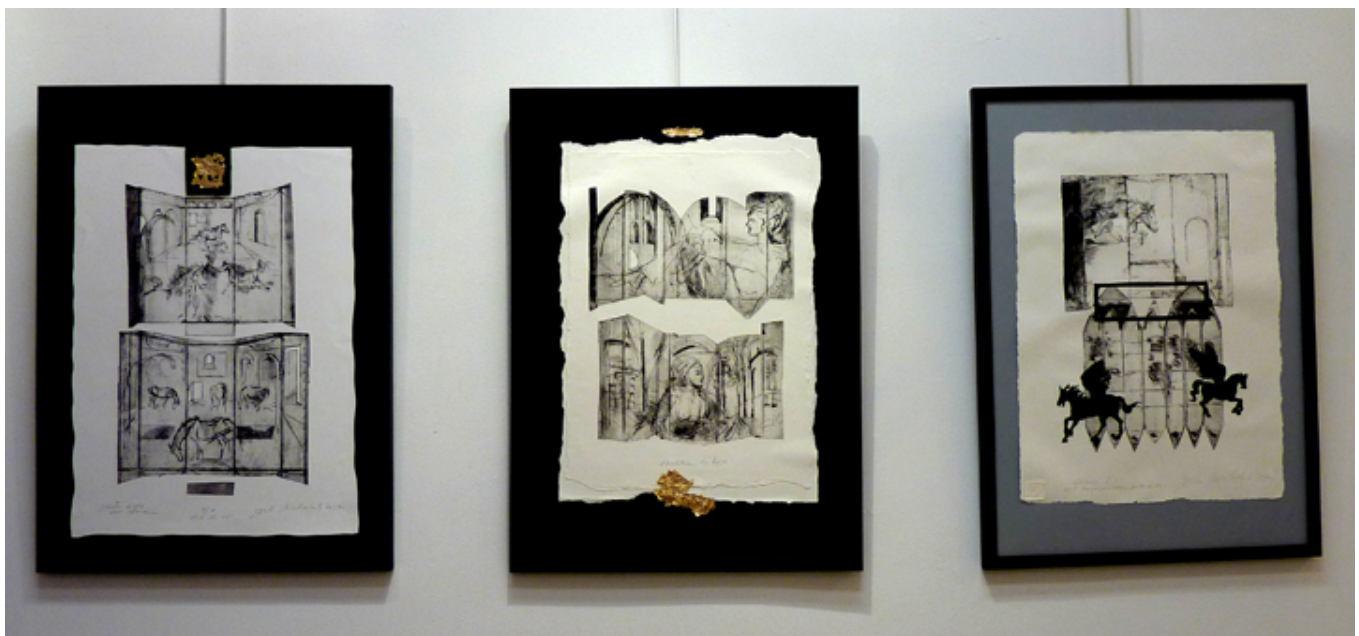
Wystawa prac Doroty Michaluk w Jadite Gallery na Manhattanie, fot. J. Sokolowska-Gwizdka.

Grafiki Doroty Michaluk pokazywane na wystawie w Jadite Gallery będzie można zobaczyć w maju 2018 roku podczas