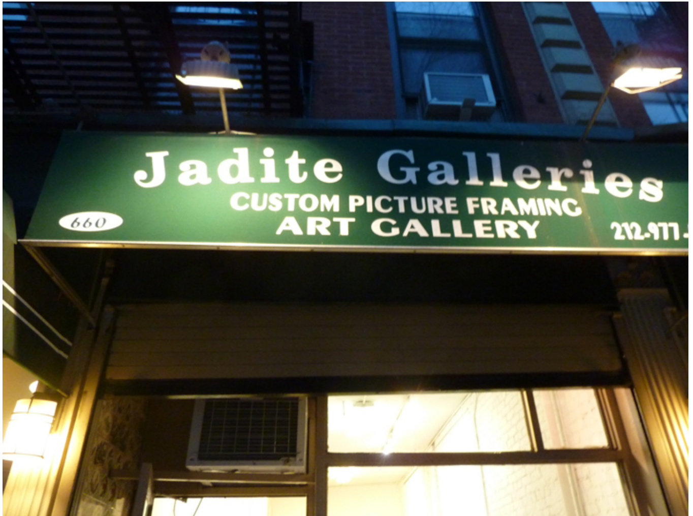
Wejście do Jadite Gallery na Manhattanie w Nowym Jorku, fot. J. Sokołowska-Gwizdka.