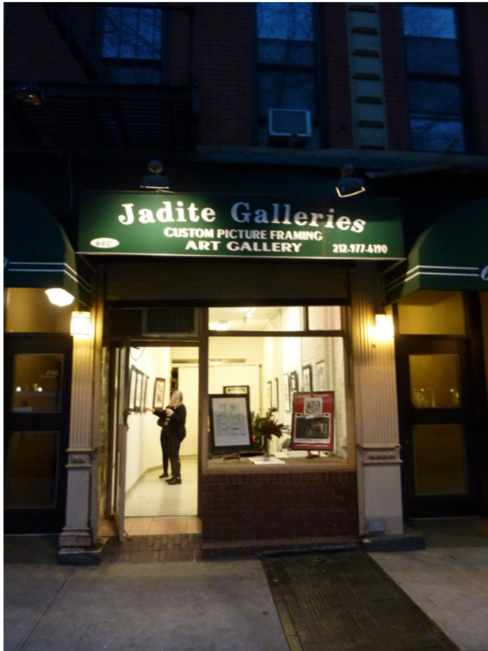
Wejście do Jadite Gallery na Manhattanie w Nowym Jorku.