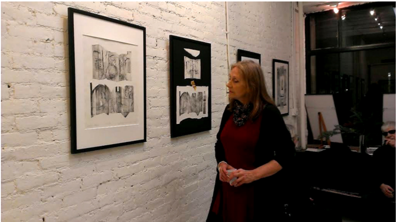
Wystawa prac Doroty Michaluk w Jadite Gallery na Manhattanie, fot. B. Maryanska.