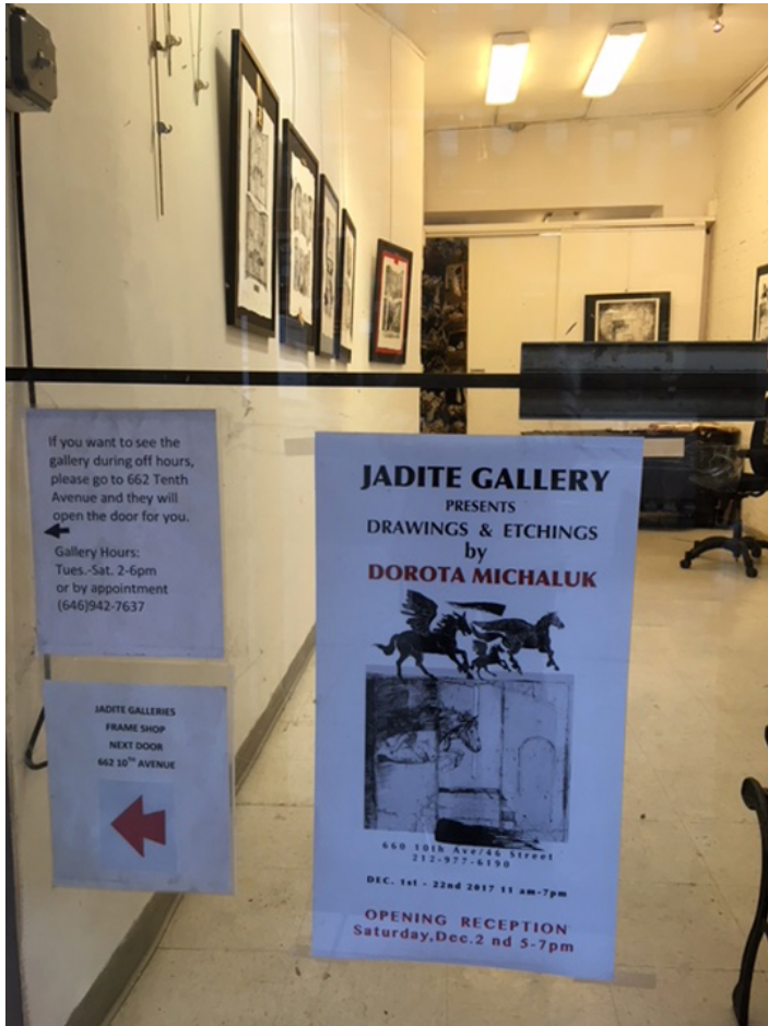
Wejście do Jadite Gallery na Manhattanie w Nowym Jorku, fot. B. Maryanska.