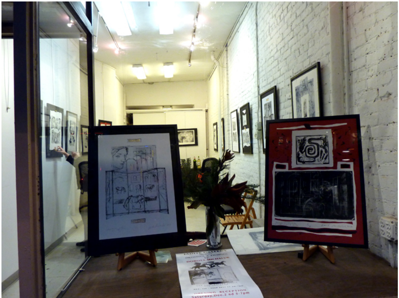
Wejście do Jadite Gallery na Manhattanie w Nowym Jorku, fot. J. Sokołowska-Gwizdka.