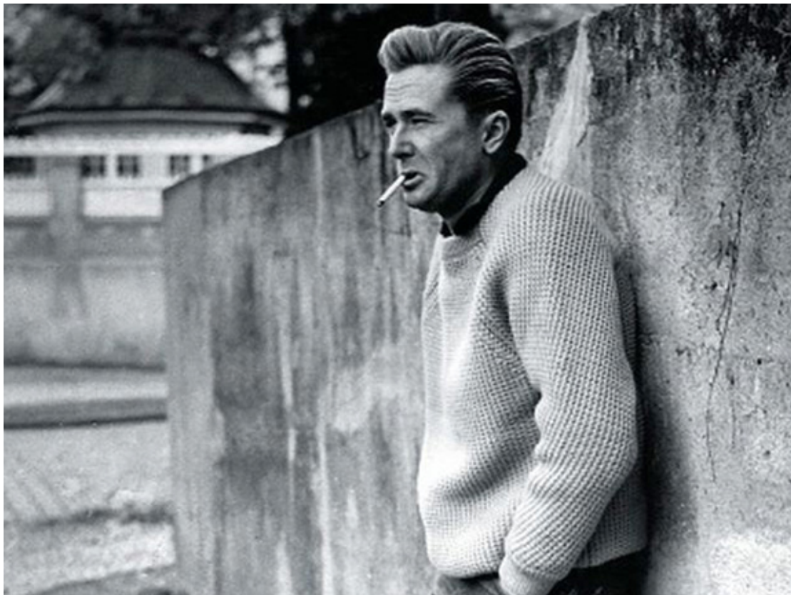
Marek Hłasko, 1958 r.