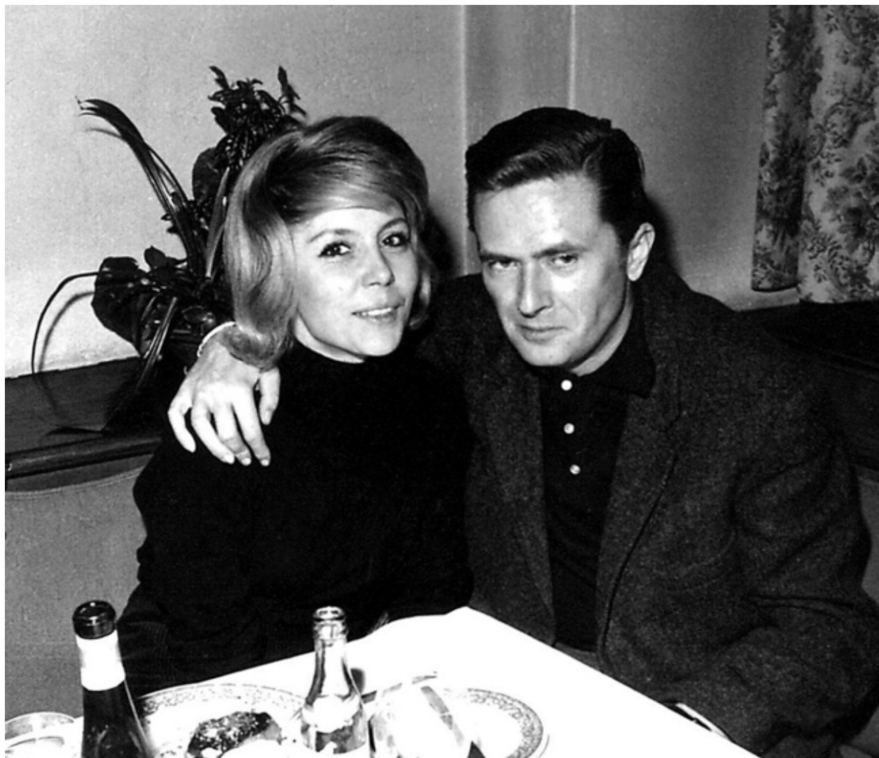
Marek Hłasko z żoną, niemiecka aktorką Sonją Ziemann