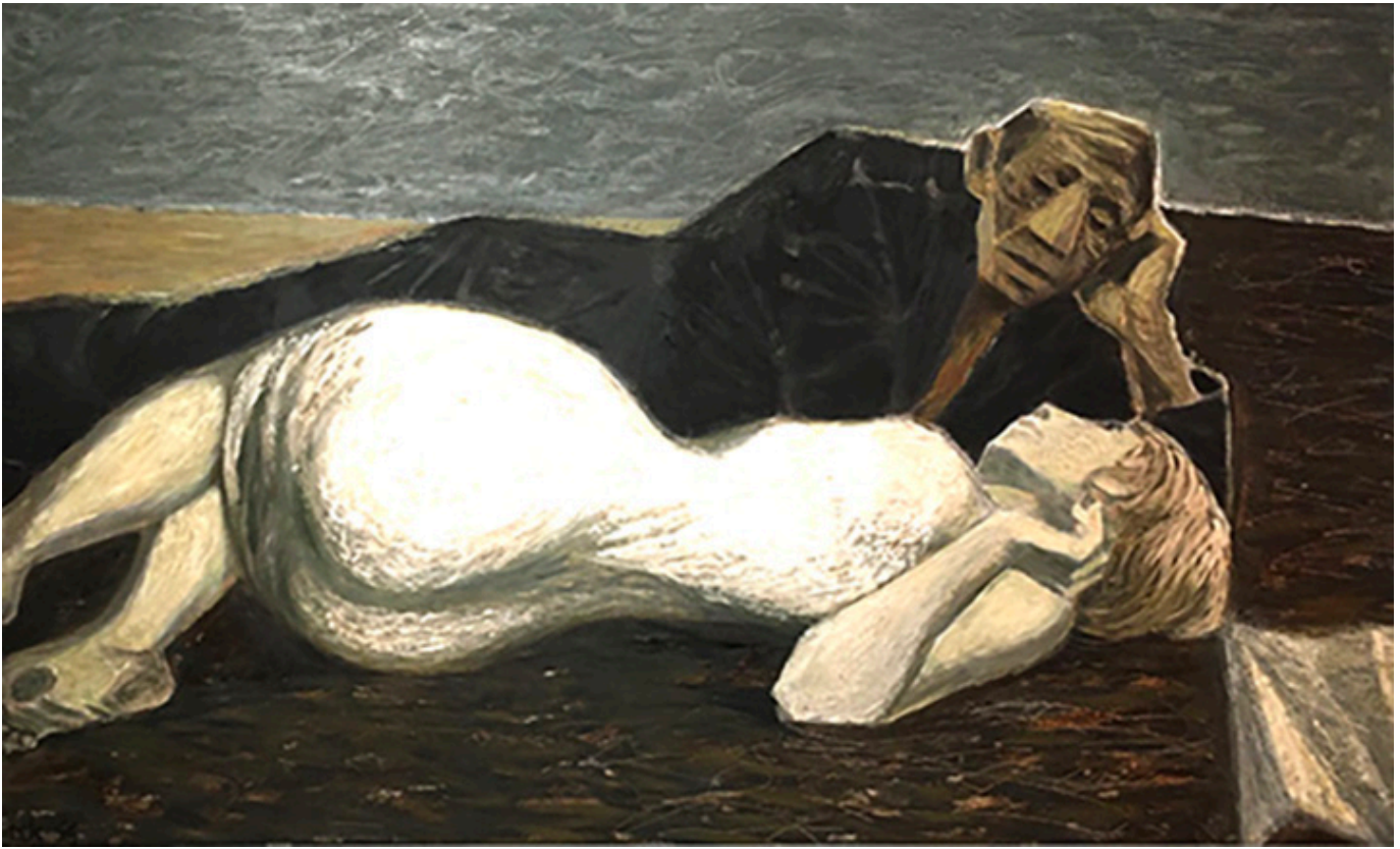
Rozmowa - Zakochani, 1956 r.