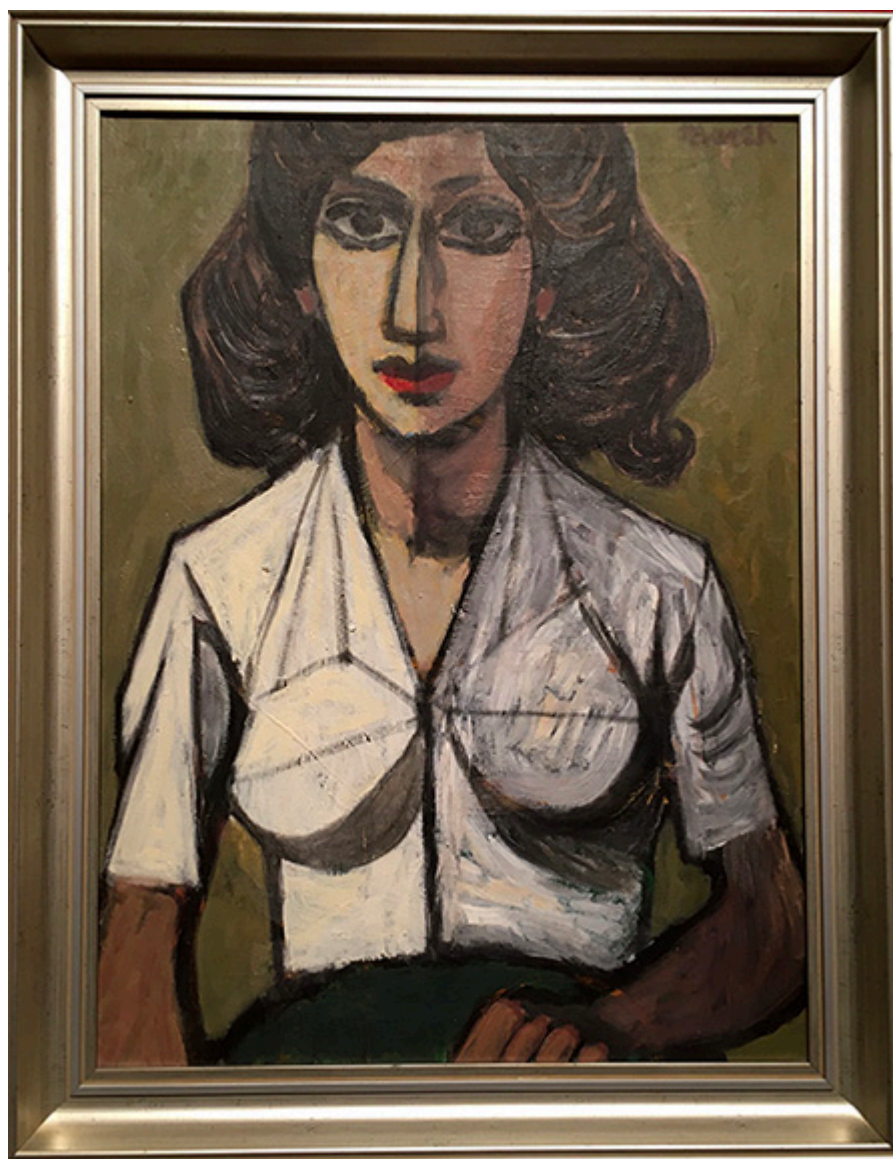
Żydówka, I poł. lat 50. XX w., olej na płótnie, 61×45,5 cm

Tak właśnie wyglądali wychudzeni wieśniacy we wczesnych obrazach Van Gogha. Dalej na tej samej ścianie zawieszono nieduży portret „Żydówki” (wczesne lata 1950-te), piękny, trafny, kubizujący. Nie sposób jest opisać wszystkie obrazy wstępnej sali. Poczuję już wtedy, że wystawa wprowadziła mnie we wzruszenie, zadumę, podziw i uznanie.