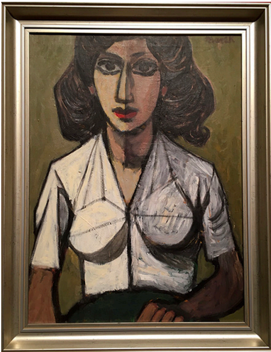
Żydówka, I poł. lat 50. XX w., olej na płótnie, 61×45,5 cm

Tak właśnie wyglądali wychudzeni wieśniacy we wczesnych obrazach Van Gogha. Dalej na tej samej ścianie zawieszono nieduży portret „Żydówki” (wczesne lata 1950-te), piękny, trafny, kubizujący. Nie sposób jest opisać wszystkie obrazy wstępnej sali. Poczulem już wtedy, że wystawa wprowadziła mnie we wzruszenie, zadumę, podziw i uznanie.