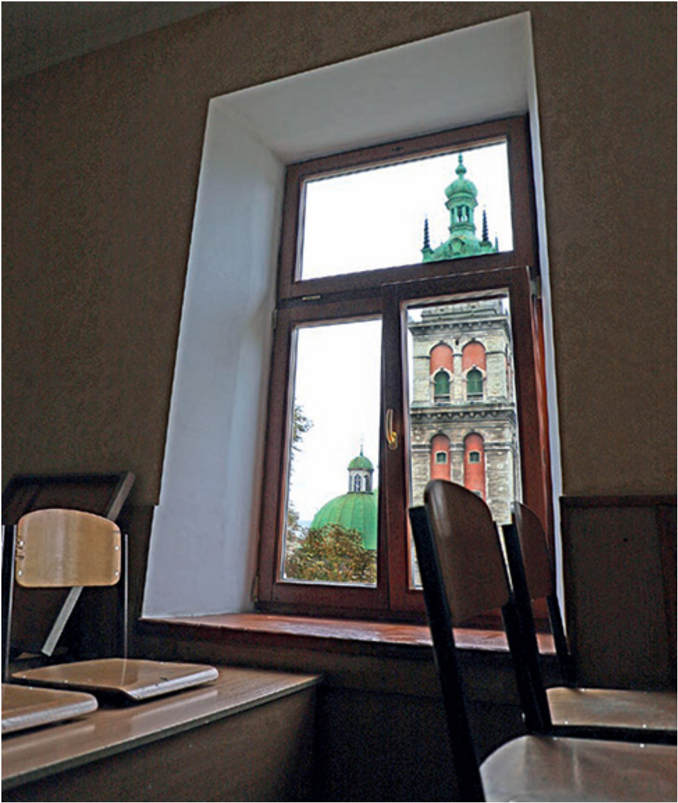
Widok z okna klasy dawnego II Państwowego Gimnazjum im. Karola Szajnochy na wieżę Korniaкта