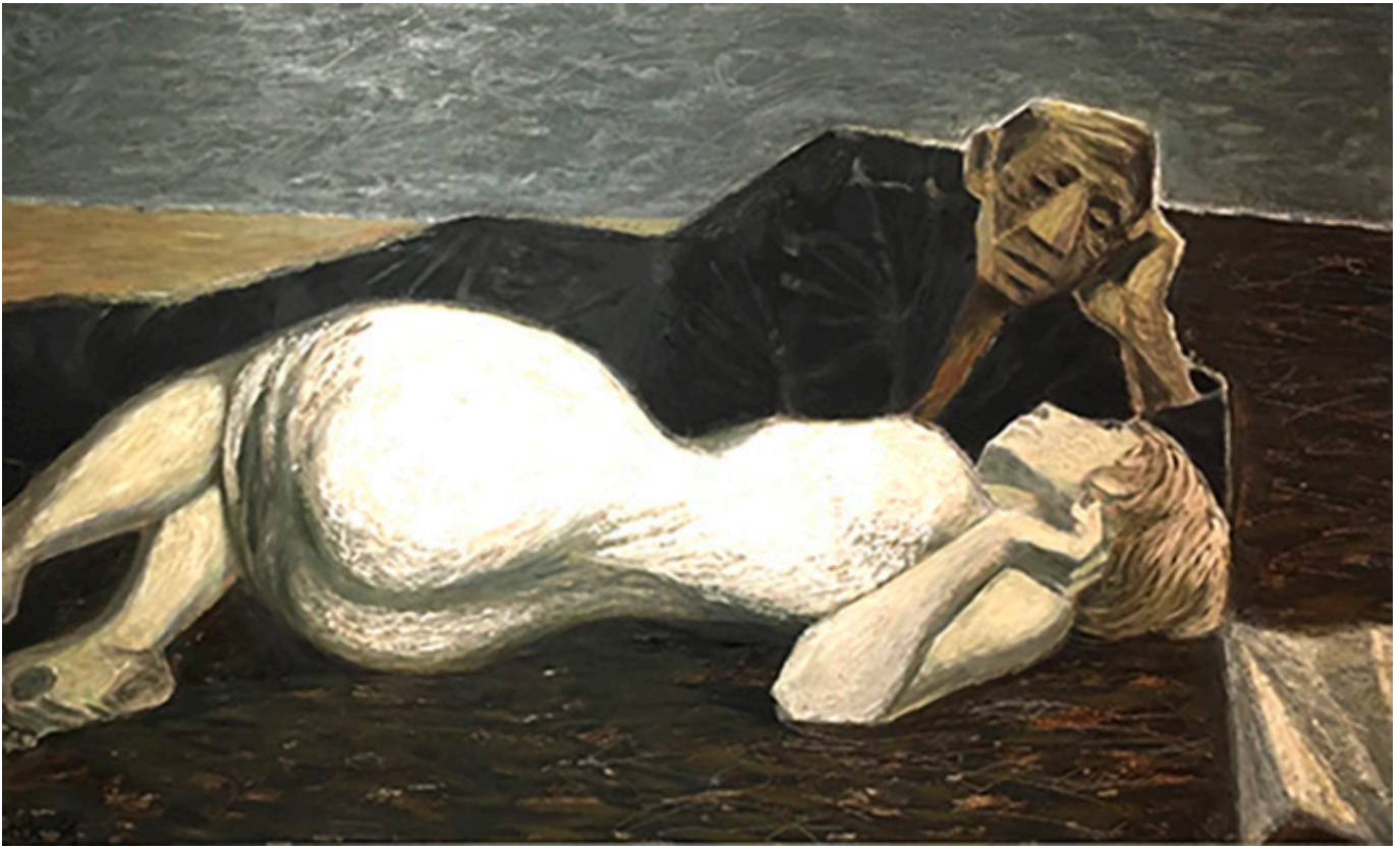
Rozmowa - Zakochani, 1956 r.