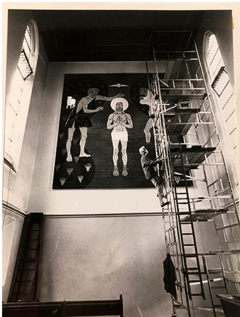
Prace przy renowacji fresku "Chrzest Pana Jezusa" w kościele "Wniebowzięcia N. M." w Londynie, 1988 r.