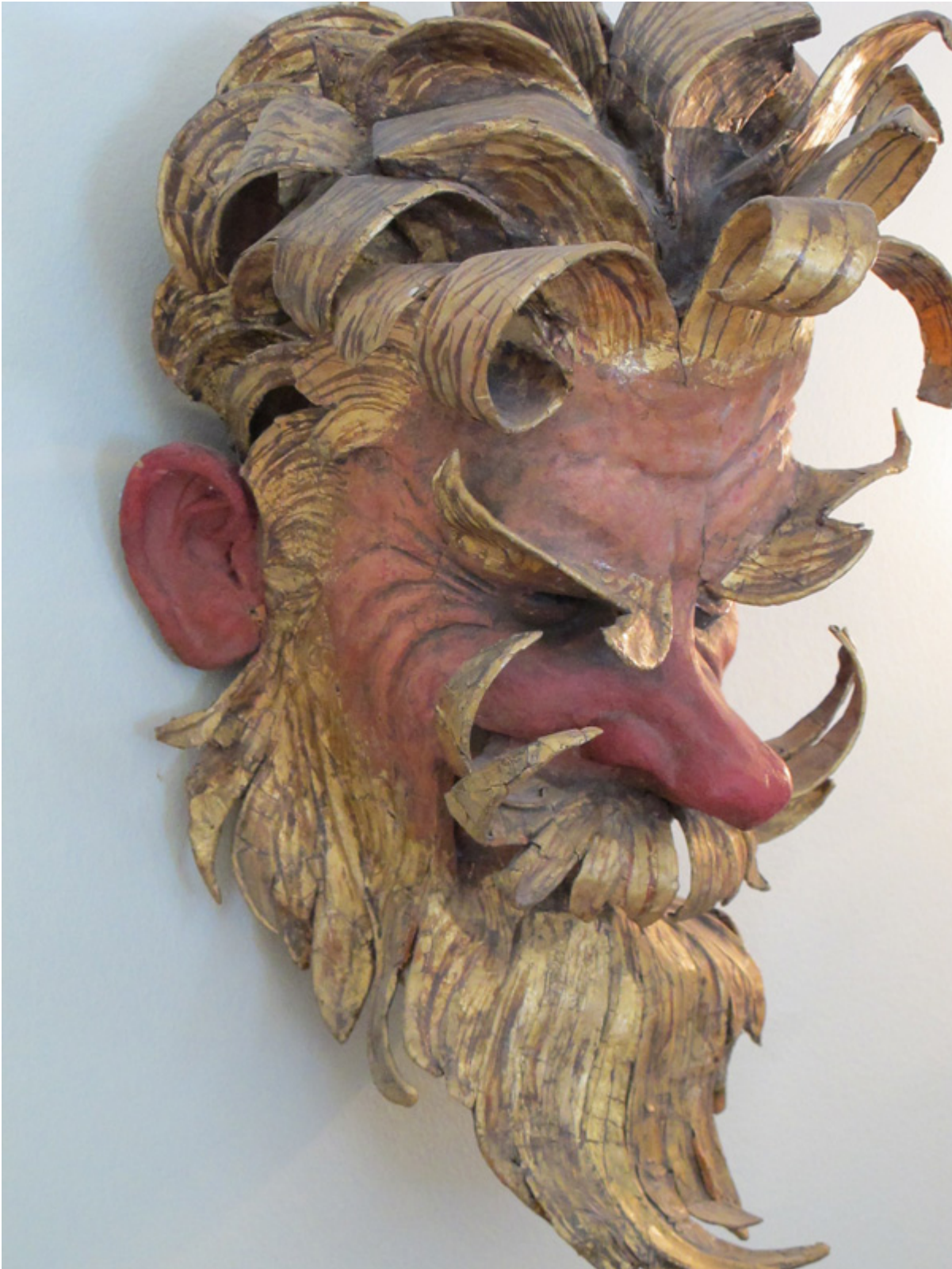
W. T. Benda, Maska The Old Wag, zbiory Ann Taylor, fot. ARS.