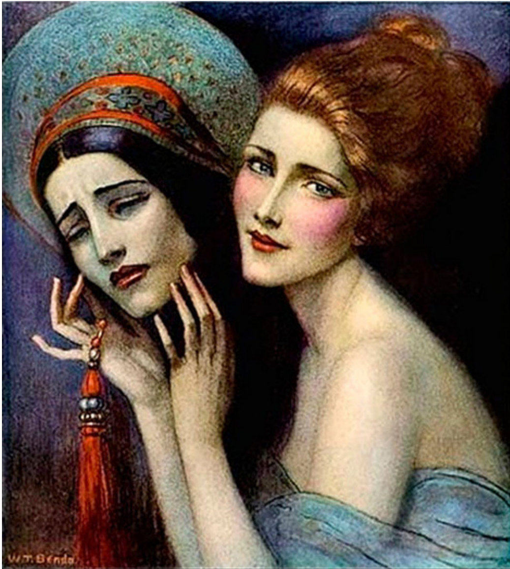
W.T. Benda, Kobieta z maską, okładka Life Magazine, 1922 r.

JSG: Czy rodzina WT Benda ma świadomość polskich korzeni, zna polską historię i postać Heleny Modrzejewskiej?