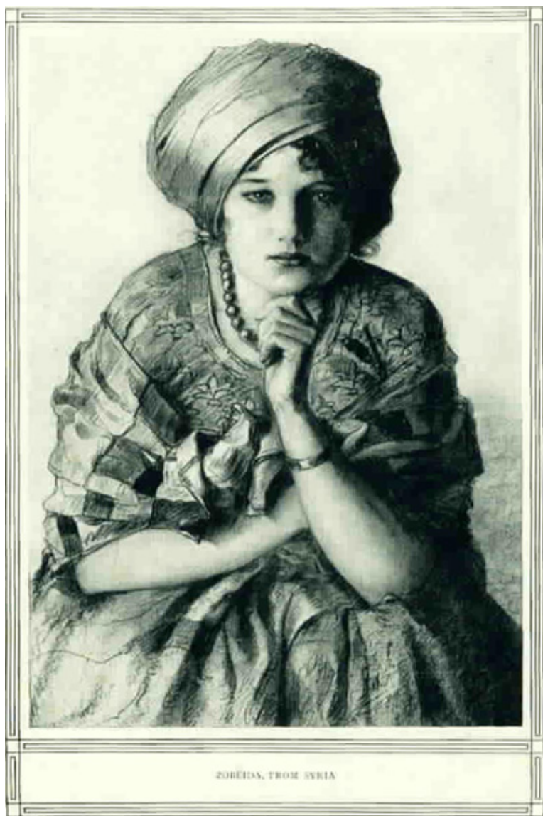
W. T. Benda, Zobeida from Syria, reprodukcja ilustracji, zbiory prywatne

Portrety kobiet zaś, to nawiązanie do trendu w sztuce amerykańskiej, a także wymogów rynku ilustracji i magazynów. Portrety były domeną sztuki amerykańskiej oraz obowiązującym tematem okładek, reklam. „Kobiety Benda” cechował charakter jego kreski. Każdy ilustrator, zwłaszcza ten już uznany i popularny (czyli często angażowany do pracy) posiada swój specyficzny sposób rysowania, dosyć łatwy do rozpoznania. Analizując postaci kobiet sygnowane ręką W.T. Benda uważa się, że były bardziej ludzkie, naturalne, ale i tajemnicze, pełne subtelności, kobiecego wdzięku. W wielu przypadkach W. T. Benda ilustrował postaci emigrantek, nieco innych od wizerunków białych Amerykanek, które tworzył choćby król ilustratorów słynny Charles Dana Gibson. Na wiele ilustracji W.T. Benda trzeba patrzeć przez