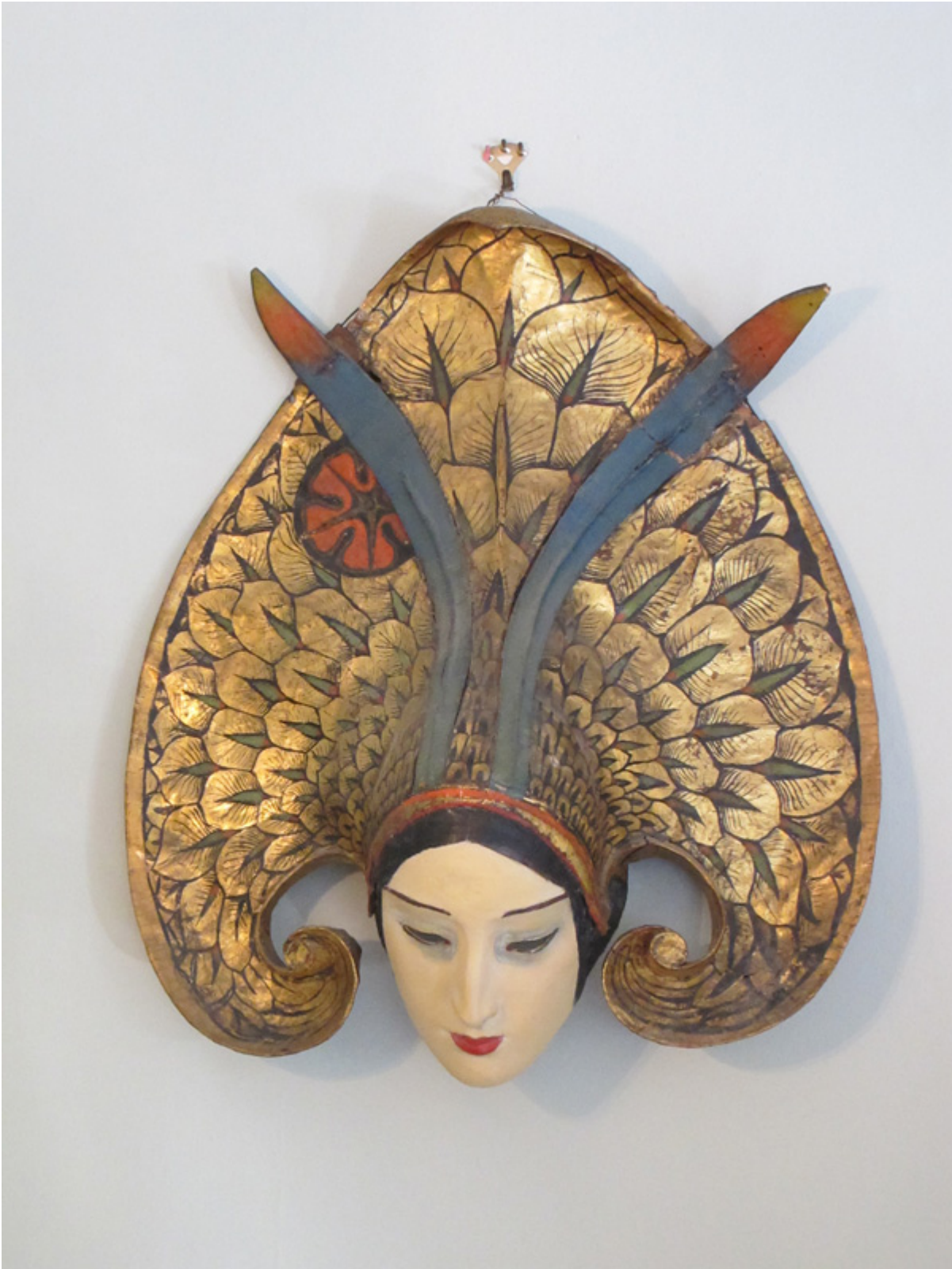
W. T. Benda, Maska Golden Goddess, zbiory Ann Taylor